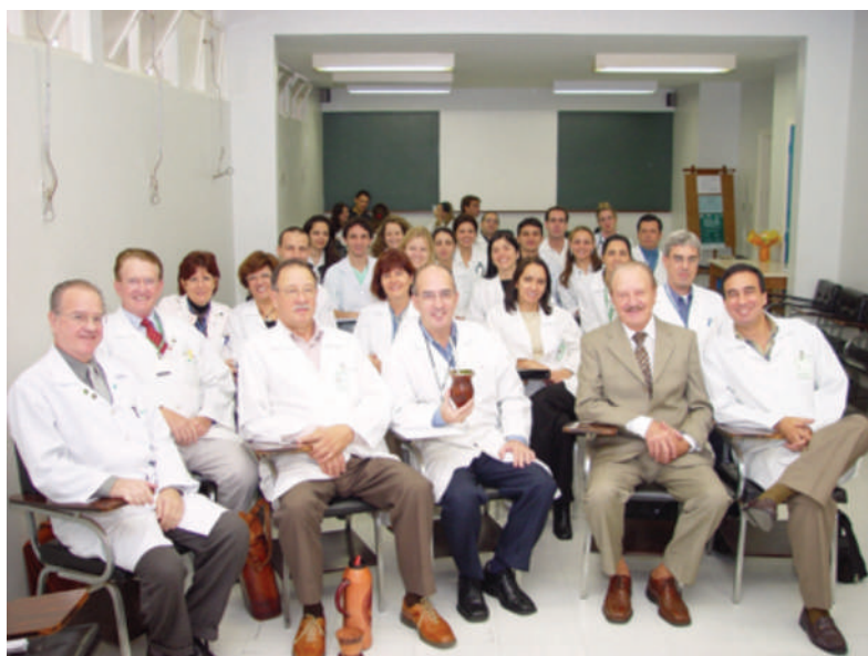
Reunião SGO 2004.