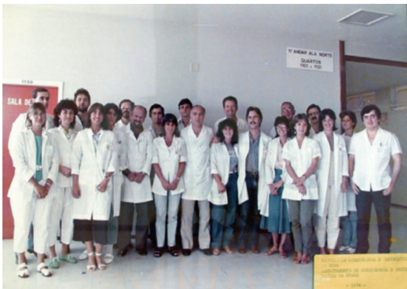
Serviço de Ginecologia e Obstetrícia, HCPA, 1984.