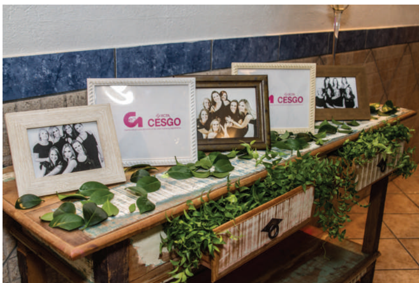
CESGO - Formatura dos Residentes 2013.