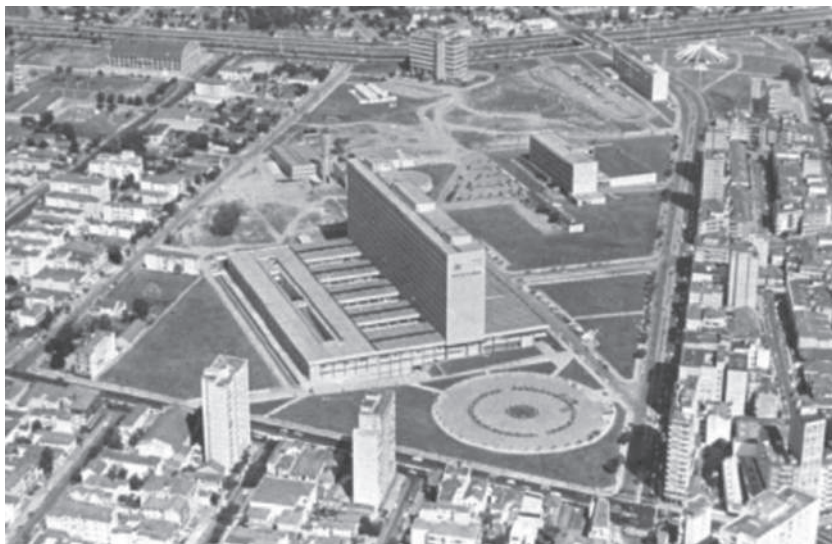
Hospital de Clínicas em 1970.