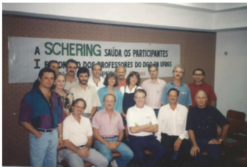
Encontro de professores do DGO 1993.