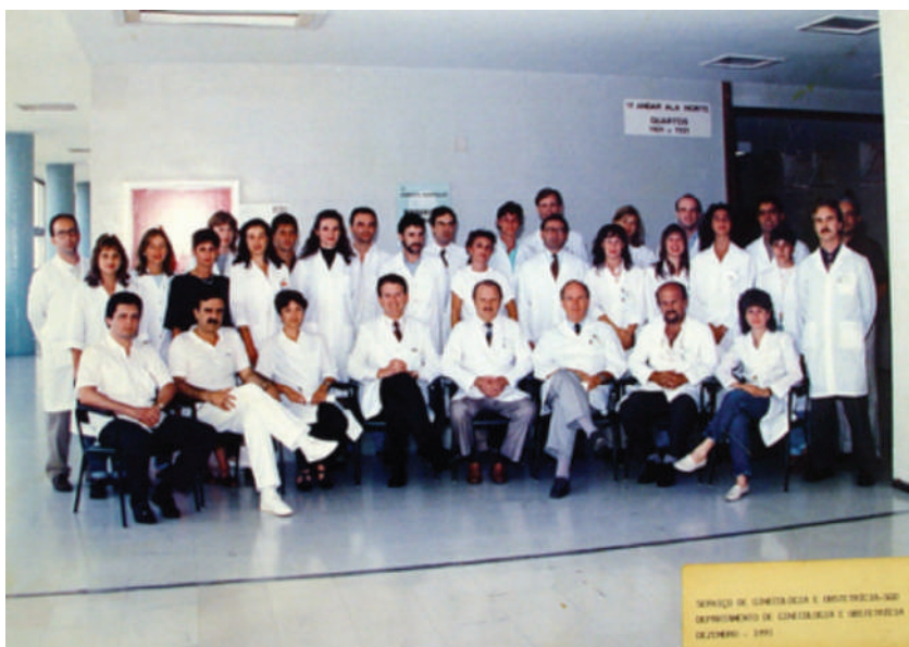
Serviço de Ginecologia e Obstetrícia, HCPA, 1991.