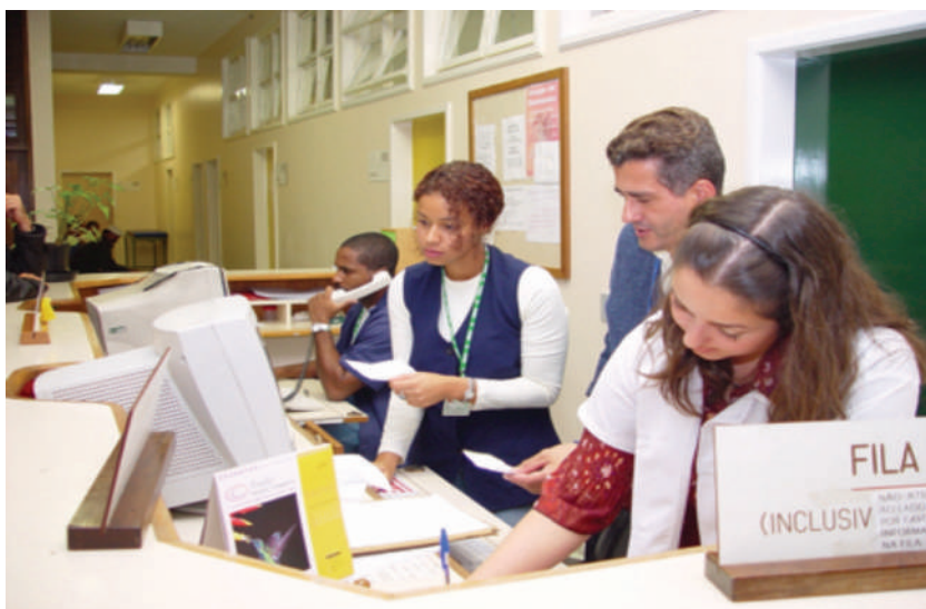
Recepção da Zona 6.