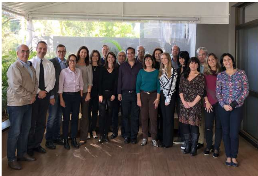
Encontro DGO 2018