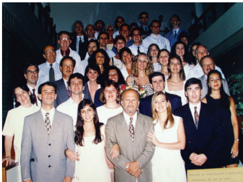
Serviço de Ginecologia e Obstetrícia, HCPA, 1995.