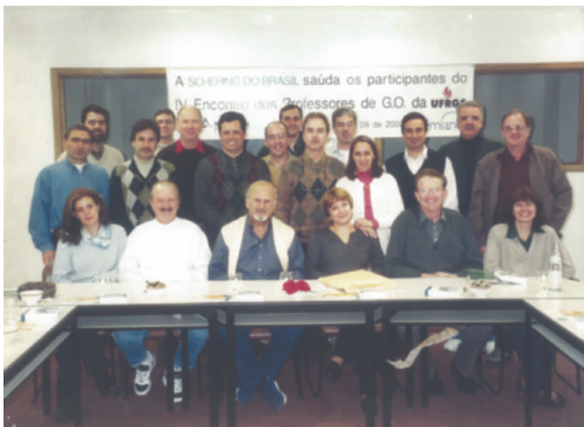
Encontro de professores do DGO 2000.