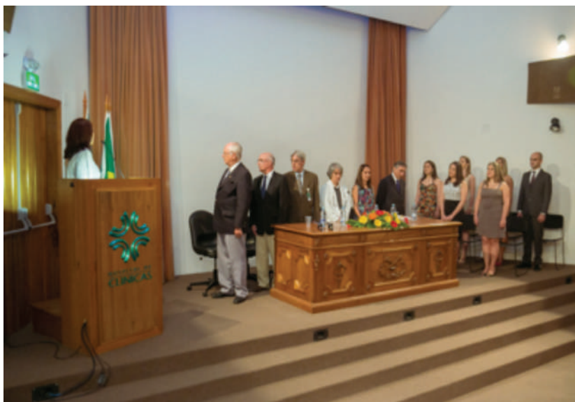
Formatura dos Residentes em Ginecologia e Obstetrícia, 2013.