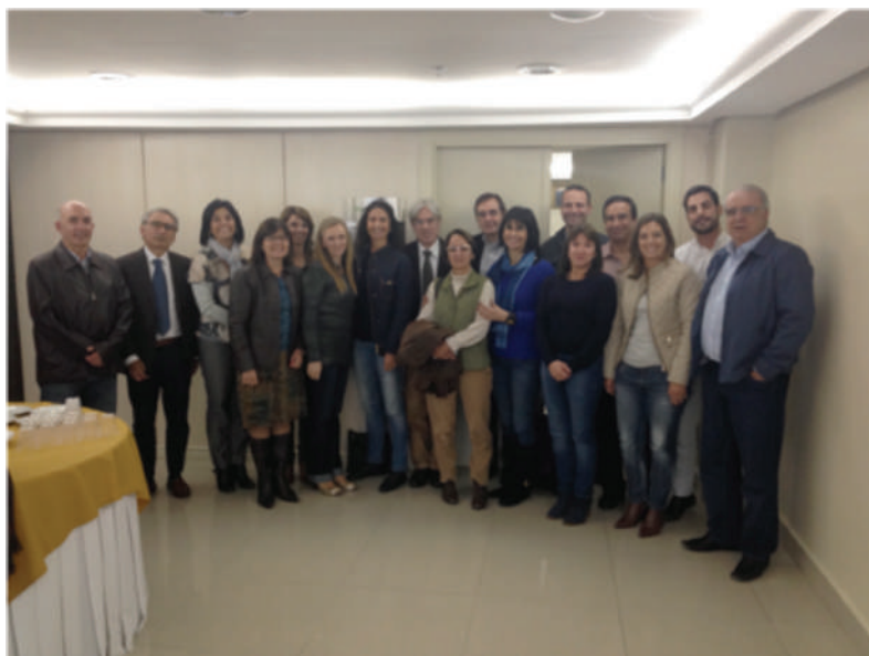
Encontro de professores do DGO 2015.