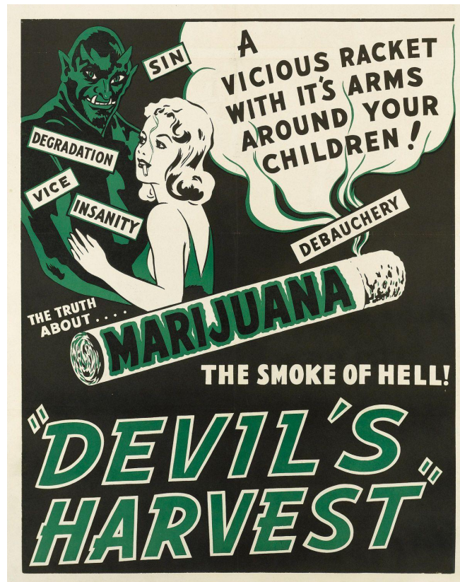
Figura 1: Devil's Harvest

desejos sexuais incontroláveis, levando ao estupro e a orgias, baseados em pesquisas forjadas pelas autoridades da época (Lunardon, 2015). Inclusive, em 1941 é lançado um filme com intuito educativo, onde um investigador vai atrás de pessoas que estão corrompendo a juventude norte-americana com a chamada ‘erva de Satã’ (figura 1).