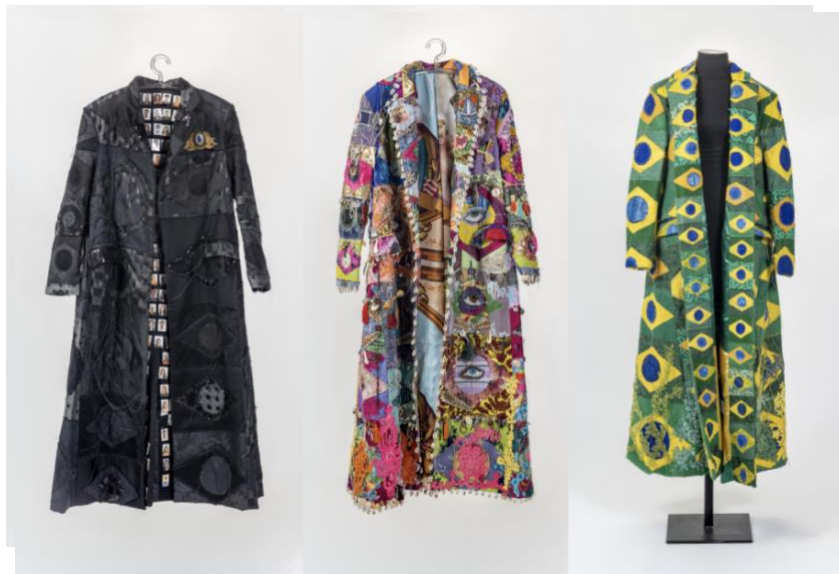
Figura 10: Jaime Lauriano e João Pimenta Filho. Peça 1, Peça 2 e Peça 3 , 2019-20