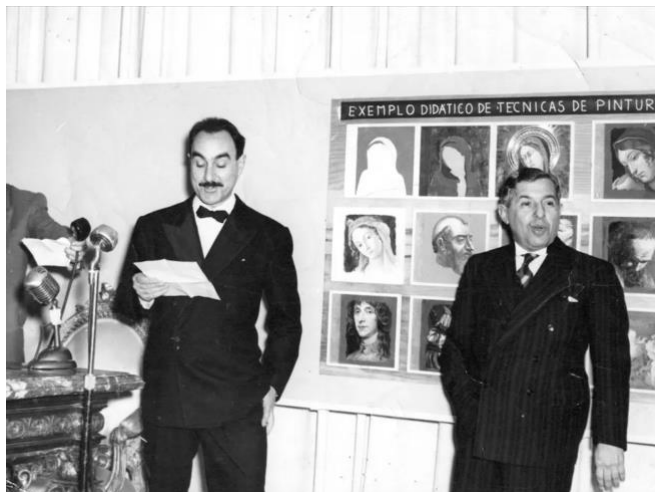
Figura 3: Pietro Maria Bardi discursa ao lado de Assis Chateaubriand.

Fonte: Arquivo e Centro de Documentação do MASP. Reprodução: Casa Vogue. Disponível em: https://casavogue.globo.com/lazer-e-cultura/arte/noticia/2022/10/75-anos-do-masp-7-curiosidades-que-voce-nem-imagina-sobre-o-museu.ghtml Acesso em: 03 abr. 2023.