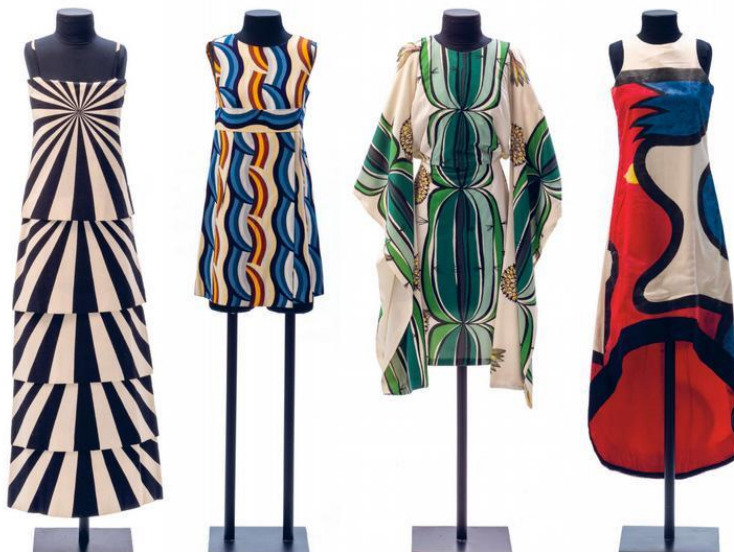
Figura 15: obras da Coleção MASP Rhodia.