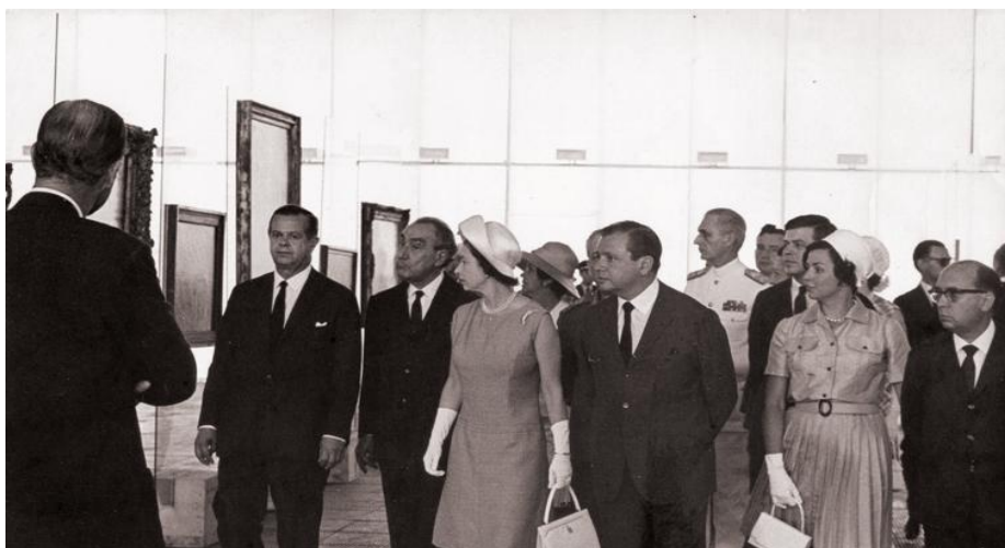
Figura 5: Rainha Elizabeth II (ao centro) visita a nova sede do MASP com Pietro Maria Bardi (à sua direita).