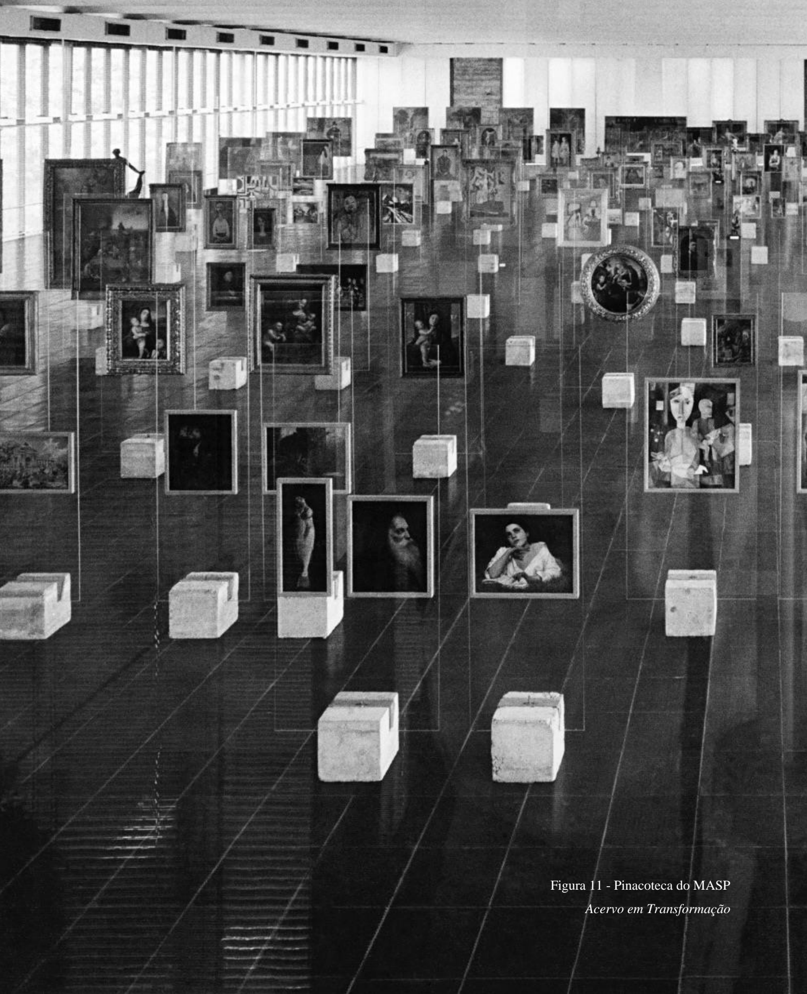
Figura 11 - Pinacoteca do MASP Acervo em Transformação