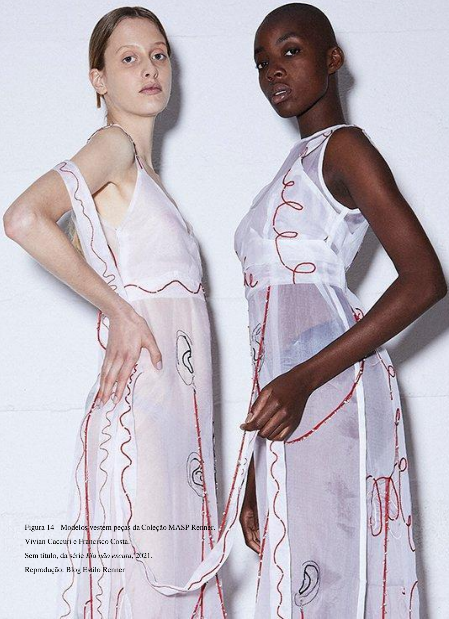
Figura 14 - Modelos vestem peças da Coleção MASP Renner.