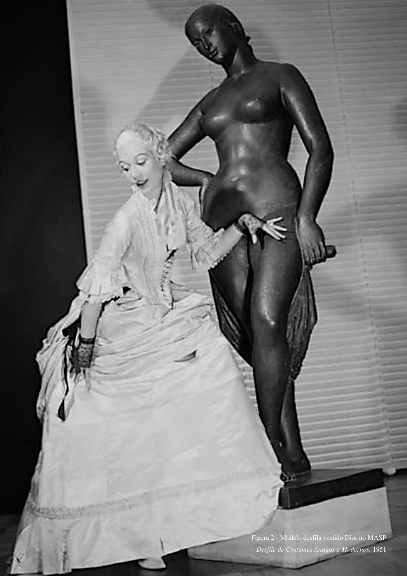
Figura 2 - Modelo desfila vestido Dior no MASP Desfile de Costumes Antigos e Modernos, 1951