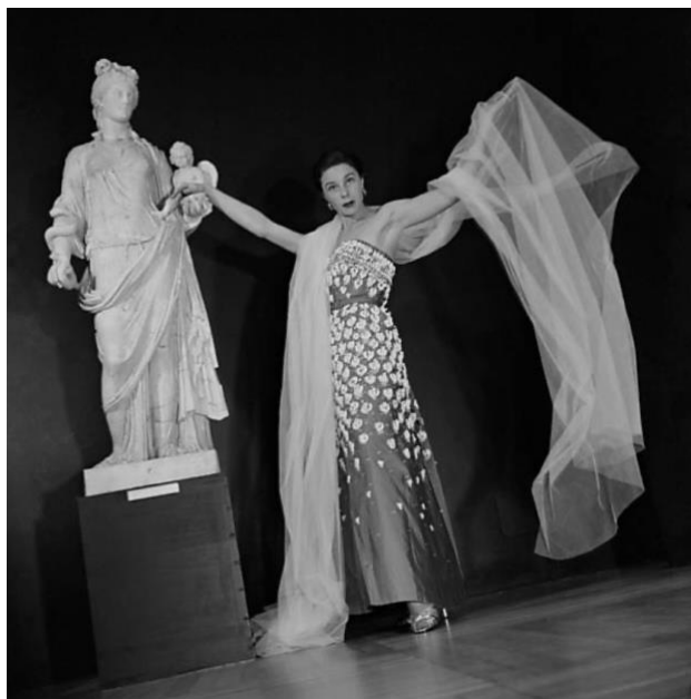
Figura 12: Modelo desfila vestido Dior no MASP (1951)