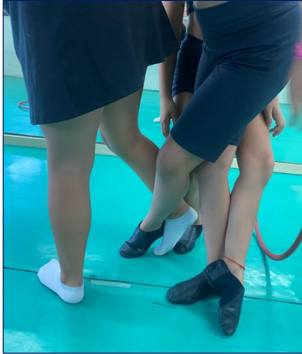
Figura 6 – Corpo magnético

soltar novamente. Em cada rodada, o professor propõe diferentes partes corporais e sugere a dinâmica em dupla, trio, quarteto, quinteto, se prefere toda turma reunida.