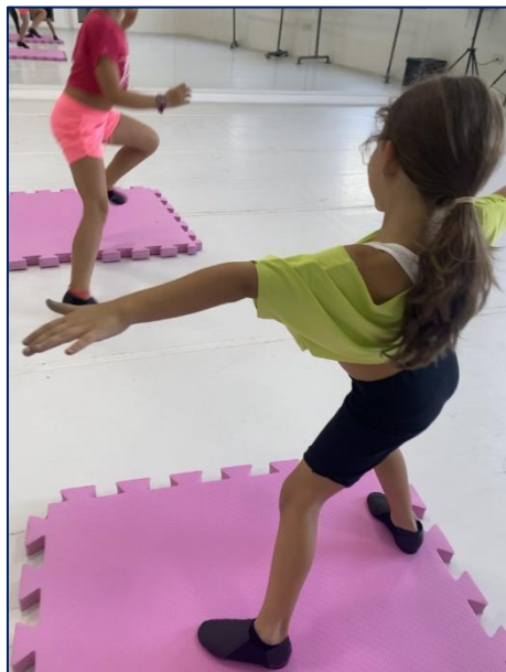
Fotografia 2 – Vem pra banda!

O jogo inicia com um colchonete a menos do que a quantidade de participantes, dispostos em círculo na sala. O professor deve iniciar tocando um pandeiro e ditando o ritmo do jogo. Sendo assim, o líder da banda se forma mais tarde. Logo que o líder toca, os demais participantes devem caminhar em volta do círculo no ritmo proposto. Quando o líder para de tocar, os participantes procuram um colchonete para sentar, aquele que fica sem colchonete se junta à banda e passa a ser o líder, ditando o ritmo e a pausa aos colegas. O último a permanecer com um colchonete vence o jogo.