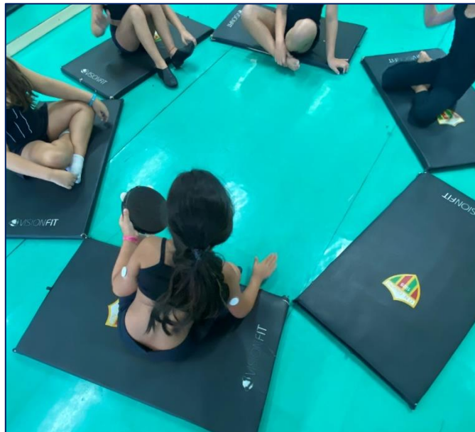
Fotografia 1 – Combin(ação) de sons

As crianças devem estar dispostas pela sala sentadas em roda com um pandeiro em mãos. Um participante inicia o jogo propondo uma sequência rítmica que deve ter o uso obrigatório do pandeiro e de alguma percussão corporal, como, por exemplo, batida no pandeiro na contagem 1-2 e estalando os dedos 3-4. Em seguida, todos os alunos respondem através da mesma sequência. Ao terminar, o participante que propôs a sequência rítmica escolhe um novo participante. Ele deve reproduzir a sequência anterior e propor uma nova, para que, em seguida, todos juntos toquem as duas sequências rítmicas. De forma acumulativa, o grupo inteiro participa propondo sequências e formando uma combinação de sons, a música da turma.