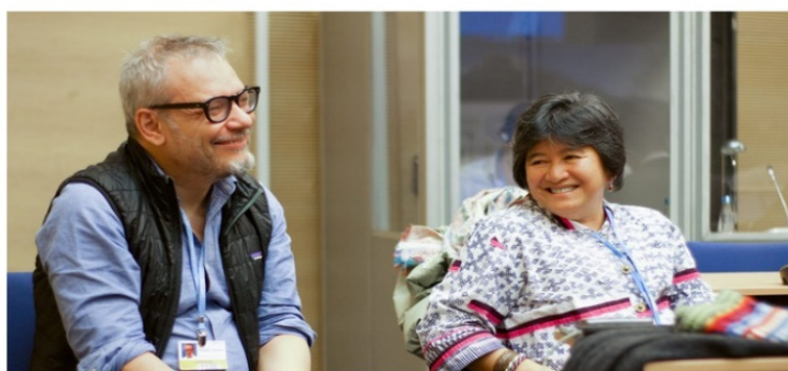
Figura 1: Reportagem sobre Direitos Humanos