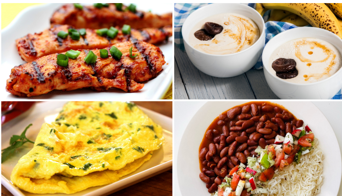
Figura 9. Exemplo de alimentos fonte de proteínas: ovos, feijão e arroz, peito de frango e iogurte.