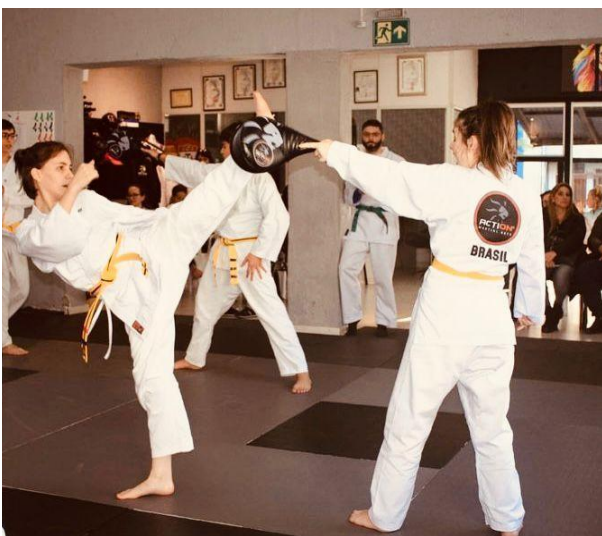
Figura 2. Exame de graduação no taekwondo .

Com a regularização do esporte pela KTA, foi criado o primeiro estilo de taekwondo : o ITF (INFANTE, 2013). Criado pelo general Choi Hong Hi , o ITF, hoje é considerado o estilo mais praticado no mundo, e suas categorias são divididas por idade, sexo e peso (INTERNATIONAL TAEKWONDO FEDERATION, 2022). Posteriormente, foi criada a ATA, que introduziu o estilo songahm , que utiliza técnicas de defesa pessoal, rupturas de madeira, uso de armas orientais, torções e imobilizações (VALIN; URBINATI, 2010). As competições são baseadas em níveis de faixa, sexo e faixa etária, sem divisões por peso. Por fim, a WTF é o órgão reconhecido internacionalmente por competições de estilo olímpico voltadas para a marcação de pontos, na qual as categorias competitivas são divididas a partir do peso, sexo e faixa etária dos atletas (WORLD TAEKWONDO, 2022).