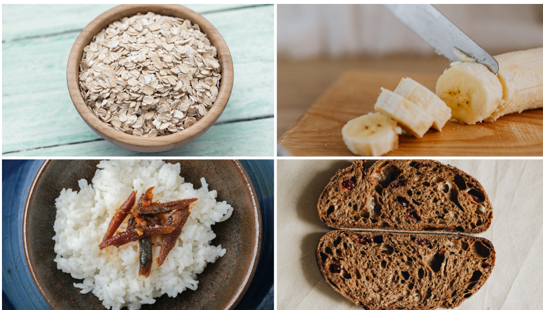
Figura 7. Exemplo de alimentos fonte de carboidratos: aveia, banana, arroz e pão.