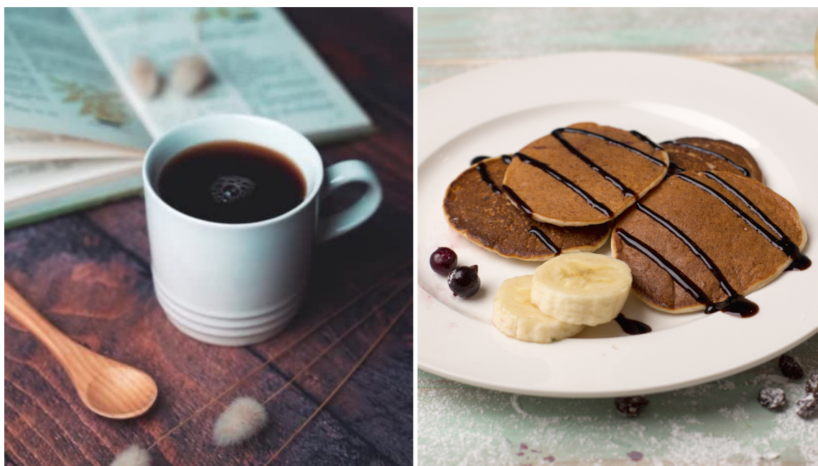
Figura 8. Exemplo de refeição rica em carboidrato pré-treino ou competição: panquecas de aveia com banana.