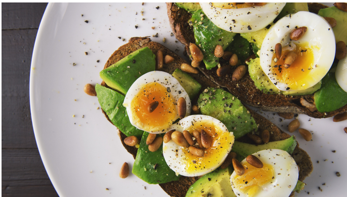
Figura 11. Exemplo de lanche nutritivo com ingredientes ricos em gorduras: torrada de abacate com ovos de galinha e azeite de oliva.