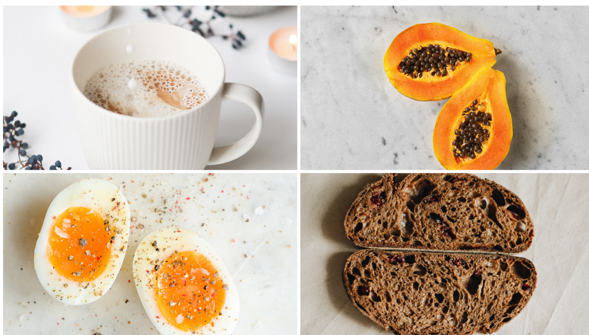
Figura 6. Exemplo de café da manhã com diferentes grupos alimentares: café com leite, mamão, ovo e pão integral.

O café da manhã é uma das principais refeições do dia, essencial para promover energia para as atividades diárias, promover bem estar e garantir melhores resultados durante os treinos, principalmente para indivíduos que treinam pela manhã. Muitas vezes as pessoas não conseguem ter apetite no primeiro horário do dia, devido a uma ingestão mais pesada no jantar da noite anterior (CLARK, 2021) ou, até mesmo, por simples falta de hábito. Logo, é necessário distribuir bem as refeições para garantir uma alimentação mais equilibrada.