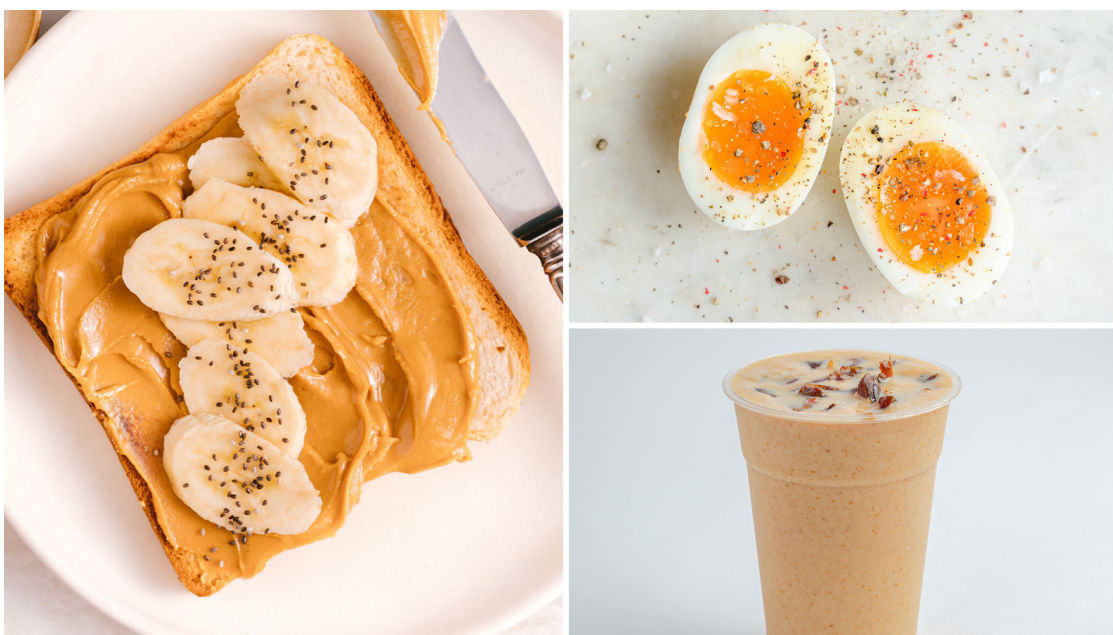
Figura 10. Exemplo de refeição pós-treino rica em proteína e carboidrato: pão com pasta de amendoim e banana, ovo de galinha e vitamina de leite com aveia.