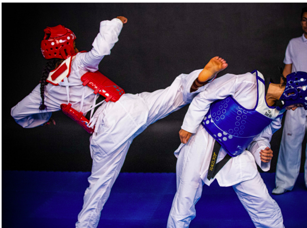
Figura 4. Combate de taekwondo .

O metabolismo aeróbico se caracteriza pelo uso de oxigênio e nutrientes como glicose e ácidos graxos, produzindo muito mais energia, porém de forma mais lenta, viabilizando suportar longos volumes de treino. Enquanto o metabolismo anaeróbico, podendo ser com ou sem a produção de lactato, produz menor quantidade de energia, contudo de forma mais rápida. Quando não há produção de lactato, é chamado de metabolismo anaeróbio alático, o qual utiliza a fosfocreatina como substrato para fornecimento imediato de energia (KATCH; KATCH; MCARDLE, 2016). Estes conceitos metabólicos básicos são necessários para compreender o papel da nutrição na melhora do desempenho físico, manutenção da intensidade de treinamento e recuperação dos atletas durante a prática e competições de taekwondo .