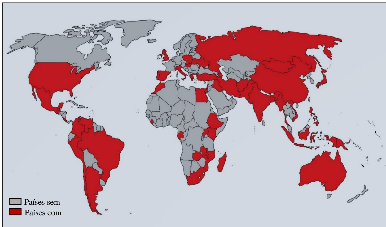
Figura 1 - Distribuição mundial de Spirocerca lupi .

mas já foi encontrado em diversos canídeos selvagens, e eventualmente em felídeos (VAN DER MERWE et al., 2008; HOSSEINI et al., 2018). Cães errantes, urbanos, de caça, adultos e de raças grandes foram os mais descritos como acometidos por S. lupi quando comparados aos domiciliados, filhotes e de raças pequenas. Embora não exista predileção de raça, o estilo de vida do animal e o acesso ao HI e HP são fatores determinantes para a infecção (DVIR; KINBERGER; MALLECZEK, 2001). No tocante a distribuição mundial, o trabalho de Cezaro; Coppola; Schmidt (2016), compila dados e informa a presença de S. lupi em diversos países. O trabalho de Rojas, Dvir, Baneth (2019) corrobora com os dados encontrados por Cezaro; Coppola; Schmidt (2016), e ainda apresenta localidades distintas de ocorrência da espirocercose. Ainda há relato da presença do nematódeo no Chile (SUBIABRE; TORRES, 2022), na Costa Rica (PORRAS-SILESKY et al., 2022), no Moçambique (FONSECA; LAISSE, 2014), na China (LIU et al., 2013), no Vietnã (HOA et al., 2021), na Índia (DHANDAPANI et al., 2021), na Rússia (BRENNER et al., 2020), na Austrália (DE CHANEET; BRIGHTON, 1972), na Mongólia (DUGAROV; BALDANOVA; KHAMNUEVA, 2018) e no Egito (ABUZEID, 2015). O mapa abaixo espelha todos os dados agrupados (Figura 1).