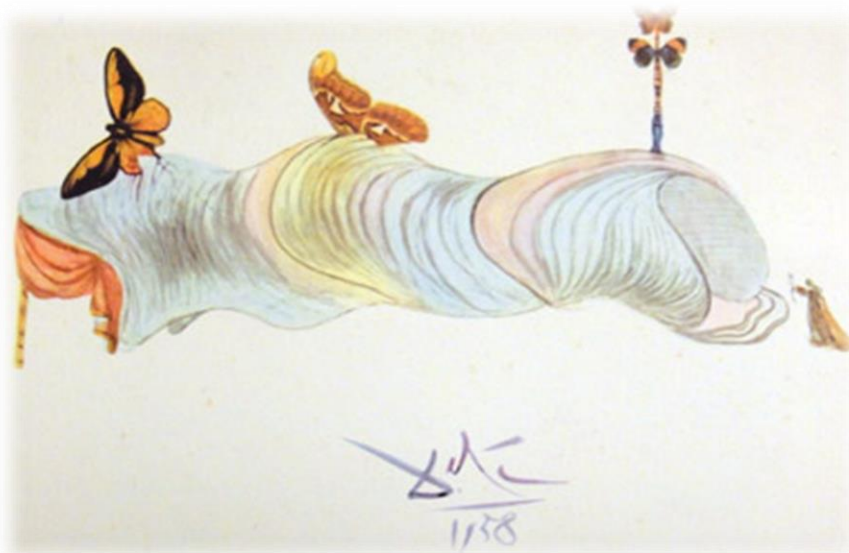
Figura 1 - Crisalida (1958), de Salvador Dalí, anúncio encomendado pela Wallace Laboratories