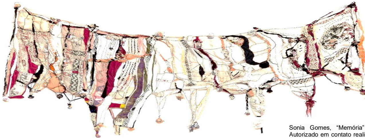
Sonia Gomes, "Memória" (2004). Autorizado em contato realizado em 21 de abril de 2022.