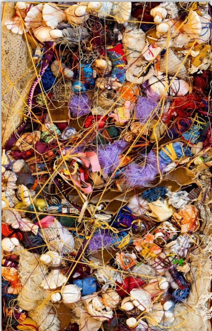
Sonia Gomes, "Casulo" (2006), costura, amarrações, tecidos, rendas e fragmentos diversos sobre eucatex, 80x44cm. Autorizado pela autora em contato realizado em 21 de abril

"Todos nós lá em casa tomamos alguma medicação para lidar com essa situação, é necessário para dar conta de tudo. Eu sei, eu sei... deveríamos dar continuidade na terapia em família, mas, sabe como é, nosso tempo é muito curto para essas coisas."