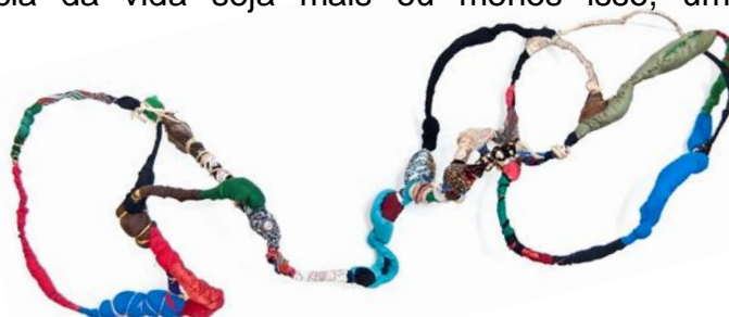
Sonia Gomes, sem título, da série Torções (2020), costura, fio galvanizado e tecidos diversos. Autorizado pela autora em contato realizado em 21 de abril de 2022.

As relações que construímos com livros, diálogos, vídeos, filmes e também com o outro, parte das próprias experiências e inquietações, vão se constituindo a partir de fios que vão sendo tecidos em rede, na escuta com o outro. Deslocar conjuntamente a tessitura desses fios pode nos mostrar caminhos inimagináveis e surpreendentes. Talvez a experiência da vida seja mais ou menos isso, um emaranhado de relações.