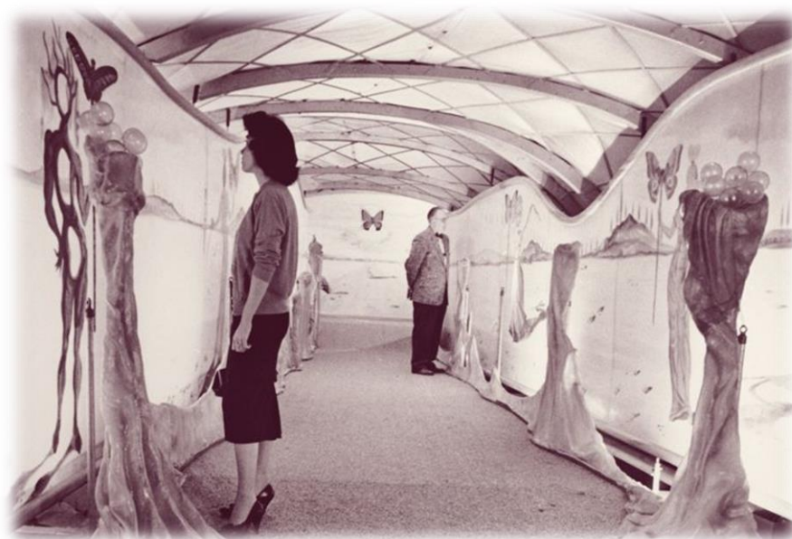
Figura 2 - Instalação de Crisalida (1958), de Salvador Dalí