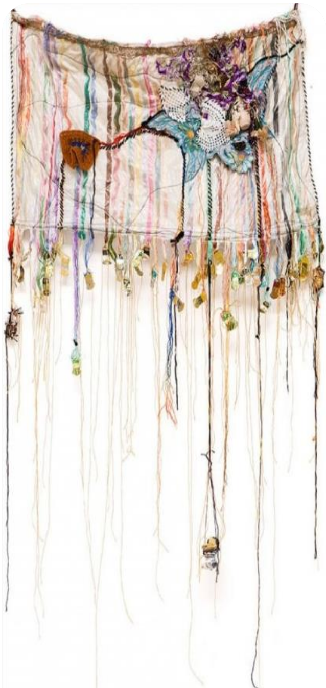
Sonia Gomes, sem título (2016), costura, amarrações, tecidos e rendas variadas, 126x82cm. Autorizado pela autora em contato realizado em 21 de abril de 2022.