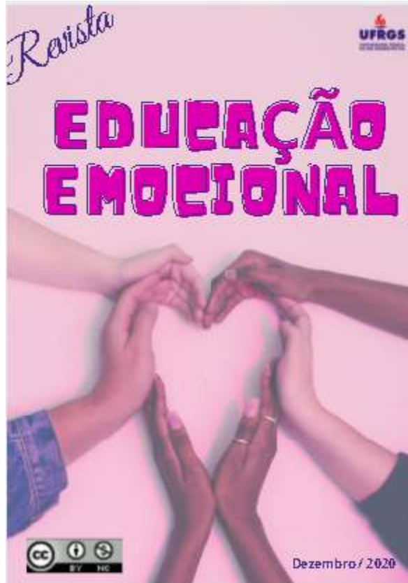
Figura 3: Imagem da capa do REA produzido, exibindo a licença aberta.