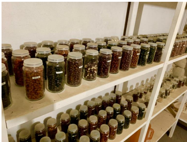
Figura 5 – Banco de Germoplasma de Feijão - DDPA/SEAPDR, Maquiné/RS.

2006 (FEPAGRO 26). Atualmente, no DDPA, há perspectiva de registro de mais um cultivar ainda em 2021 e outro nos próximos dois anos.