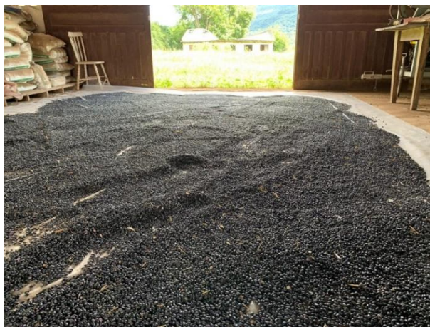
Figura 4 – Secagem do feijão safra 2020/21, DDP/SEAPDR, Maquiné/RS.