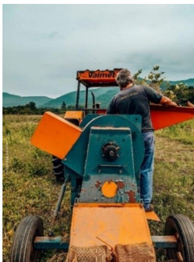
Figura 3 – Trilha do feijão com trilhadora, safra 2020/21, DDPA/SEAPDR, Maquiné/RS.

O feijão era colocado manualmente também na trilhadora, realizando a “trilha” (Figura 3), que consiste na separação dos grãos de feijão dos legumes (vagens), palha e algumas impurezas. A colheita foi escalonada de acordo com o ciclo das cultivares e para que não houvesse mistura dos diferentes materiais genéticos.