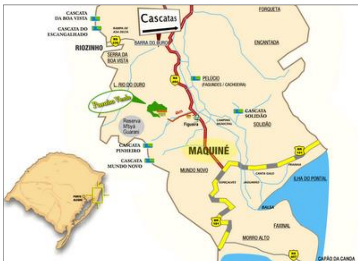
Figura 1 - Localização do Município de Maquiné – Rio Grande do Sul

O município é essencialmente agrícola, com 613km 2 de área e uma população de 6.747 habitantes (IBGE, 2021) e possui três distritos: Barra do Ouro, Morro Alto e Maquiné, sendo o último a parte central e a de maior concentração das atividades de serviços e comércio (Figura 1).