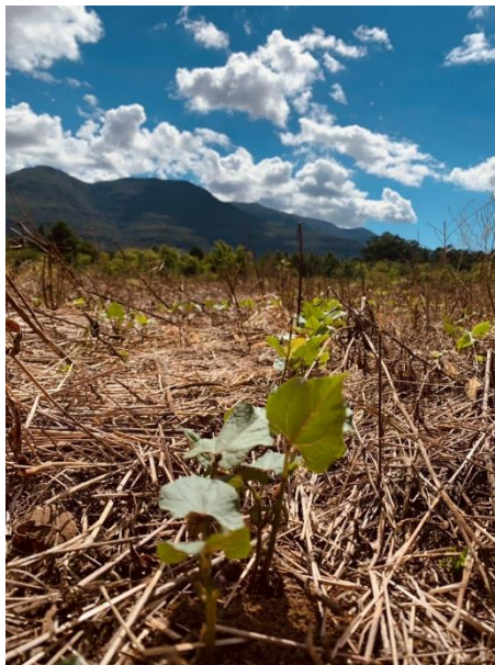
Figura 7 – Emergência do feijoeiro semeado sobre palha de aveia na segunda safra 2020/2021. DDPA/SEAPDR, Maquiné/RS.

É necessário que seja feito o reconhecimento e monitoramento das pragas que realmente causam danos à cultura, a capacidade de recuperação das plantas aos danos causados pelas pragas, o número máximo de indivíduos dessas pragas que podem ser tolerados antes que ocorra dano econômico (nível de controle) e o uso de inseticidas seletivos de forma criteriosa. Esse monitoramento foi realizado periodicamente, sendo um deles representados na figura 7.