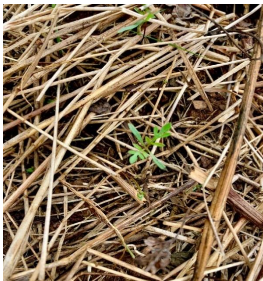
Figura 6 – Momento pré aplicação de herbicida (pós-emergência de picão-preto [ Bidens pilosa L.]) DDP/SEAPDR, Maquiné/RS.

estavam no estágio da 1ª e 3ª folhas trifolioladas, com o solo úmido e a umidade relativa do ar entre 70 e 90%.