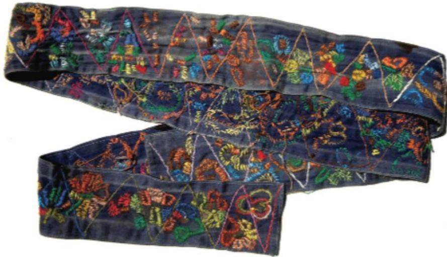
Figura 7: Faixa de contenção bordada. Artista Natália Leite. Medidas: 10 x 200cm.