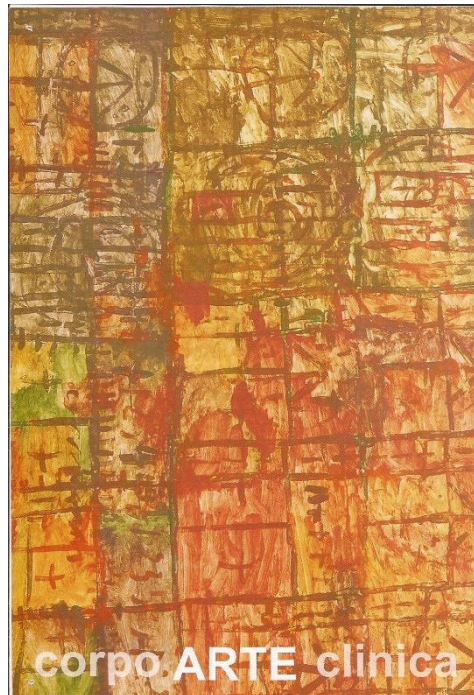
Figura 3: Material de divulgação da exposição de Luiz Guides realizada no MARGS (2003)