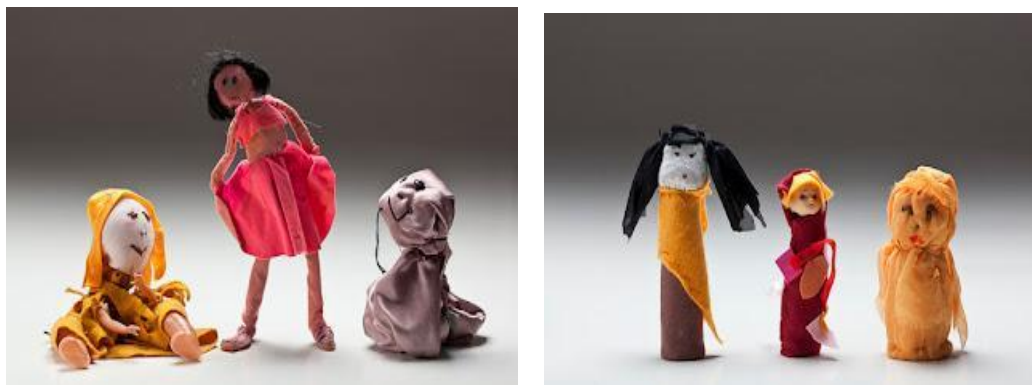
Figura 14: Bonecas. Coleção Diário de uma boneca (1998). Artista Lia Menna Barreto. Acervo da Artista.