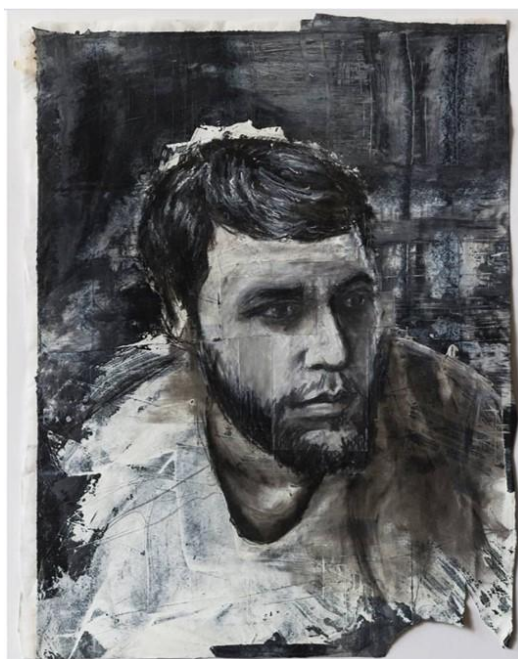
Figura 12: Somos a soma de nossos gestos visíveis (2015). Pintura em pastel seco sobre papéis montados. Artista Marcelo Armesto. Acervo do artista.