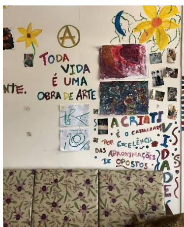
Figura 5: Fotografia de uma das paredes da Oficina de Criatividade do HPSP (2021)

Nessa perspectiva, cabe pontuar que o título – Vertigem / Linguagem – inspira-se no poema “Traduzir-se” de Ferreira Gullar, o qual nos provoca a refletir acerca do nosso desejo em compreender a nossa própria existência, um turbilhão de sentimentos, uma incessante busca por definir-se perante o mundo, perante a sociedade, indicando que estamos sempre no limite entre o que é real e o que não é. A partir das múltiplas representações do nosso eu, de como estamos em constante transformação e como isso reverbera nas poéticas do nosso cotidiano, ressaltamos os últimos versos do poema, como fonte de inspiração para o título: “Uma parte de mim é só vertigem: outra parte, linguagem. Traduzir uma parte na outra parte – que é uma questão de vida ou morte - será arte?” (Fig. 5).