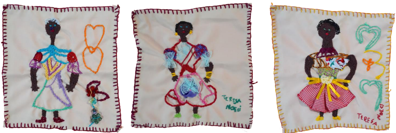
Figura 8: Conjunto de bordados. Artista Teresa Noeci.