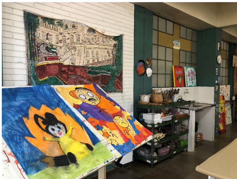
Figura 1: Imagem dos Ateliês da Oficina de Criatividade do HPSP (2021)