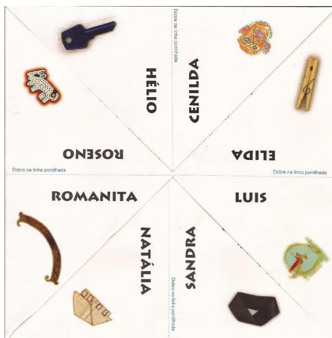
Figura 2: Convite da exposição QuatroXQuatro (1998)