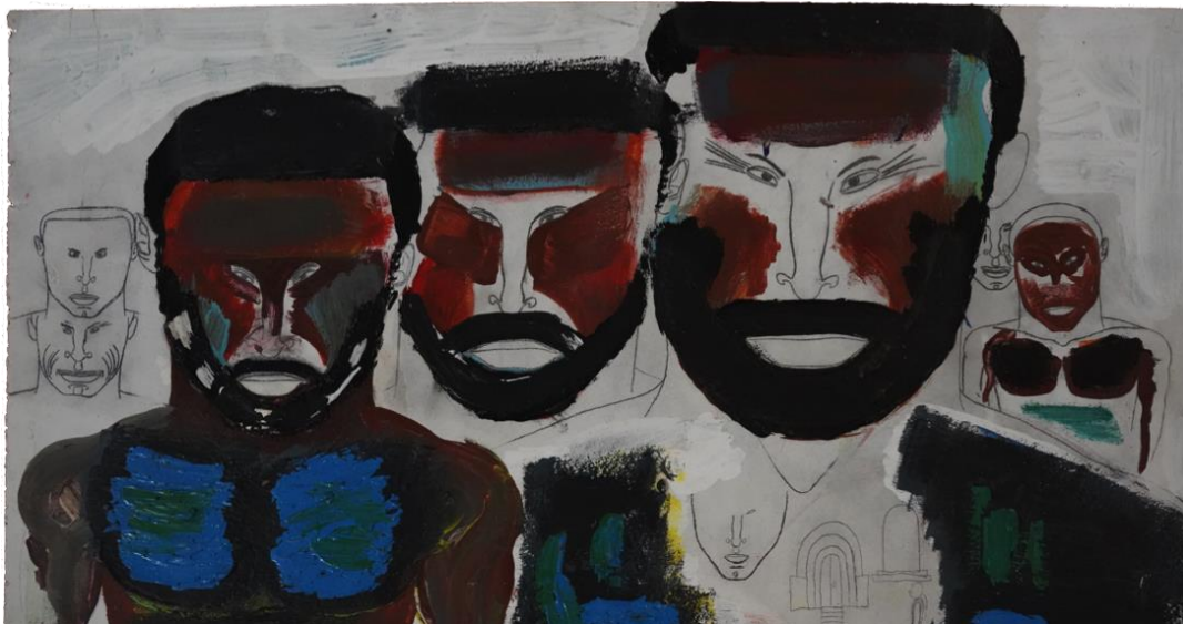
Figura 13: Pintura sem título em suporte de papel. Artista Romeu Figueiró.