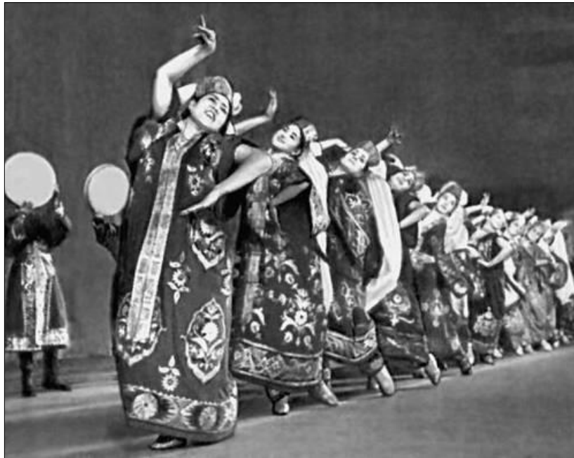
FIGURA 9: DANÇA REALIZADA PELO COLETIVO “ BAKHOR ”, BUKHARA (1967)