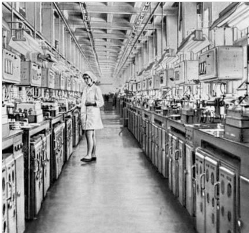
FIGURA 8: OPERÁRIA NA INDÚSTRIA QUÍMICA DE CHIRCHIK (1960)