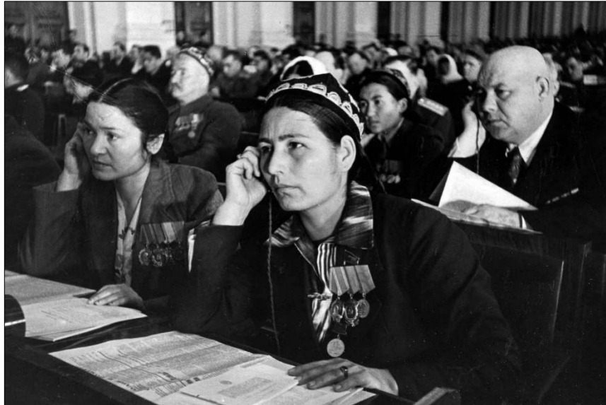
FIGURA 7: DEPUTADAS REPRESENTANDO A REPÚBLICA DO UZBEQUISTÃO EM UMA SESSÃO DO CONSELHO ELEITO (1940)