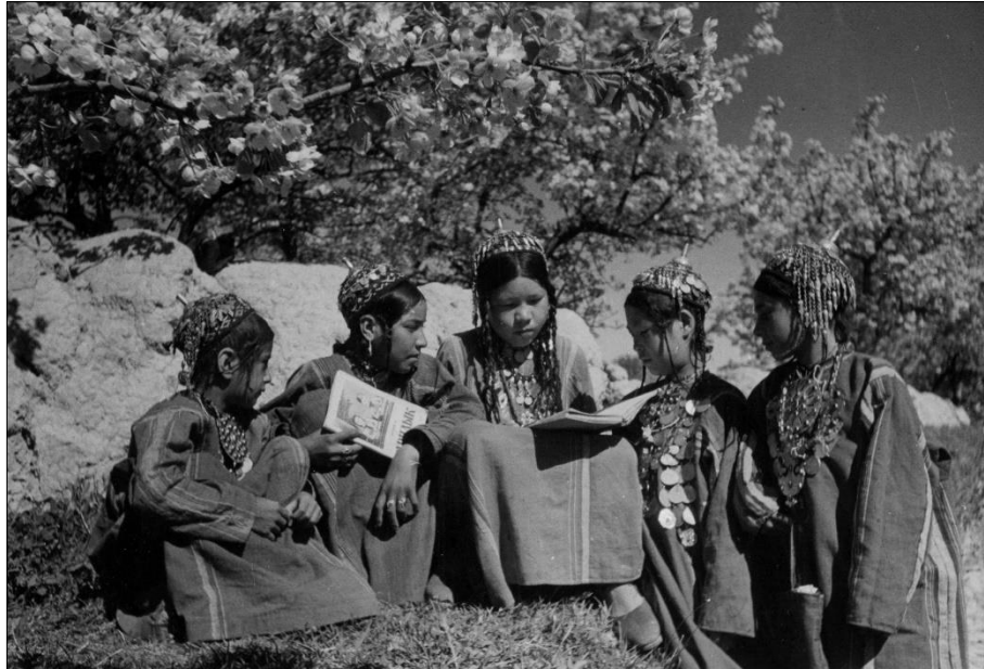
FIGURA 11: CRIANÇAS LENDO EM SAMARKAND (n.d.)