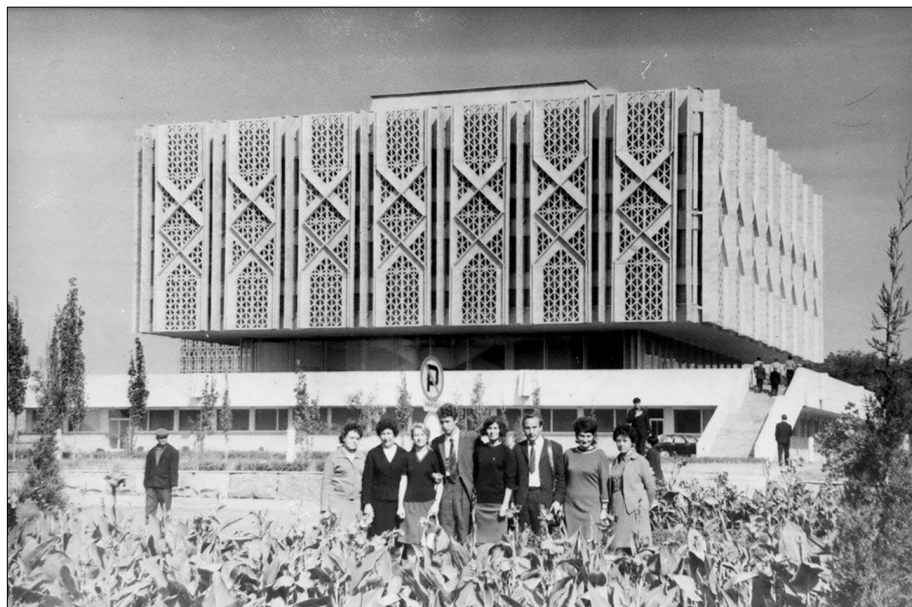
FIGURA 10: EXTERIOR DO MUSEU V. I. LÊNIN, TASHKENT (1970)