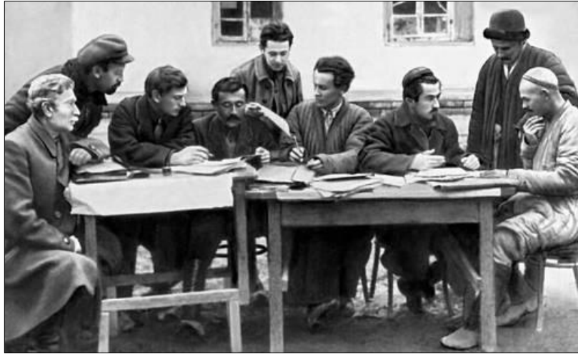
FIGURA 5: COMISSÃO PARA A REFORMA AGRÁRIA E HÍDRICA, TASHKENT (1926)