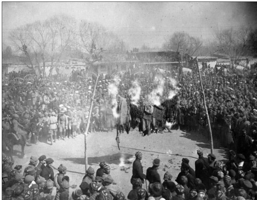
FIGURA 6: MULHERES QUEIMANDO VÉUS DURANTE O HUJUM , ANDIJAN (8 DE MARÇO DE 1927)