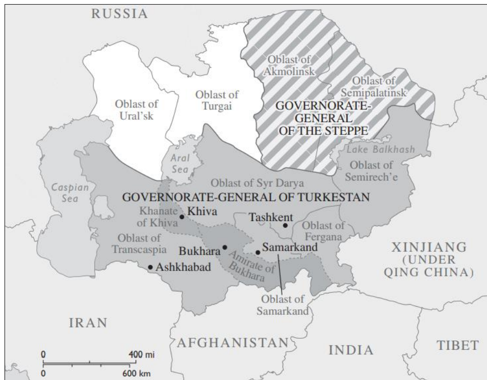
FIGURA 2: MAPA DO TURQUESTÃO RUSSO (1865-1917)