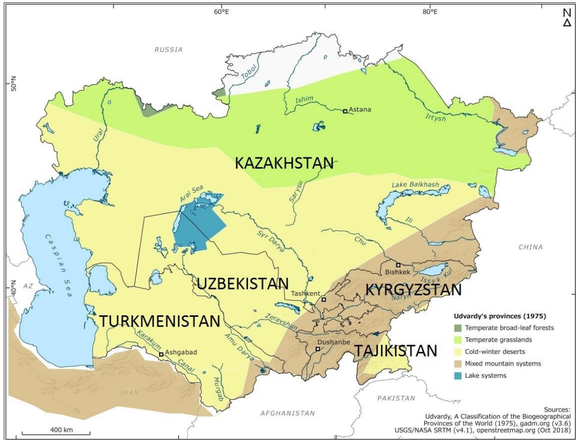
FIGURA 1: MAPA POLÍTICO E FÍSICO DA ÁSIA CENTRAL