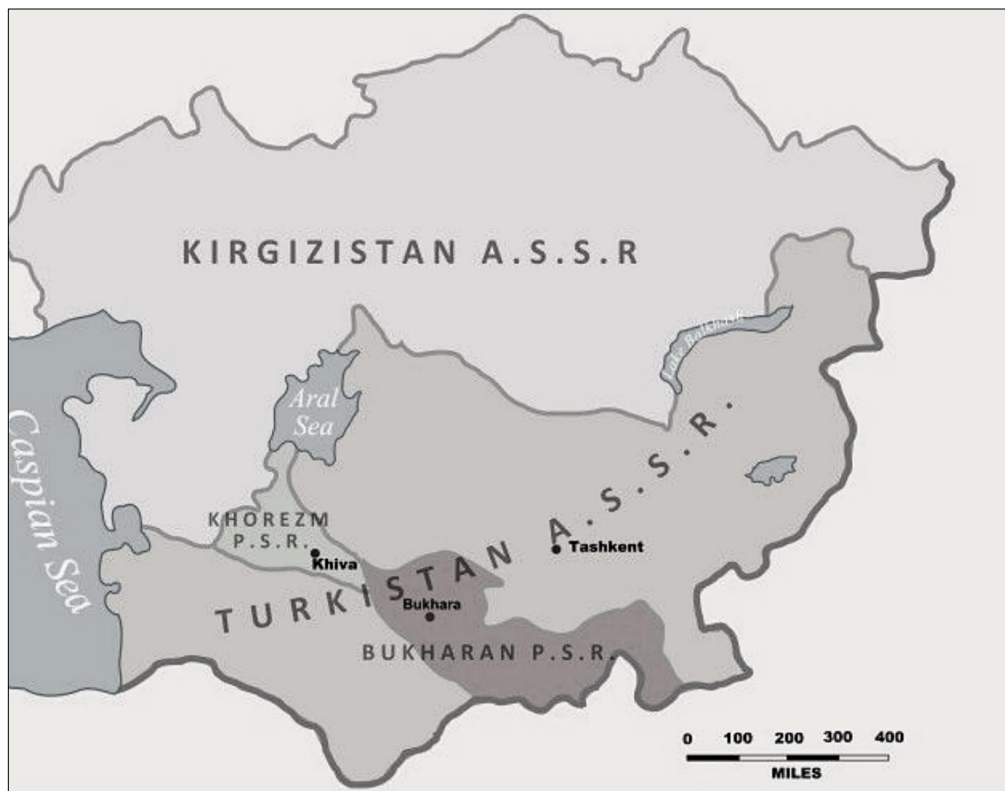
FIGURA 3: MAPA DO TURQUESTÃO REVOLUCIONÁRIO (1920-1924)