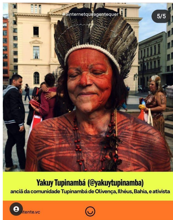
Imagem com fundo branco e texto alternativo em fonte preta dizendo "Empatia seletiva: quem faz parte do nosso "a gente"?. Ainda na imagem de capa, a hashtag "SOSyanomami" na cor laranja. Nas internas, ativistas indígenas para acompanhar e fala acompanhada de foto da ciberativista @yakuytupinamba.