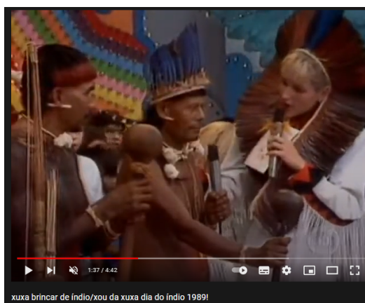
Figura 2 — Vídeo do programa 'Xou da Xuxa' de 1989