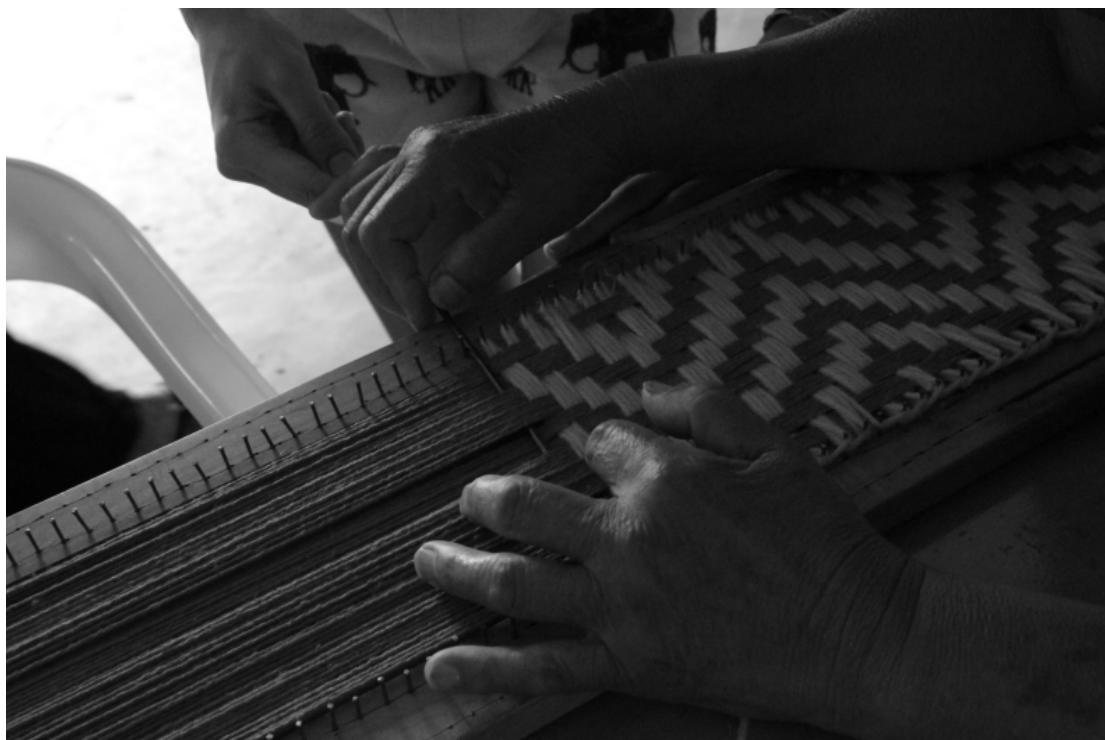
Figura 1 — Grafismo Kaingang

Registro de tecelagem com grafismo tradicional, 2020.