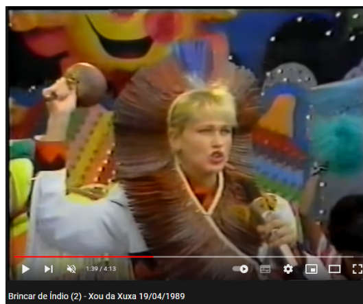
Figura 3 — Vídeo do programa 'Xou da Xuxa' de 1989