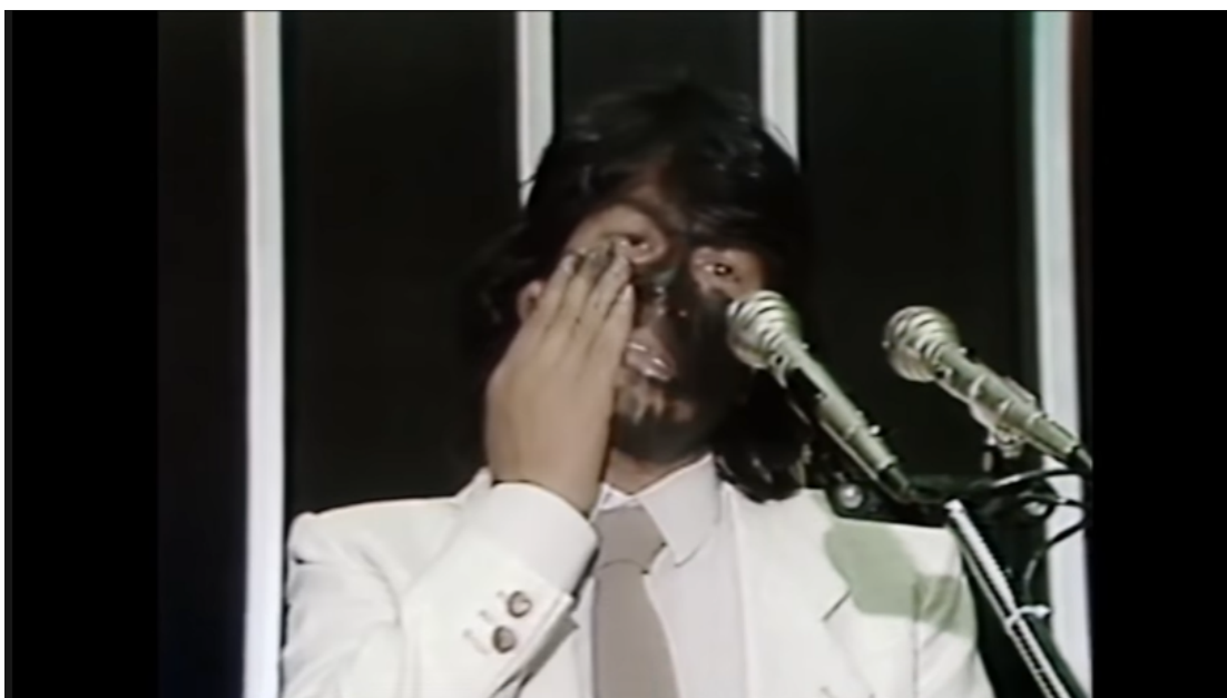
Figura 5 — Vídeo de Ailton Krenak na Assembleia Constituinte de 1987