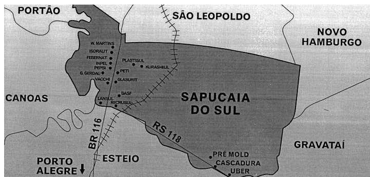
FIGURA 1: Mapa de Sapucaia do Sul

O campus tem por objetivo atender à comunidade sapucaicense e da região do Vale dos Sinos conforme depoimento de seu diretor