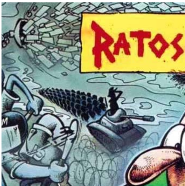
Figura 04 – Referência à canção Retrocesso na ilustração da capa do álbum