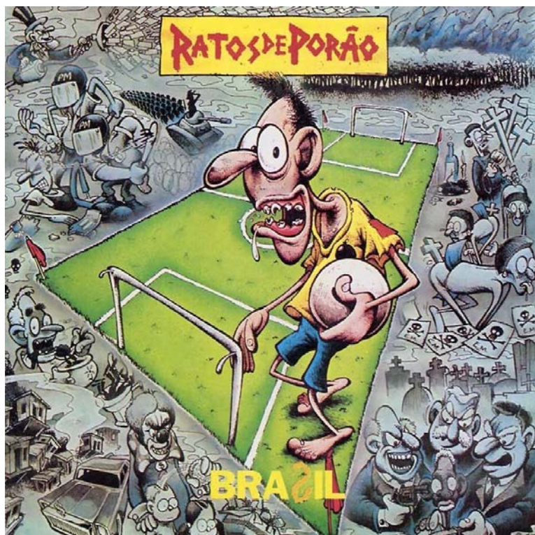
Figura 01 – Capa do álbum Brasil

A icônica capa do álbum (figura 01), desenhada pelo cartunista paulistano Marcatti, é composta por uma série de desenhos, que fazem referência aos temas abordados nas letras do álbum, como pano de fundo. Ao centro, aparece a figura de um campo de futebol, com um homem desdentado e descalço, vestindo bermuda e camiseta que fazem referência ao uniforme da Seleção Brasileira de Futebol. Porém, ao invés do escudo da CBF (Confederação Brasileira de Futebol) na camiseta, aparece o desenho de uma bomba.