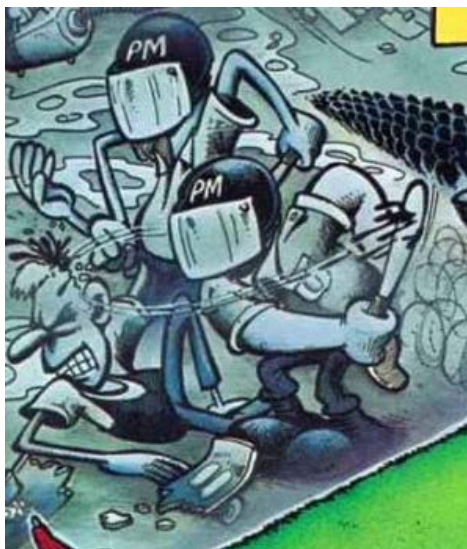
Figura 07 – Referência à canção Porcos sanguinários na ilustração da capa do álbum