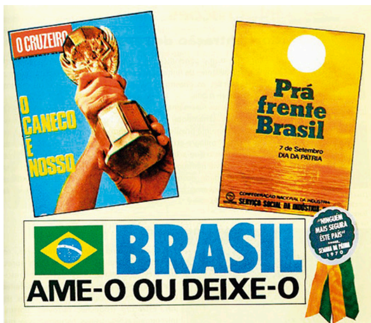
Figura 06 – Exemplos de peças publicitárias ufanistas do governo brasileiro

Uma representação pode se apresentar nos usos e costumes, como também pode estar presente nas conversações das pessoas; ela pode ser recolhida em textos da mídia impressa (jornais, revistas etc.), como pode estar presente nas imagens de cenas televisivas (novelas, filmes), mesmo em danças, passeatas e marchas (romarias) de manifestações populares. E, é claro, ela pode ser costurada nas mentes das pessoas, em suas opiniões, atitudes, crenças, símbolos (GUARESCHI, 2001, p.254).