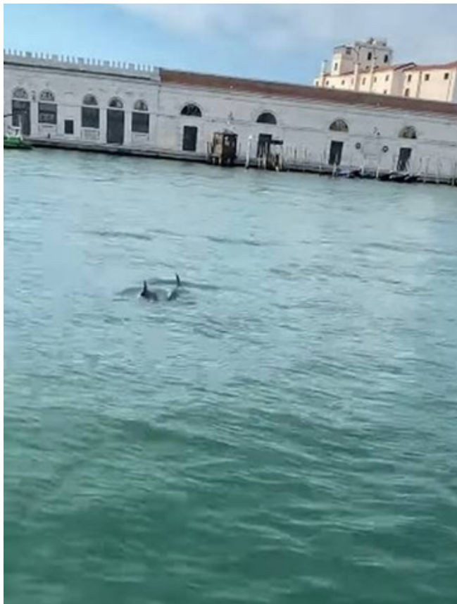
Figura 1 – Golfinhos nos canais de Veneza durante o lockdown.