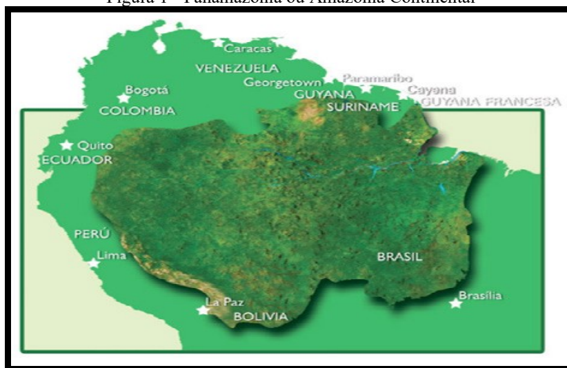
Figura 1 - Panamazônia ou Amazônia Continental