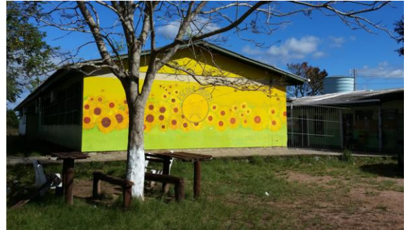
Fotografia 9 – Escola cercada após as brigas