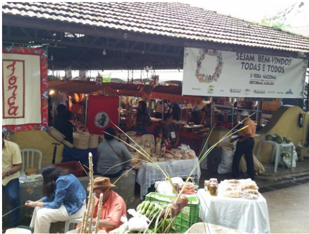
Fotografia 1 - 2ª Feira Nacional da Reforma Agrária