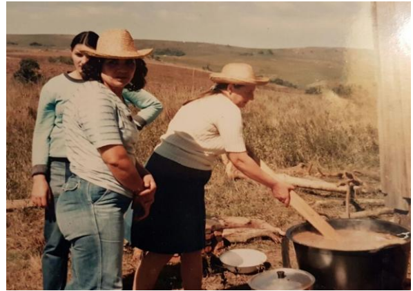
Fotografia 4 - Refeitório da Escola, ano de 89