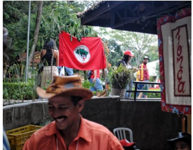
Fotografia 2 - Bastidores da feira