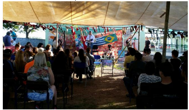
Fotografia 7 – Sarau Somos mucho mas que dos Lona montada para receber a comunidade