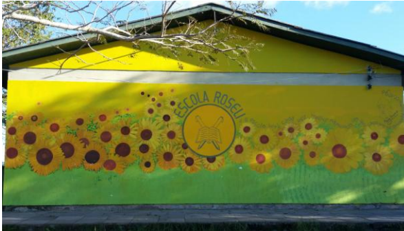
Fotografia 8– Fachada da escola