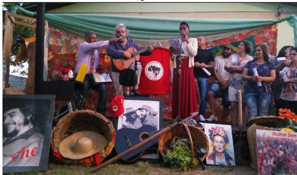
Fotografia 6 – Sarau Somos mucho mas que dos Intervenção artística