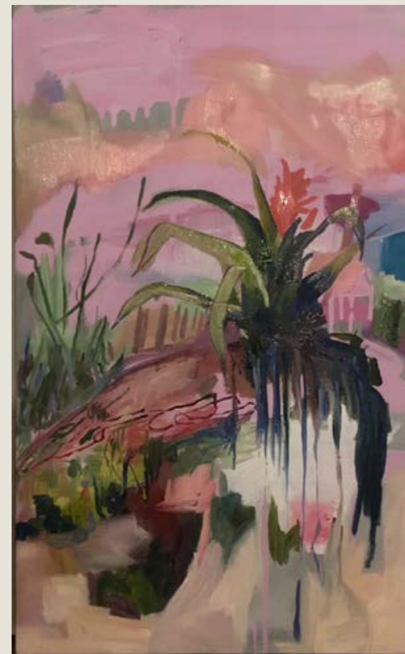
figura 17. bromélia I , tinta óleo sobre tela, 80x50cm, 2021. *imagem temporária

Muitas vezes o próprio desenho da rua me leva a retrabalhá-lo em atelier por ter, ao desenhá-lo, desejado uma série de soluções que não poderiam ser trabalhadas na hora. Aqui, não é o caso da relação tradicional hierárquica entre desenho e pintura, onde o primeiro está subordinado ao estudo do segundo. Mesmo que exista essa relação de causalidade entre os trabalhos de dentro e os de fora, não considero os primeiros preparatórios e