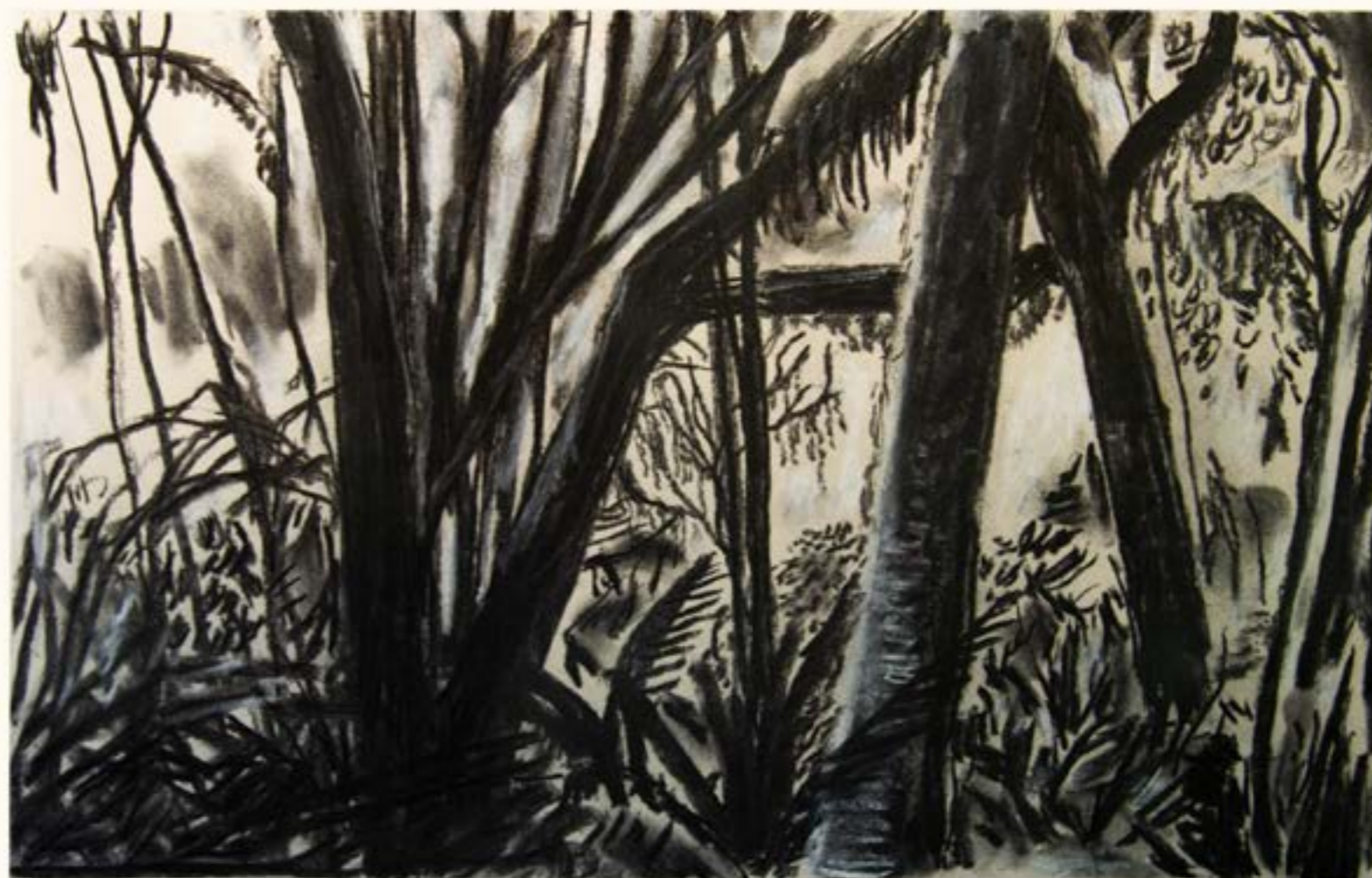
figura 32. vista para o mato VII , carvão sobre papel, 34x50cm, 2021.