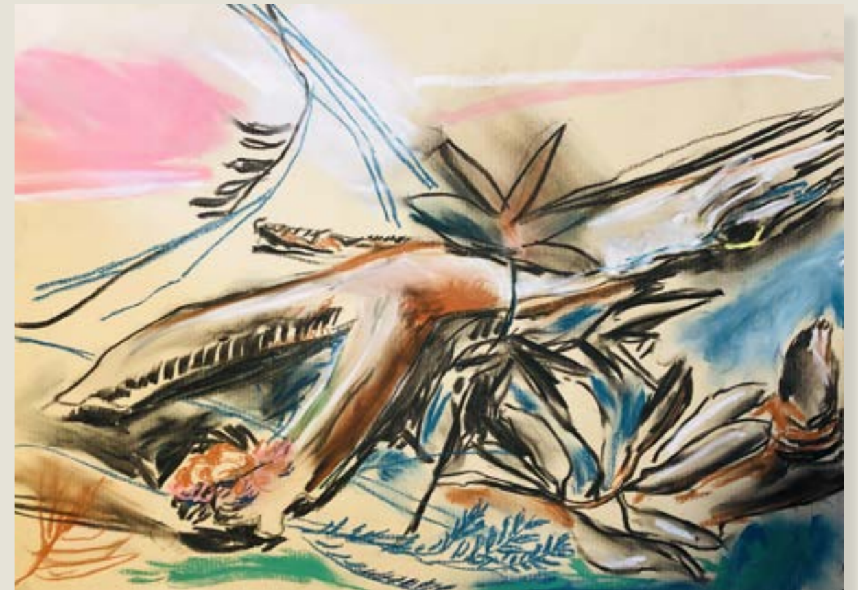
figura 11. tronco podre I , pastel seco sobre papel, 30x42cm, 2021.

Em busca dessa “semente”, aproveito os dias ensolarados para sair e ver o que vive à minha volta. Dou uma breve caminhada nos fundos da casa atrás de alguma ideia compositiva que chame meu olhar. Os critérios são bastante subjetivos, busco um ponto de interesse que a própria causalidade da floresta trate de me oferecer. Raramente movo as coisas de lugar por simplesmente não sentir a necessidade de forçar um arranjo diante de tantas opções.