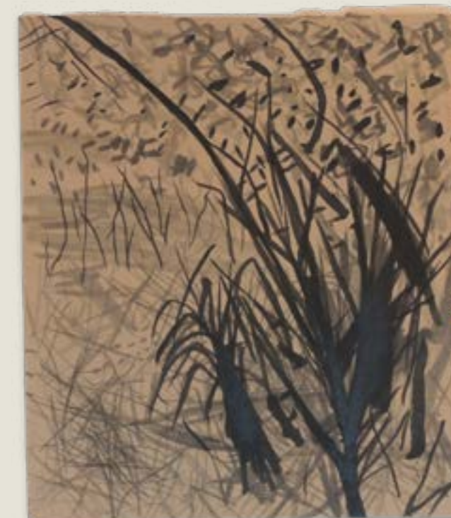
figura 6. desenhos em papelão, nanquim e grafite sobre papelão, 34x50cm, 2017.