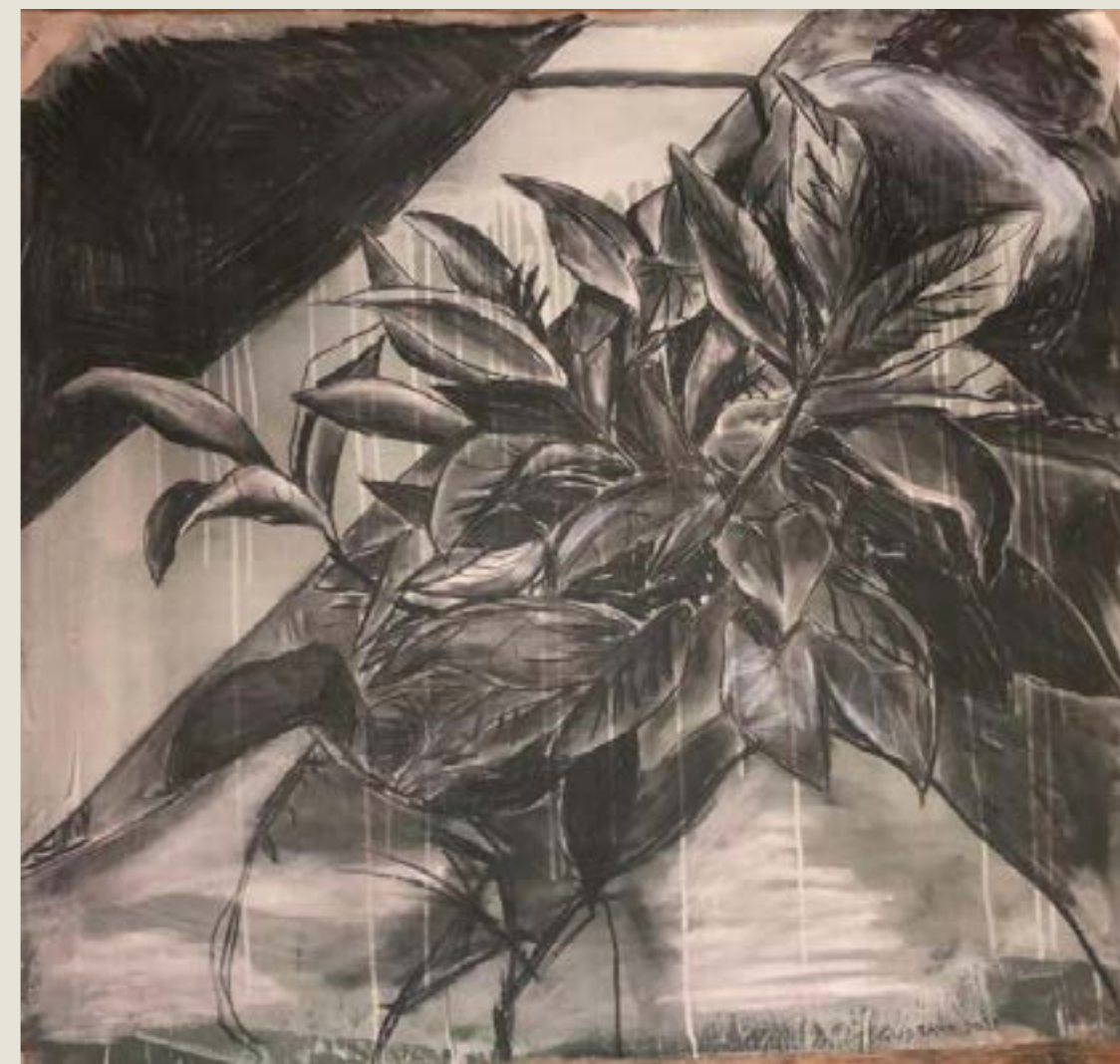
figura 20. arbusto , carvão e tinta acrílica sobre tela, 100x100 cm, 2021.