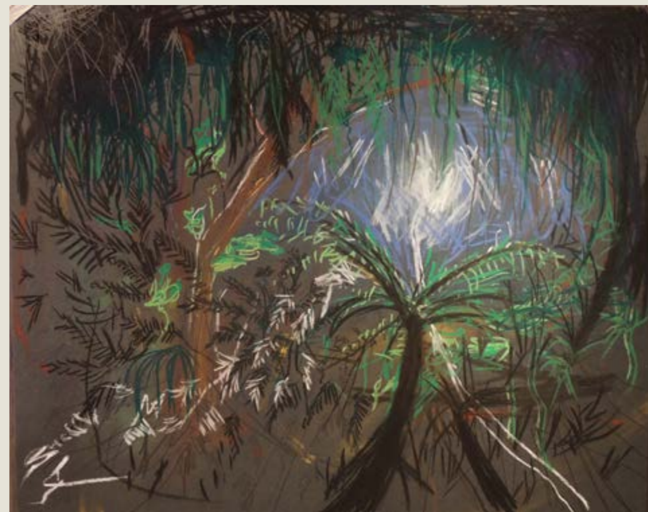
figura 4. xaxim III , carvão, pastel seco e grafite sobre papel, 80x100 cm, 2017.

A relação de cortar, carregar e guardar madeira me envolve durante horas. No inverno é desesperada, por ser muito frio, e no verão é prudente, pois as lenhas estão mais secas para o armazenamento. Assim, todo esforço é cíclico e precisa ser repetido: abro uma trilha e ela se fecha. Me sinto lidando com a floresta pantanosa que esconde Macondo, em que os viajantes cortavam o mato para passar e ele instantaneamente crescia de volta, sem deixar possibilidade de retorno. Eu entendo melhor o que é o mágico do realismo de García Márquez aqui, pois para meus olhos acostumados à pedra e ao campo, presenciar este exagero de vida é nada menos que mágico.