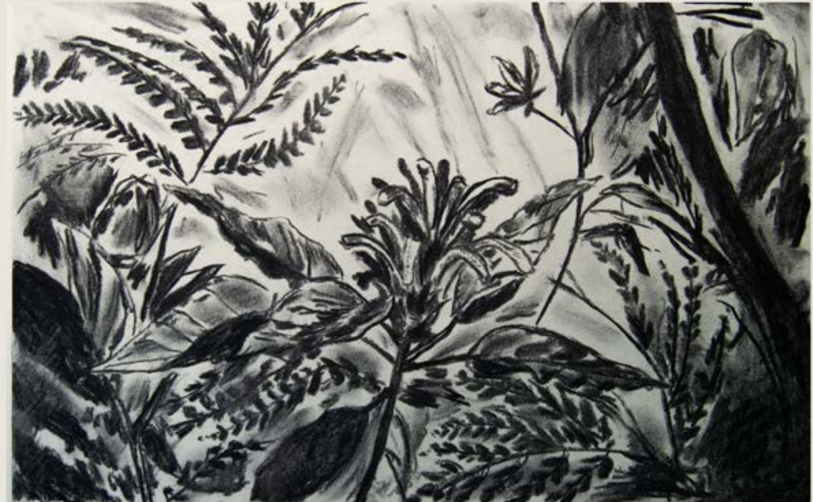
figura 7. flor do mato , carvão sobre papel, 34x50cm, 2021.

"<<paisaje>> para poder aplicar con precisión ese nombre, es necesario que exista un ojo que contemple el conjunto y que se genere un sentimiento, que lo interprete emocionalmente." [MADERUELO, 2005, pág. 38].