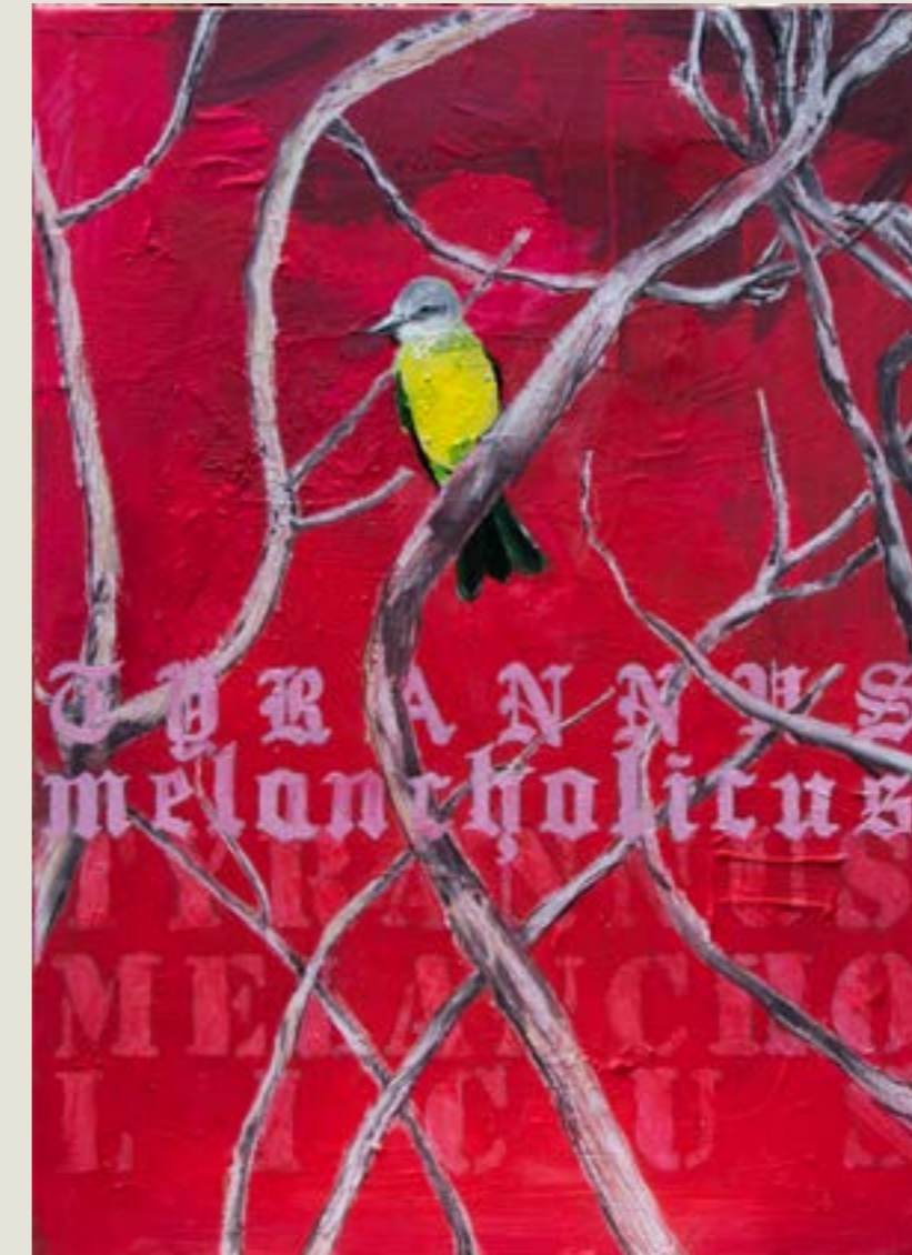
figura 30. tyrannus melancholicus , tinta acrílica, carvão e giz sobre tela, 50x70 cm, 2021.

Não me agradam os trabalhos “sem título” pois estes nos obrigam aos títulos alternativos, geralmente também descritivos, pois a linguagem depende de títulos para resumir a informação. Já me argumentaram que a não definição da nomenclatura abre espaço para uma interação entre observador e obra, pois este tem espaço para intitular a imagem por si.