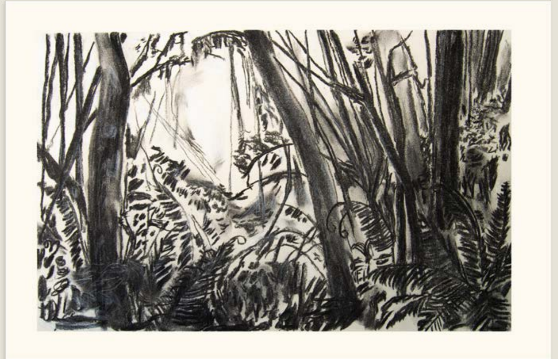
figura 1. vista para o mato III , carvão sobre papel, 34x50cm, 2021.