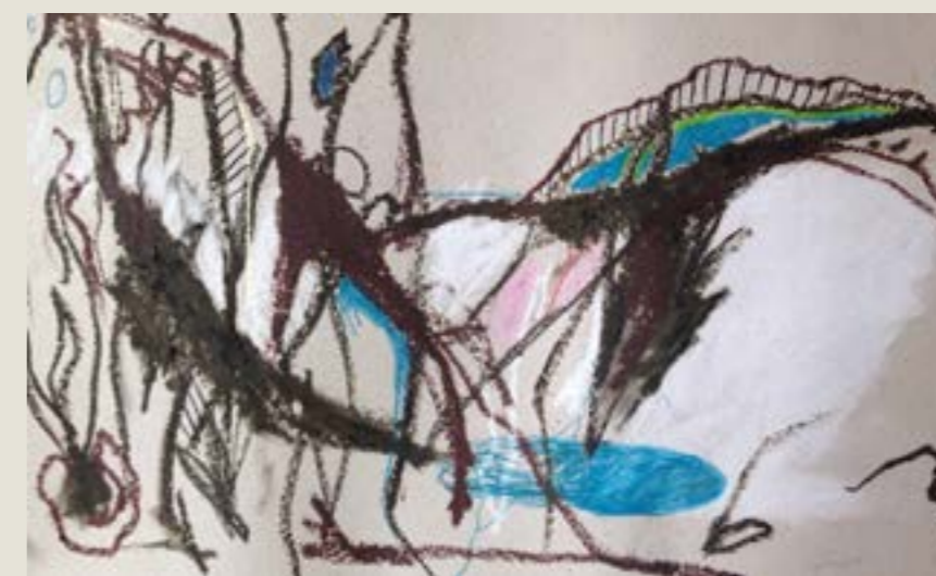
figura 24. sem título, nanquim, tinta acrílica, giz e pastel oleoso sobre papel, 50x80 cm, 2021.