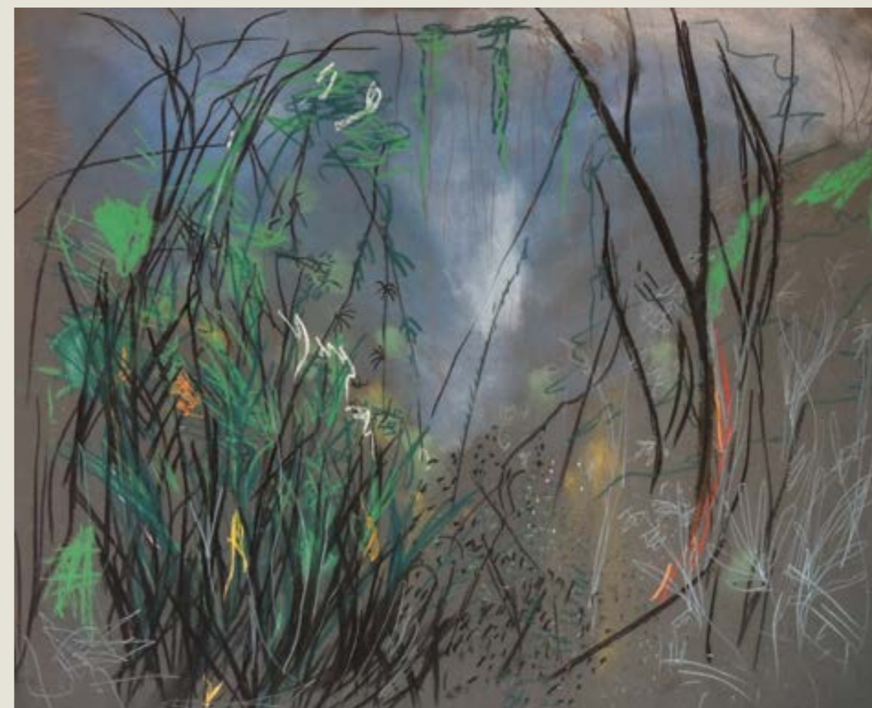
figura 3. xaxim II , carvão, pastel seco e grafite sobre papel, 80x100 cm, 2017.

A mata é escura, molhada e repleta de insetos coloridos, o pouco sol que entra é rapidamente capitaneado por árvores e xaxins que aparentam estar em eterna competição. A mata sufoca a casa com ondas de samambaias que se proliferam como coelhos e precisam ser afastadas com a enxada constantemente, para proteger o pouco espaço de convivência que nos