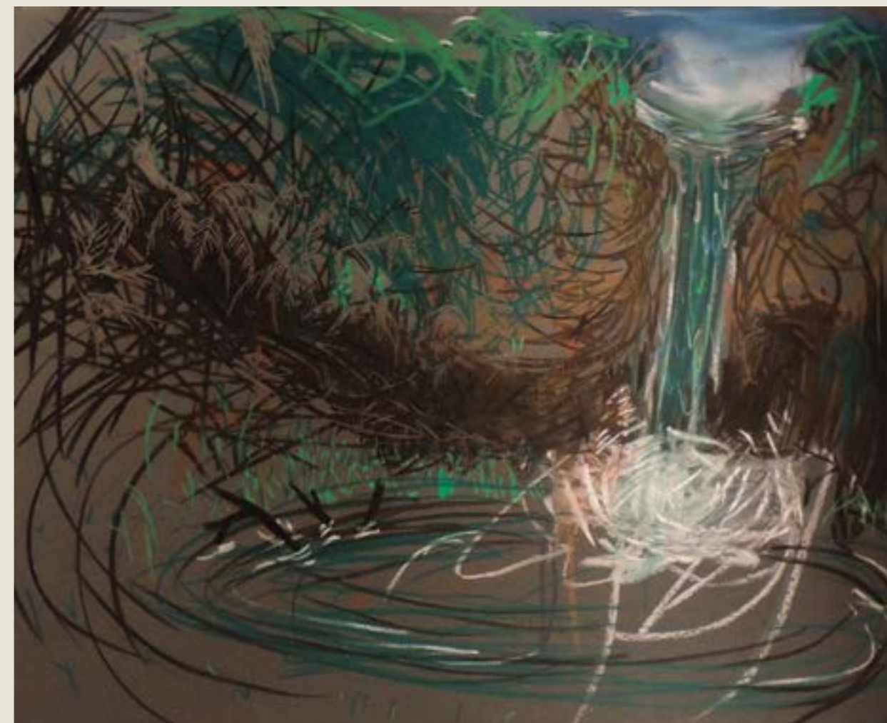
figura 5. xaxim IV , carvão, pastel seco e grafite sobre papel, , 2017.

A casa já havia influenciado minha produção artística na época em que estava em construção. Vinha nos finais de semana e me deslumbrava com a presença intensa do mato e, com isso, alimentava a vontade de compreendê-lo. Como estava no início de minha graduação, não poupei tempo tentando representá-lo. O desenho tornou-se uma ferramenta estendida de minha percepção, ou pelo menos me dava um certo senso de decodificação do espaço e me familiarizava com o novo. Digo isso no sentido de que minha intenção, mesmo que irracional, passava pelo senso de que a planificação daquele espaço desconhecido auxiliaria em organizá-lo, desvendá-lo e até domesticá-lo. Intuitivamente, seguia aquela ideia de que o desenho é uma espécie de mapa, uma manifestação de meu pensamento diagramático, que organiza e diferencia as informações do mundo. Como desenhar não é um ato de cópia passivo, o ambiente moldou minha linha. O exagero da mata deixou um lastro irremediável em toda minha produção artística, não tenho paciência para contar folhas: por isso as rabisco de forma desordenada — desordem chave para entender pelo menos um pouco do que se passa no emaranhado vegetal.