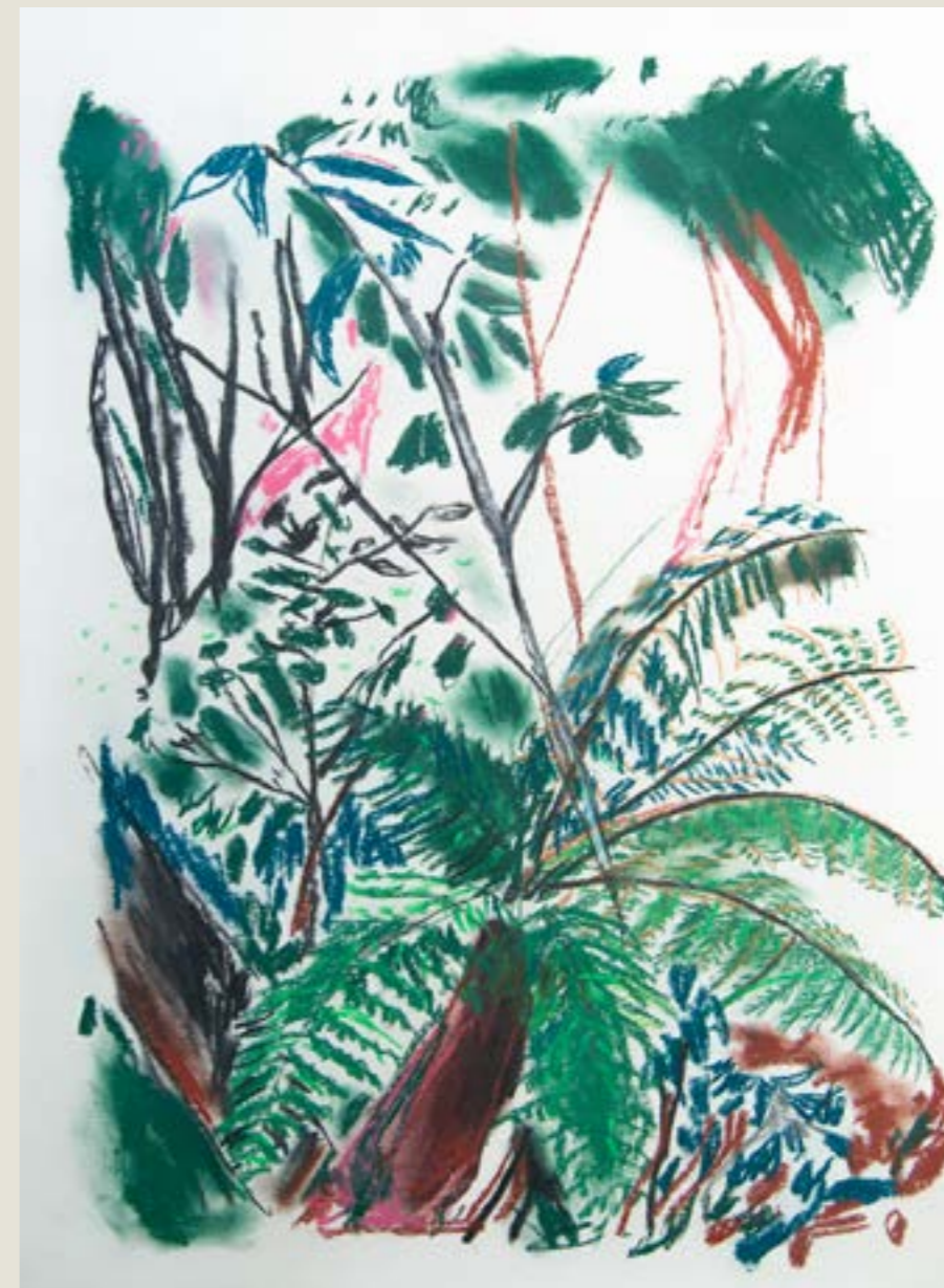
figura 13. vista para o mato V , pastel seco sobre papel, 36x50cm, 2021.

O pintor, precisando se distanciar do motivo, não é atraído pelas figuras separadamente, mas pelas relações entre as partes que traduzem a sensação desejada. A visão do todo se impõe assim, em detrimento dos detalhes, tornando dispensável a forma de uma folha mas imprescindível a textura que permite a ideia de conjunto dos diferentes arbustos e plantas. A noção de espaço unitário e amplo, limitado segundo a determinação do olhar do pintor, faz com que esse olhar ganhe autonomia, passando a recortar o real segundo seus próprios critérios. [POESTER, 2003, pág. 8]