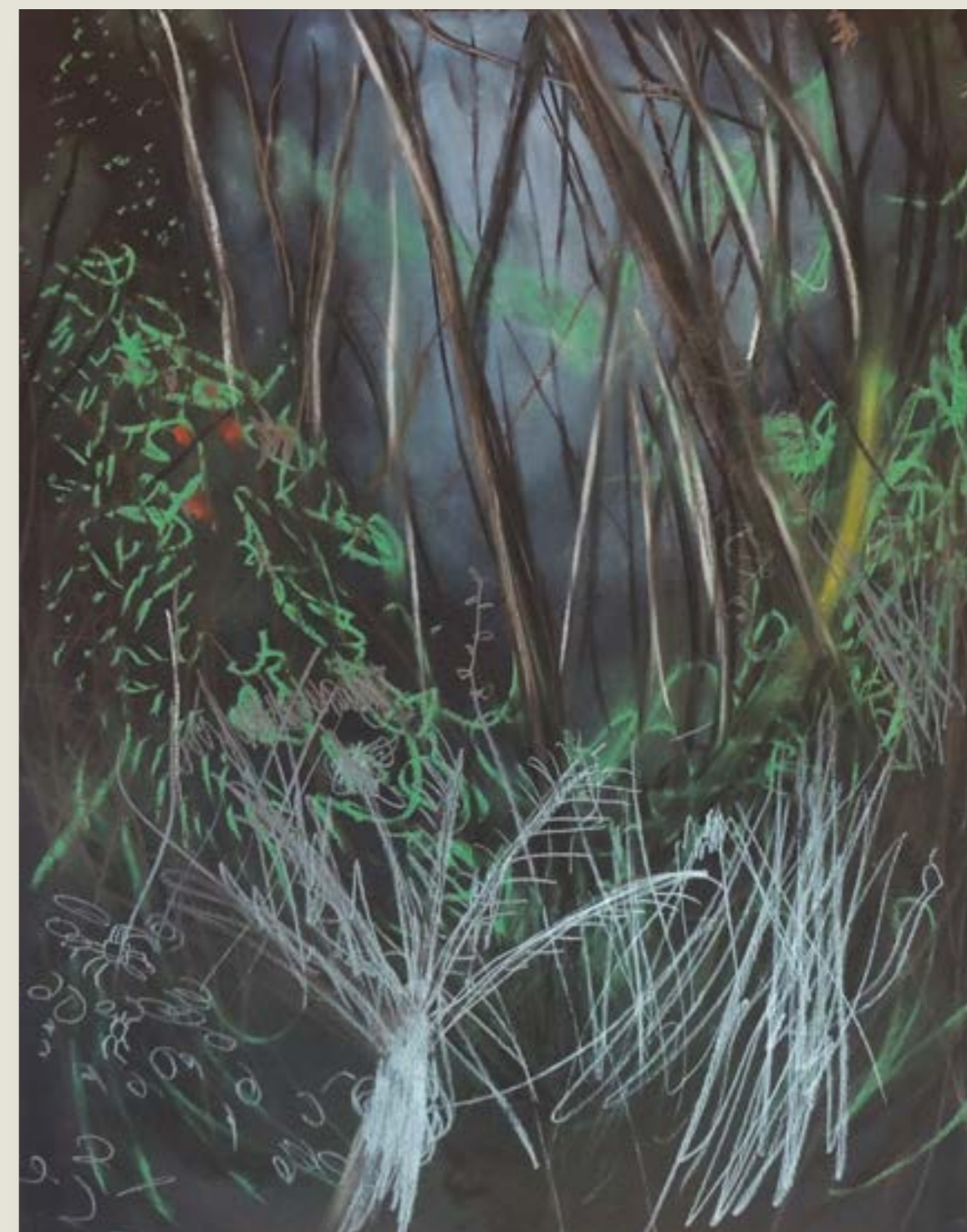
figura 2. xaxim I , carvão, pastel seco e grafite sobre papel, 65x50cm, 2021.

A cabana é nova, a estrutura é de maçaranduba — madeira dura e pesada, “de-lei” — as paredes são de ciprestes fatiados, que dão um perfume de orvalho característico, enquanto os detalhes internos são tiras finas não tratadas de pinheiro comum. A casa foi desenhada e construída pessoalmente pelo seu Ervino, carpinteiro, enxadrista e missionário batista, de manuseio rústico e soluções criativas (para não dizer gambiarras). Sua mão e engenhosidade o presentificam em toda a casa — gosto de achar