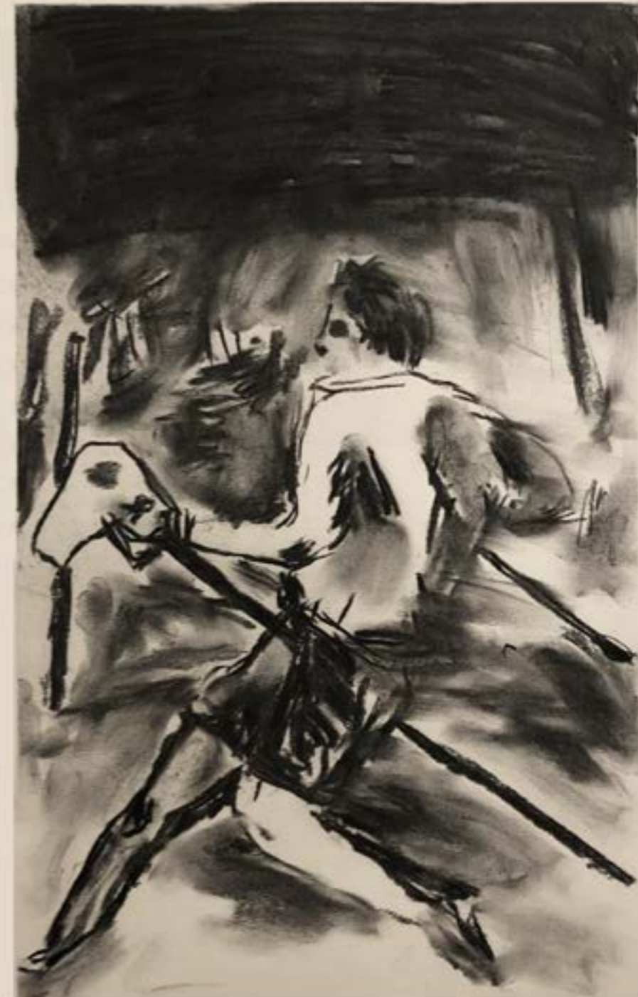
figura 27. frame da vitória , carvão sobre papel, 130x95 cm, 2021.

“O tema deste artigo é um cavalinho de pau bastante comum. Não é metafórico nem puramente imaginário, pelo menos não mais do que o cabo de vassoura (...). Geralmente se contenta em ocupar seu lugar no canto do quarto da criança e não nutre ambições estéticas (...). Como devemos referir-nos a ele? Devemos descrevê-lo “a imagem de um cavalo”? (...) O retrato de um cavalo? (...) Um substituto para um cavalo?” [GOMBRICH, 1999, pg.1]