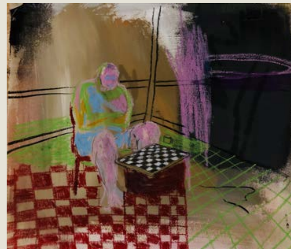
figura 19. xadrez na varanda , tinta acrílica, pastel oleoso e carvão, 60x50cm, 2021.

Meu método de preparo de telas é simples e bastante intuitivo, costumo empilhar áreas de cores através de critérios frouxos, como as tintas que estão disponíveis, meu humor, alguma relação cromática ou referências imagéticas que tive durante o dia. Muitas vezes simplesmente repito ou referencio alguma operação presente em um trabalho anterior. Enquanto cubro o tecido com estas primeiras camadas começo a desenvolver uma relação de criação-resolução de problemas que dura praticamente todo o processo. O problema a que me refiro aqui pode ser definido como tudo aquilo que me causa incômodo, como uma mancha deslocada, algum excesso de riscos, uma composição torta, desbalanceada, alguma cor que destoe negativamente... Enfim, é um critério bastante subjetivo que passa pelo crivo do que me é interessante e o que não me é. Em resumo, o que dialoga com minha forma de trabalhar e com meu insight inicial. A partir destes problemas, proponho soluções como: equilibrar a composição cobrindo ou riscando outras partes da tela, trazer novas cores ou atenuar aquelas presentes.