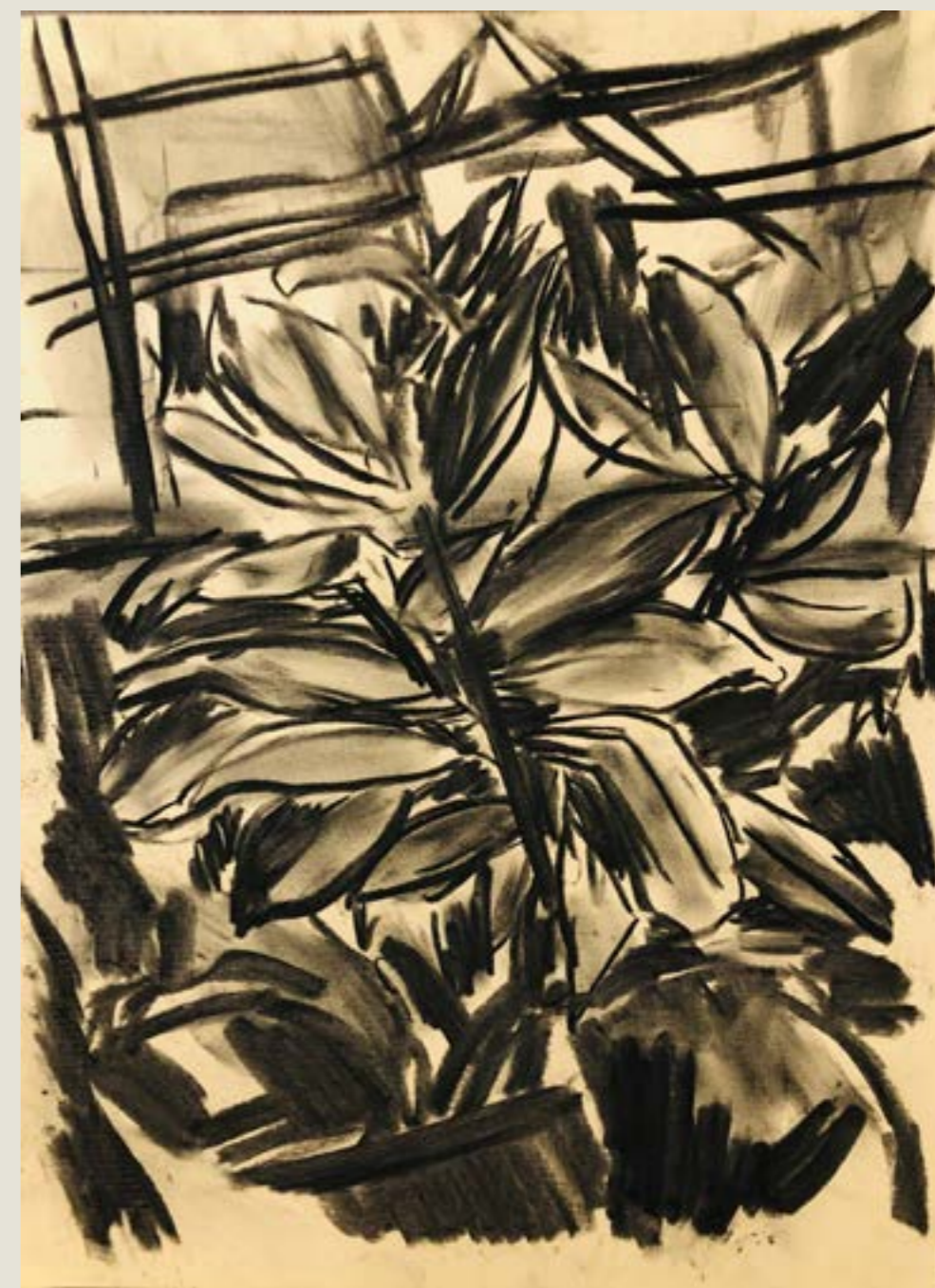
figura 14. 50 centímetros , carvão sobre papel, 30x42 cm, 2021.