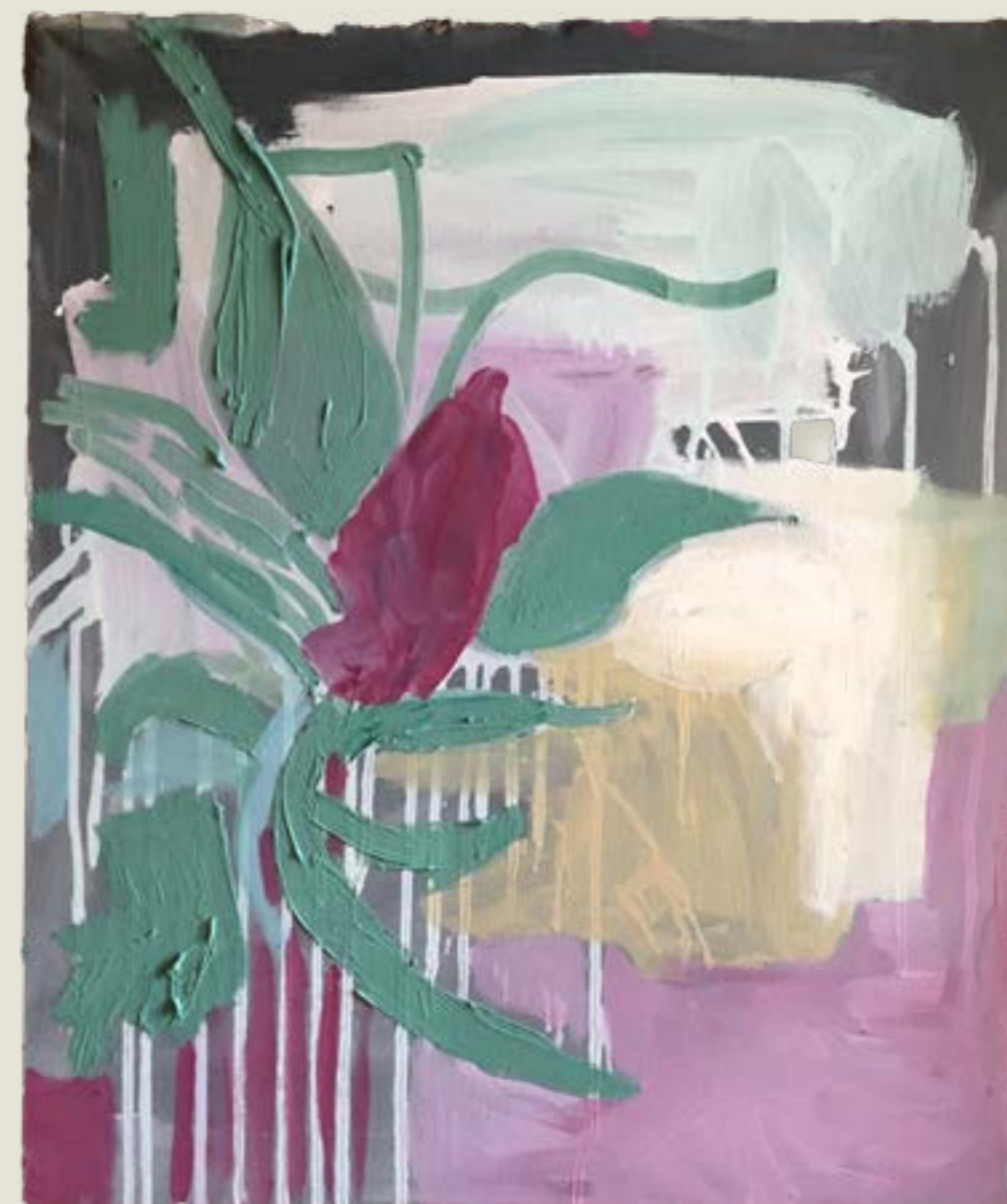
figura 18. bromélia II , tinta acrílica sobre tela, 60x50cm, 2021.

De forma geral, os trabalhos feitos em ateliê são compostos por uma heterogeneidade de materiais, em sua maioria tradicionais ao desenho e a pintura e, como suporte, costumo utilizar o tecido de algodão cru, preparado com algumas camadas de tinta acrílica de parede. A escolha do tecido é bastante pragmática, guiada por quesitos como custo, tamanho, qualidade, praticidade no transporte, aquisição e depósito. O algodão cru, impermeabilizado com várias camadas de tinta de parede com gesso, faz uma tela muito acessível, porque, na falta de um comércio especializado em