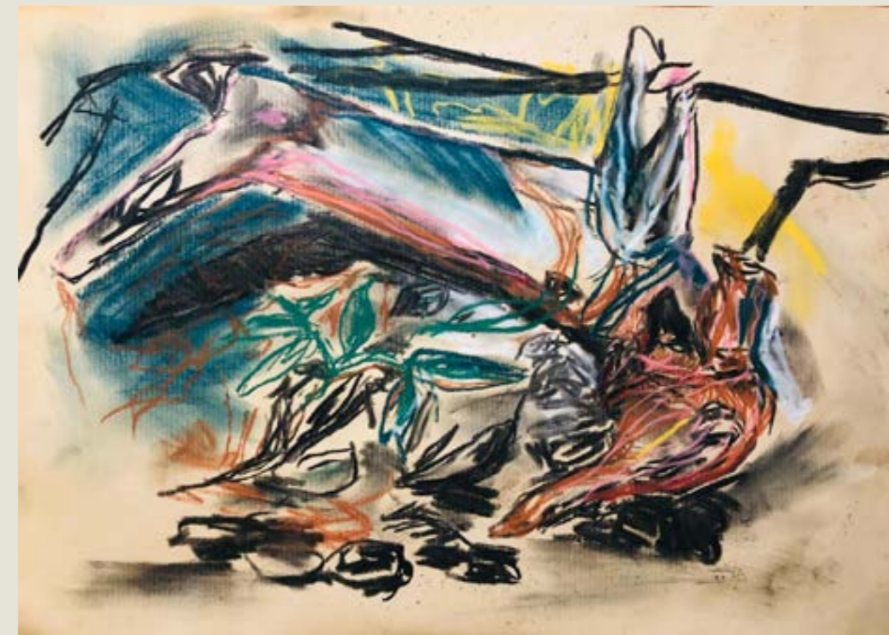
figura 12. tronco podre II , pastel seco sobre papel, 30x42cm, 2021.

Ao observarmos as obras de Turner, Monet, Cézanne, Kandinsky, Mondrian e Klee, entre outros, vemos um caminho que, partindo da contemplação da natureza como fonte de criação, perde gradualmente suas referências realistas. (POESTER, 2003, pág. 3)