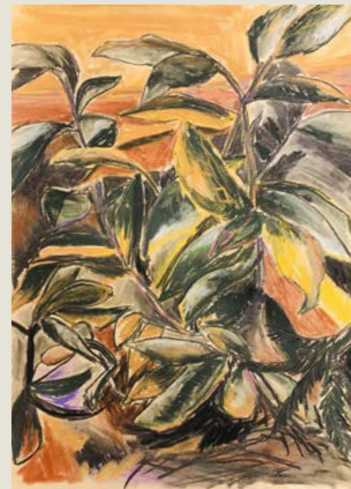
figura 9. vista do mato I , pastel seco sobre papel, 30x42cm ,2021.

Curiosamente, perceber que meu espaço é fragmentado leva estes desenhos a se aproximarem do estudo botânico. Ainda que entenda que o estudo botânico, como modo de representação da natureza, seja diametralmente oposto à paisagem, por individualizar e descontextualizar o elemento representado.