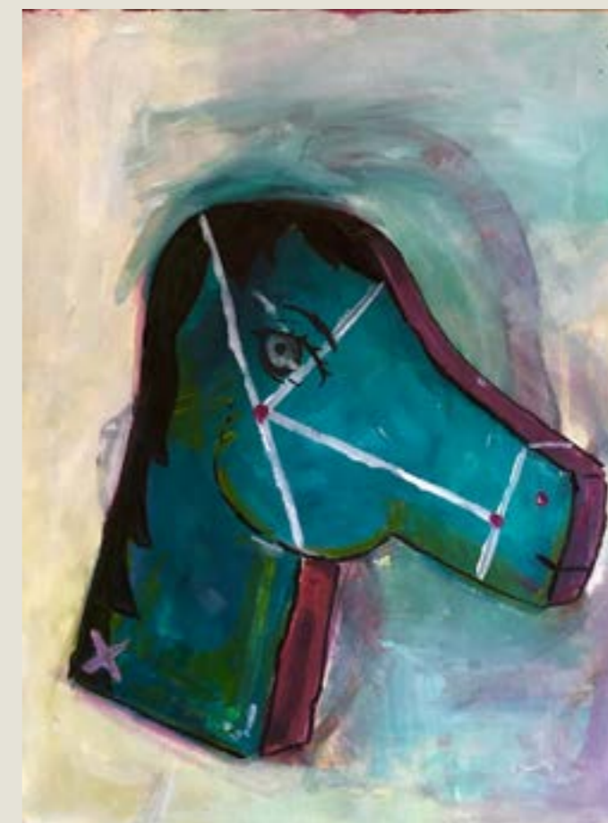
figura 31. equos ferus , tinta acrílica sobre tela, 40x30 cm, 2021.

A imagem de um passarinho me propôs um aprofundamento deste título meramente descritivo ao agregar uma informação nova através da apresentação de seu nome científico. Tyrannus melancholicus é o nome “latino” de um pequeno pássaro, comum aqui da floresta: o suiriri. A ave leve e amarela, que migra do hemisfério norte ao sul, carrega consigo uma nomenclatura pesada — o tirano melancólico. O contraste imediatamente chamou minha atenção, é curioso (e triste!) que um passarinho carregue um nome tão pesado (fig. 30). Descobrir que seu nome é uma lembrança à tirania é como perder a inocência, uma vez que se sabe, é impossível vê-lo de outra forma. Pensar que um ser tão precioso vá sempre nos lembrar do nefasto graças à linguagem científica é uma cicatriz mental que carregaremos, mas talvez esse seja o duro remédio que devemos engolir para que não sejamos distraídos com o belo.