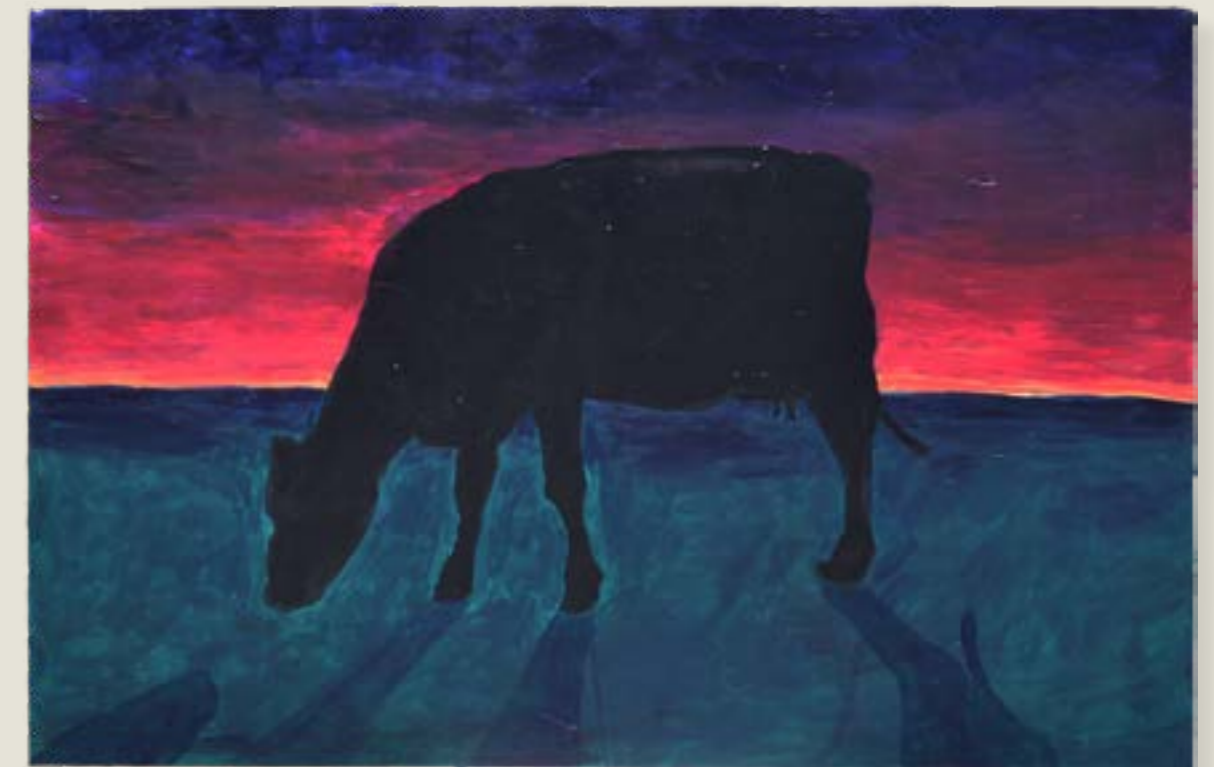
figura 29. gado , tinta acrílica sobre tela, 60x90 cm, 2021.

O que estava dizendo é que não é a primeira vez que a temática do campo invade o que até então era “só mata”. As cenas do cavalinho foram um gatilho inicial e abriram a porta para diversas recordações relacionadas aos tais cavalos. Eles eram os protagonistas do recreio em minha escola, havia aproximadamente 6 cavalos para 20 meninos e dividir não era uma opção. A disputa pelo símbolo da masculinidade era acirrada e apenas aqueles que mais dialogavam com este discurso (através da violência) teriam a garantia exclusiva do brinqueado no intervalo. Dominar um cavalo-de-pau era pertencer a um seletto grupo e gozar de privilégios já presentes na primeira socialização.