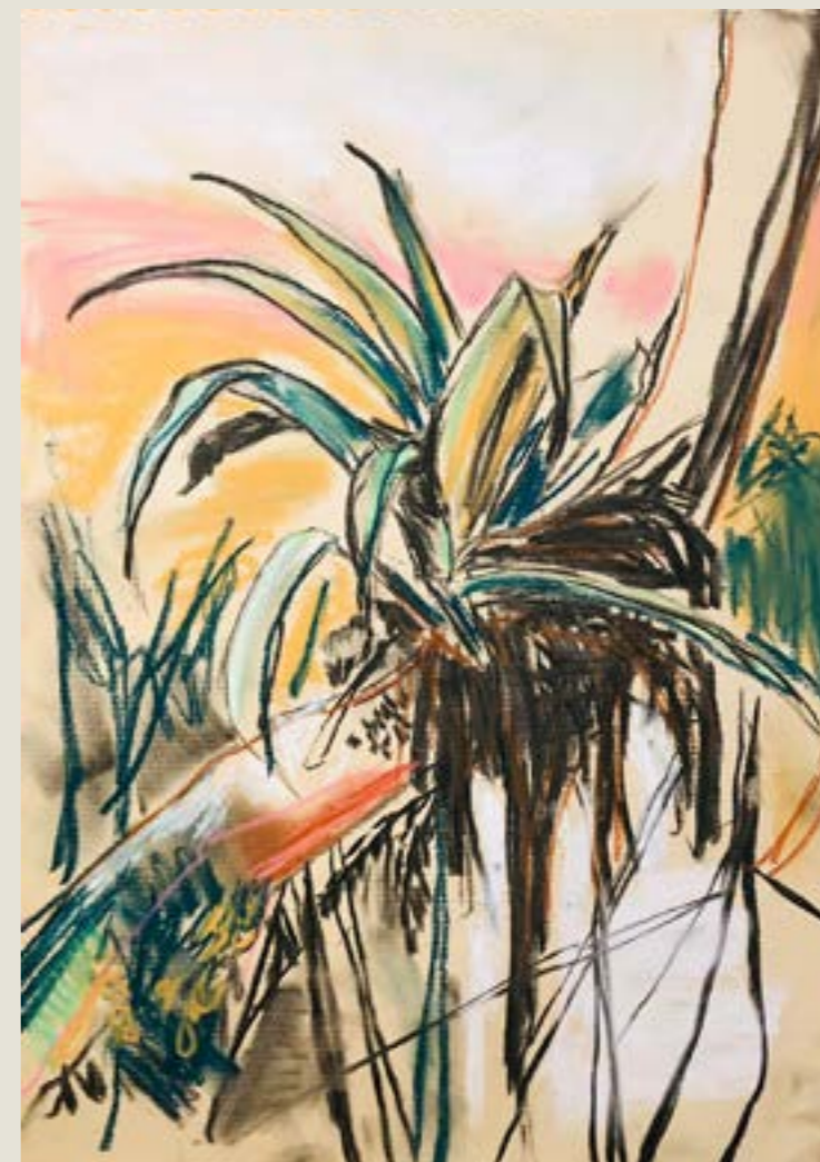
figura 10. bromélia no fim de tarde , pastel seco sobre papel, 30x42 ,2021.

Portanto, tendo em mente o trânsito de meu trabalho nestes olhares, quando estou fazendo um desenho, especialmente aqueles de observação, meu olhar ocupa funções contraditórias, não-excludentes, através de uma postura investigativa e contemplativa que, em última instância, se traduz em uma experiência que se balança entre horizontal e vertical, entre uma paisagem e um estudo botânico. Estas duas formas de percepção se colidem na minha imagem e se apresentam como uma tensão compositiva: um lugar de desconforto entre pintura e desenho.