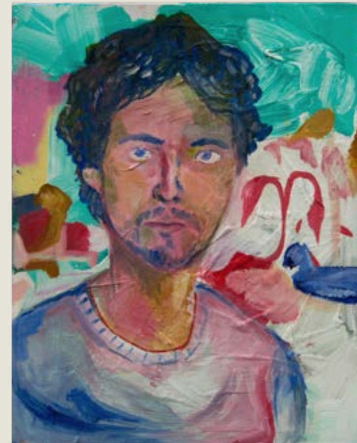
figura 34 . autorretrato, tinta acrílica sobre tela, 50x40cm, 2021.

Mais do que isso, este texto acompanhou um momento excepcional da minha vida e daqueles à minha volta. Seu final marca também o final de minha estadia nesta casa. Para simbolizar este encerramento, decidi montar uma pequena exposição particular. Não tenho paredes brancas, portanto retorno a metáfora do varal.