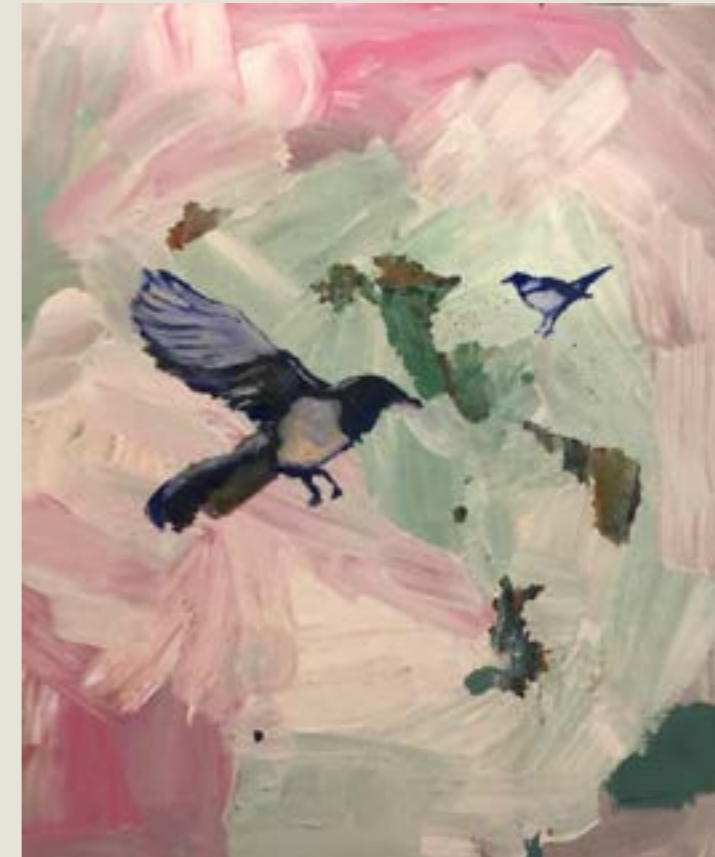
figura 33. pássaros , tinta acrílica e óleo sobre tela, 50x40cm, 2021.

O objetivo inicial deste texto era acompanhar minha produção artística, talvez fosse uma ideia inocente, porque o que realmente aconteceu é que o texto não só acompanhou como moldou e se fundiu a minha maneira de trabalhar. Meu principal aprendizado foi perceber que escrever esta história, linha condutora descritiva de meu ambiente, processos e motivos, deu ao trabalho saudável estabilidade que perdurou durante a totalidade do ano de 2021 — me fez seguir adiante. O acompanhamento textual fez com que estas ideias “novas” que geralmente sedimentavam as “velhas” fossem postas lado a lado (ao invés de sobrepostas) presas a uma linha (o próprio texto) como em um varal.