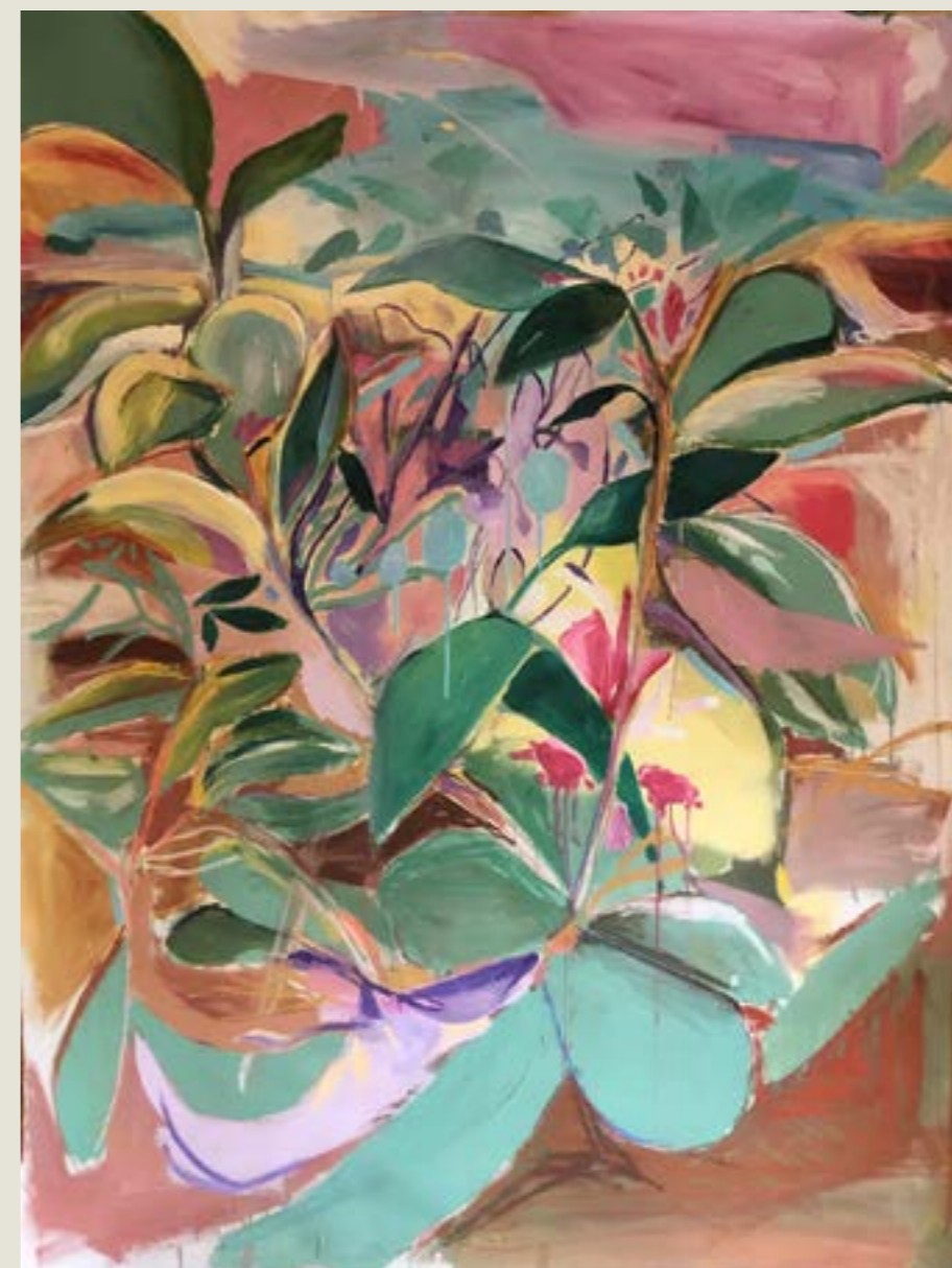
figura 23. vista do mato II , tinta acrílica e pastel seco sobre tela, 120x150 cm, 2021.

Na minha prática, um bom exemplo do erro como guia é um trabalho que me assombrou durante alguns meses que chamo de vista do mato II (fig.23). Meu ímpeto inicial era, como já comentei em outro capítulo, reproduzir em escala ampliada um pequeno desenho que havia feito em um precioso dia ensolarado. O desafio de cara já me apresentou diversos “erros”: a escala saiu torta, as cores não fechavam e alguns materiais não aderiram ao suporte. Isso pouco me abalou por estar ciente que em outro ambiente, com outros materiais, em outro tamanho e sem um estudo prévio minucioso da imagem referente esses percalços obviamente surgiriam. Pois era justamente esse amontoado de imprecisões que eu buscava para que elas me propusessem uma nova imagem. Porém, minhas subseqüentes soluções me afastaram ainda mais da imagem base a ponto da relação entre elas se tornar apenas