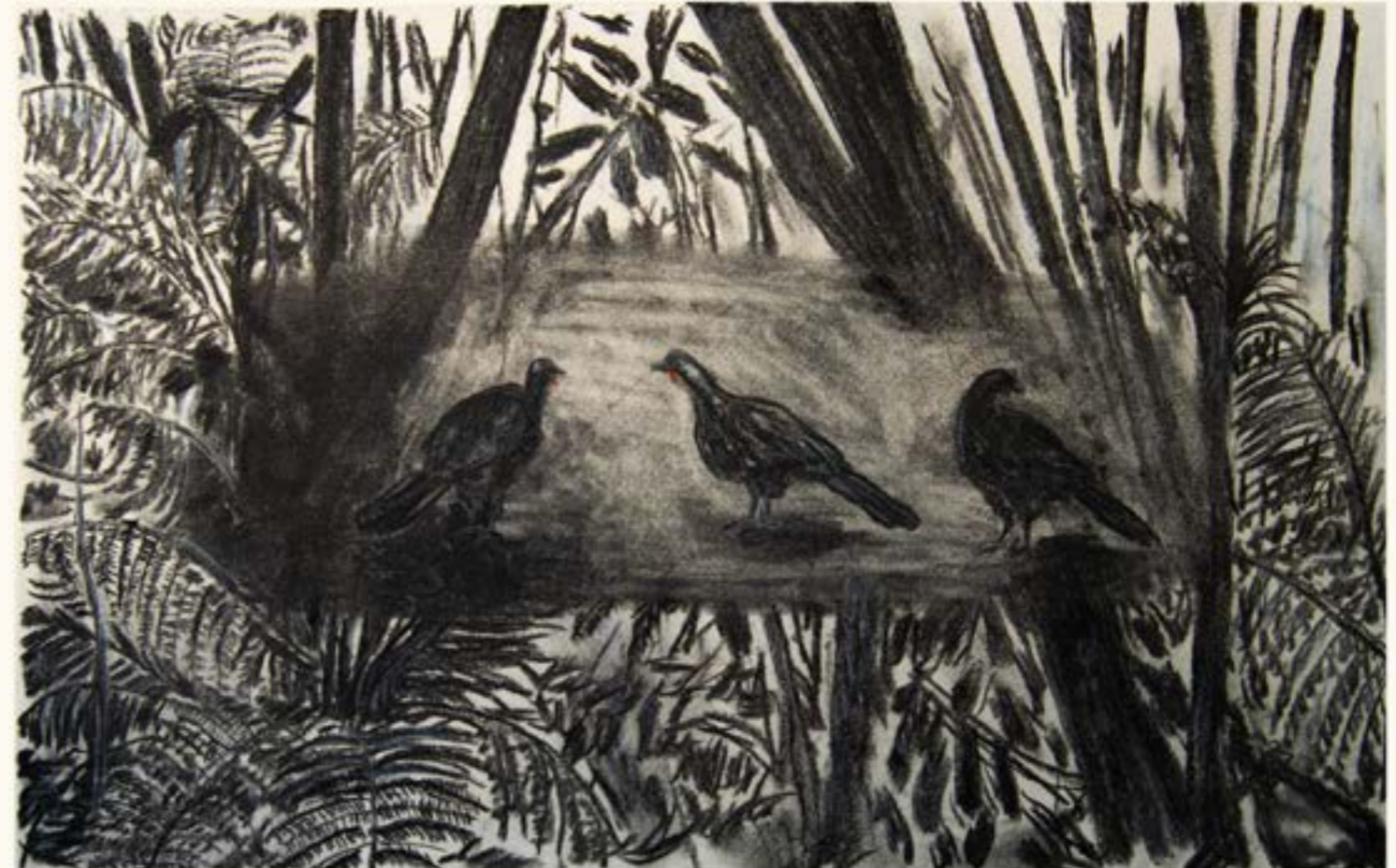
figura 21. 3 jacus, carvão sobre papel, 34x50cm, 2021.

Como citei brevemente, o erro é parte fundamental da minha relação com a criação da imagem. Desenvolvo uma dinâmica dialética entre o choque de minha vontade artística com meus erros, e o resultado desse encontro dá vida à obra.