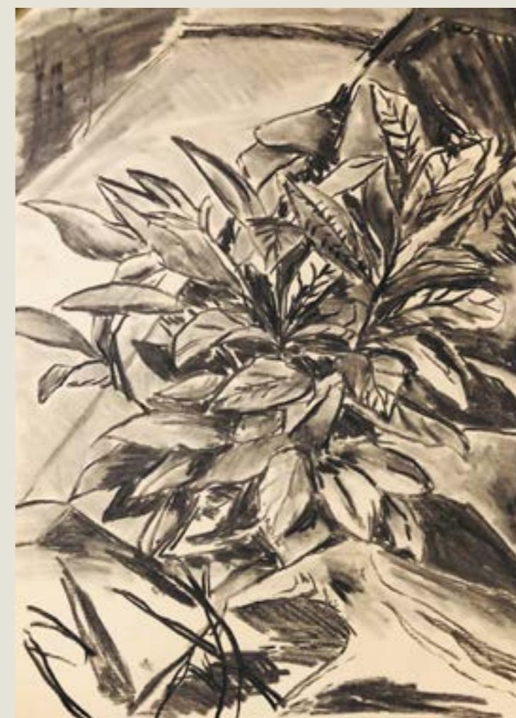
figura 8. arbusto , carvão sobre papel, 30x42cm , 2021.

Ainda que o senso de conjunto encontre um lastro muito grande na produção de paisagens, Maderuelo, autor do tema, é enfático ao colocar no centro da experiência paisagística o olhar contemplativo que a cria. Este olhar contemplativo muitas vezes é confundido com um olhar passivo, externo a ponto da ausência — um olhar que não interfere. Mas penso que este olhar passivo não exista completamente, digo isso refletindo sobre meus motivos na produção destes desenhos. Observo que ao produzir um desenho paisagístico me aproximo do tema, trago para mim, aculturo a imagem e de certa forma domestico o ambiente, no sentido de tornar aquilo representado em algo mais próximo a “familiar”.