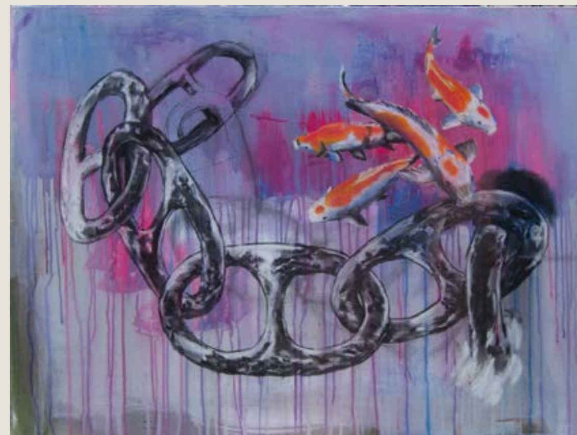
figura 26. peixes , tinta acrílica, carvão, giz e pastel seco sobre tela, 90x120 cm, 2021.