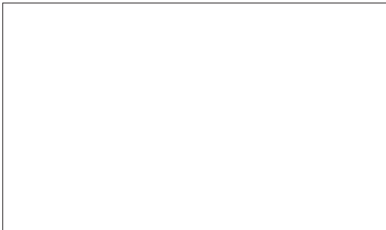
GRÁFICO 2 - Quantidade acumulada de respostas dos usuários das bibliotecas, por faixa de valor

Conforme a TAB. 2, verifica-se que o valor modal do item 3.1 avaliação geral foi 8 (com sete notas) e do item 3.5 opções de salvamento dos resultados foi 7, 8 e 9 (cada um com três notas). A moda das demais questões foi 9 (com cinco notas cada). A mediana de todas as questões foi 8. Estes resultados evidenciam a consistência da avaliação positiva da base pelos usuários.