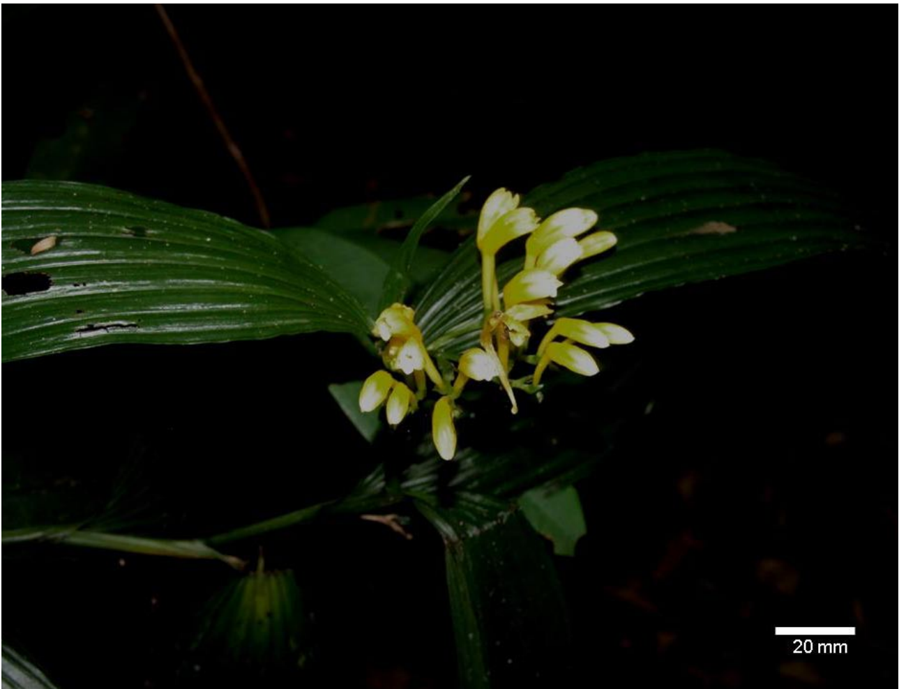
Figura 1. Corymborkis flava (Sw.) Kuntze. Detalhe de planta florida.