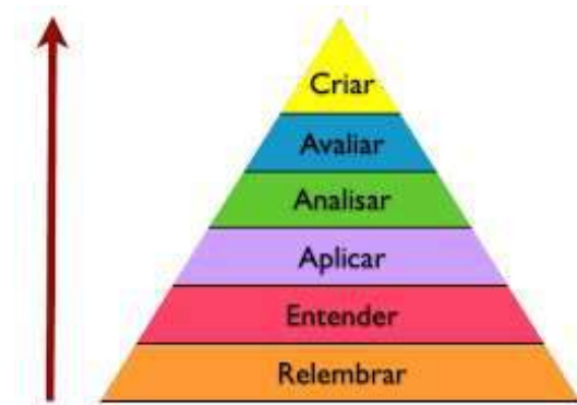
Figura 1- Taxonomia de Bloom