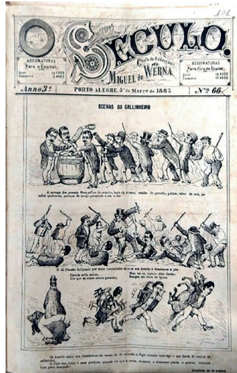
Figuras 7: O Século , capa da edição N° 66, 05 de março de 1882.

7), foram poupadas das críticas impressas no jornal (Damasceno Ferreira, 1962, p. 99-104).