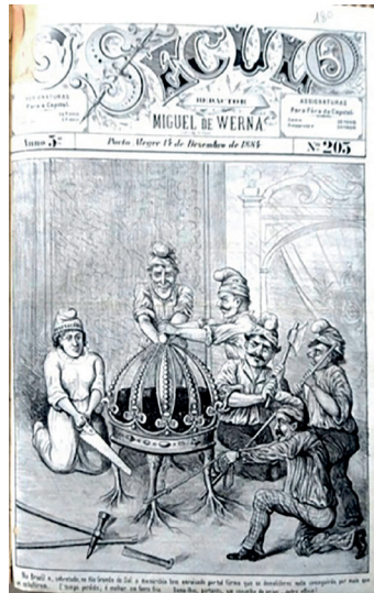
Figura 2: O Século , capa da edição Nº 205, 14 de dezembro de 1884.