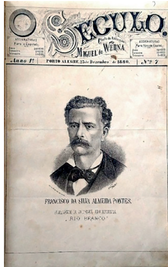
Figura 3: O Século, capa da edição N° 7, 25 de dezembro de 1880.