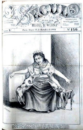
Figura 1: O Século , capa da edição Nº 146, 14 de outubro de 1883.

em que apoia a monarquia, ataca com críticas e sátiras os republicanos e, principalmente, os liberais, posiciona-se contrária à escravidão, mantida pela monarquia que defende (Fig. 1). Com o advento da república, o editor cai no ostracismo, transfere-se para o Rio de Janeiro encerrando o ciclo do jornal.