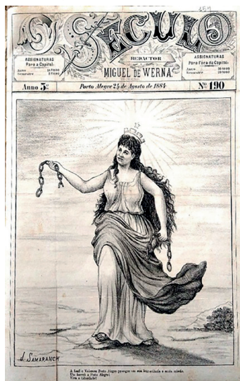
Figura 22: O Século , capa da edição Nº 190, 24 de agosto de 1884.