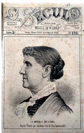
Figuras 8: O Século , capa da edição Nº 194, 28 de setembro de 1884.

A par das reviravoltas formais – estéticas, gráficas e visuais – O Século , repellido pelas famílias, alcança êxito, podendo-se inferir que refletia a opinião de boa parte da sociedade gaúcha, dos leitores e seus círculos de influência. Também os seus conteúdos políticos e polêmicos podem ter corroborado com o sucesso; são muitas as contradições que envolvem o jornal de Werna: monarquista, alinhava-se aos republicanos no ataque ao clero, mas opunha-se a estes ao preservar o imperador Pedro II, pai da Princesa Isabel que viria a assinar a lei da abolição (Damasceno Ferreira, 1962, p. 119) e cuja visita a Porto Alegre, logo após a Campanha Abolicionista de 1884, foi comemorada pela publicação (Fig. 8).