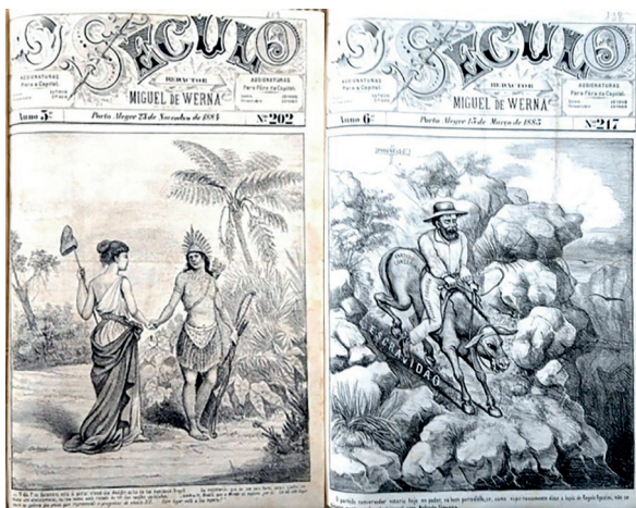
Figuras 24 e 25: O Século, capa da edição Nº 202, 23 de novembro de 1884. O Século, capa da edição Nº 217, 15 de março de 1885.