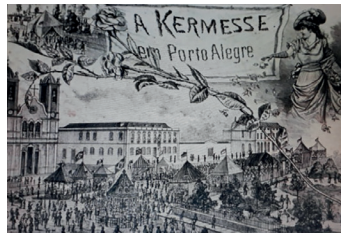
Figura 4: Quermesse abolicionista

Joaquim Homem registra ainda em “Apontamentos” (1888) que o escritor Karl von Koseritz, em coluna no jornal A Reforma , predisse que até a festa marcada para o dia 7 de setembro haveria mil cartas de liberdade; o abolicionista observa que o “número foi superado” e que no dia da festa, uma sessão extraordinária da Câmara Municipal proclama “livre de escravos o município de Porto Alegre”. Na sequência, realiza-se a “ kermesse abolicionista” (Fig. 4), divulgada pela imprensa e para a qual as comissões muito trabalham no sentido de arrecadar donativos e bens para custear as cartas de alforria (Homem, 1888, p. 7,8 e 10).