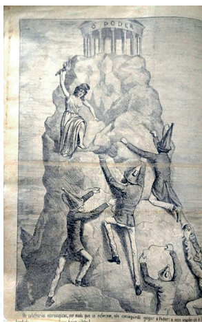
Figura 26: O Século, contracapa da edição Nº 217, 15 de março de 1885.