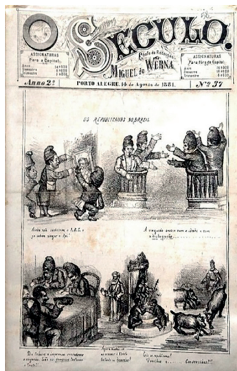
Figuras 5: O Século , capa da edição Nº 37, 14 de agosto de 1881.