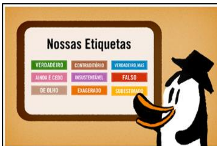
Figura 1 – Apresentação das etiquetas utilizadas pela agência Lupa