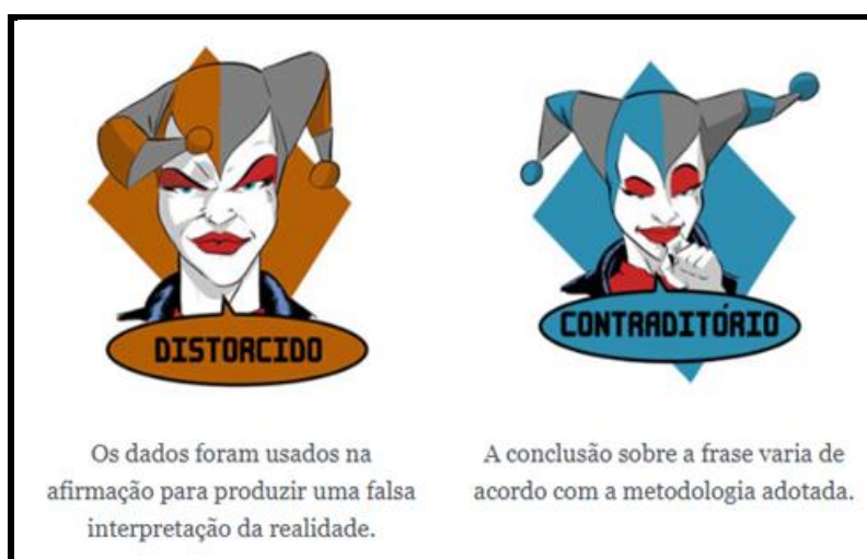
Figura 3 – Apresentação dos selos utilizados pelo projeto Truco até julho de 2018

Até julho de 2018, o Truco utilizou mais dois selos, conforme a figura abaixo, mas que foram descontinuados: “ distorcido ”, para quando os dados que haviam sido usados na afirmação produziam falsa interpretação da realidade e “ contraditório ” era usado quando a conclusão sobre a frase variava de acordo com a metodologia adotada.