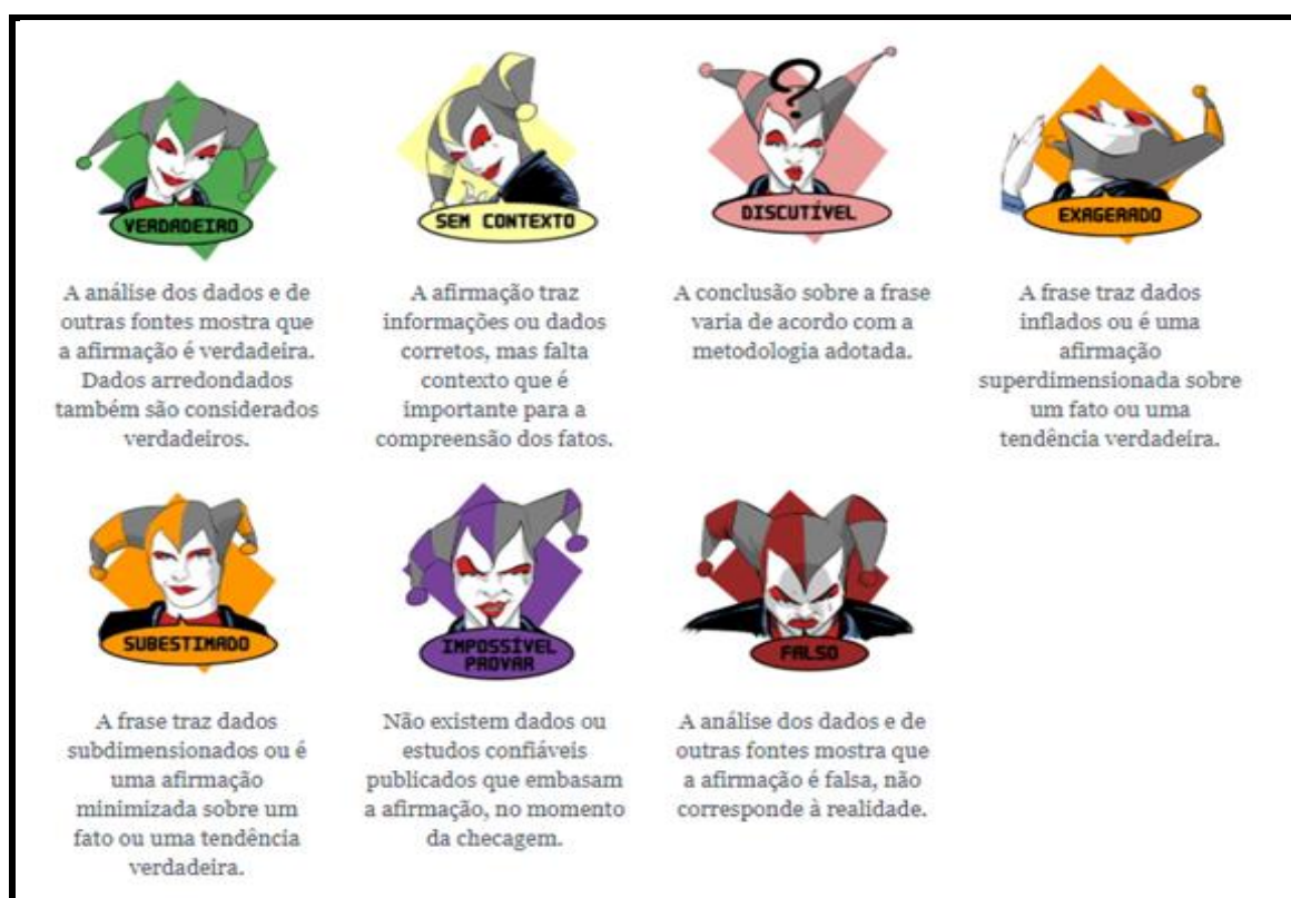
Figura 2 – Apresentação dos selos utilizados pelo projeto Truco

As informações coletadas eram comparadas e classificava-se a informação com atribuição de selos para facilitar a compreensão dos resultados. Entrava-se em contato novamente com o autor da afirmação para que se explique. A figura abaixo representa os selos utilizados pelo projeto Truco que são importantes, pois promovem dinamismo às publicações.