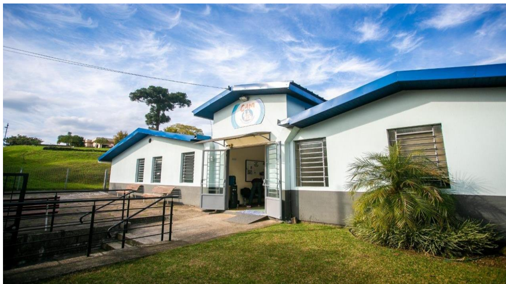
Imagem1 - Fachada do CAM

Referente a espaço físico do CAM, o Centro possui uma casa localizada na Rua Professor Marcos Martini em Caxias do Sul. A estrutura física que o CAM dispõe conta com quatro salas de atendimento individual, sala de aula, sala da recepção e acolhida, dois banheiros, uma sala de reuniões e a parte administrativa. Na recepção, além das cadeiras de espera e o balcão da recepcionista, são servidos café, água e lanche para as pessoas que aguardam o atendimento.