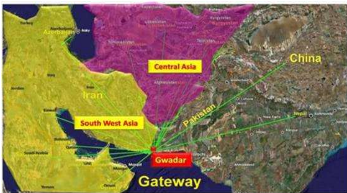
Figura 1 - Posição regional do Porto de Gwadar