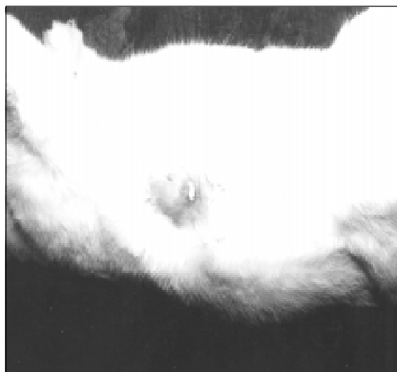
Figura 1 – Coelha, apresentando abscesso na região mamária direita.

Quinze coelhas afetadas foram necropsiadas e amostras de diversos tecidos incluindo as glândulas mamárias foram coletadas e processadas para exames histopatológicos. À necropsia, observou-se que a principal lesão estava presente nas mamas e consistia de abscessos contendo pus (Figura 1) de cor clara e consistência cremosa, além de pequenas nodulações irregulares. Vários destes animais apresentavam abscessos em outros órgãos incluindo coração, pulmão, fígado (Figura 2) e rins. Também eram observados abscessos de aproximadamente 0,5cm de