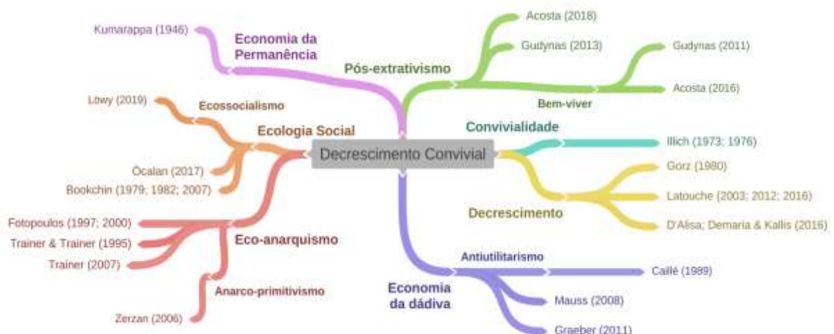
Figura 2. Mapa mental do Decrescimento Convivial e alianças. Elaboração própria.

Ivan Illich (1981a) propôs o debate sobre limites análogos à provisão de serviços. Argumenta que agências de serviços levavam inevitavelmente a efeitos colaterais destrutivos, comparáveis àqueles causados pela produção de bens físicos. O autor debruçou-se (Illich, 1975; 1976; 2005a; 2018) sobre os processos que instruíam as pessoas a buscarem desenvolver suas atividades e, de maneira ampla, viver suas vidas não como sujeitos que interagem com o ambiente a sua volta e o moldam de acordo com seus desejos, mas como clientes, demandando de instituições burocráticas o fornecimento de produtos para satisfazer suas necessidades.