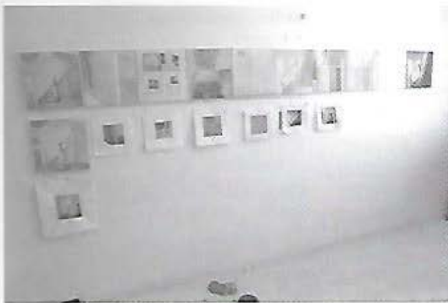
Inversões em branco, 2005 – acrílico s/tela – 30 x 300cm

Ao iniciar a pintura dos dois primeiros módulos, coloquei as imagens fotográficas “emolduradas” por um visor de papel branco - artifício que me ajuda a selecionar parte da imagem. A princípio, tinha apenas a idéia de ir construindo espaços arquitetônicos, módulo por módulo, jogando com diversos pontos de vista: de topo, de baixo para cima, frontal, aproximado, distante, etc... Mas ainda tinha dúvidas do porquê, da definição da horizontalidade daquela seqüência. Sentia falta de uma justificativa. Por que aquele formato que evocava a idéia de seqüencialidade? Na verdade, eu ainda não havia achado uma razão, apenas me agradava a quantidade de imagens. Mas, em um determinado momento, com dúvidas sobre perder certa zona de pintura, resolvi fotografar as pinturas em andamento. Ao olhar pelo visor da câmera fotográfica, fui surpreendida por uma seleção que viria a ser, depois