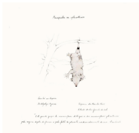
Walmor Corrêa Biblioteca dos enganos , 2009. Detalhe “Gambá de vagina dupla”. De- senhos a lápis de cor e grafite sobre papel, medidas variáveis

ção, vem a ser a distinção entre “a possibilidade e a realidade das coisas” 16 , entre o que é colocado como real e o simplesmente colocado como possível. A partir deste delineamento conceitual se percebe, na Biblioteca dos Enganos, o permanente embate entre o real e o possível, ora nos manuscritos de Von Ihering, como nos desenhos de Walmor Corrêa - trazem ambos todas as controvérsias que estas produções encadeadas envolvem, especialmente consideradas como representações ficcionais. Estas compõem a estrutura fundamental deste trabalho, pois se conhece a ficção como uma enunciação falsa ou incerta, mas assumida como verdadeira - e se situa assim, entre suas mais contraditórias verdades e inverdades, no âmago da concepção artística que alicerça a Biblioteca dos Enganos.