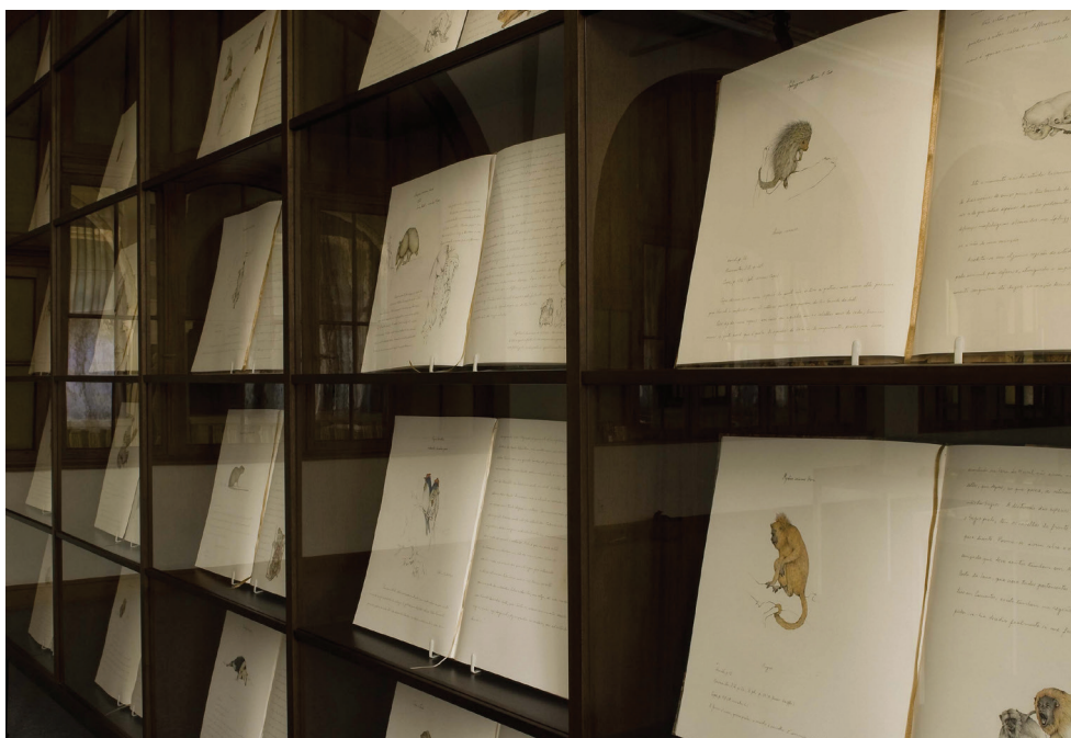
Walmor Corrêa Biblioteca dos enganos , 2009 Bienal do Mercosul

Essas poéticas artísticas em estudo revelam processos específicos de investigação a cada uma, em seus modos de incorporar a vida, situações específicas do saber, e expõem, sob diversas perspectivas, modos diversos de ser do saber. Com isso, inquietam, em cada uma de suas configurações, as noções de verdade, mas também, as crenças, fábulas, simulações ou ale-