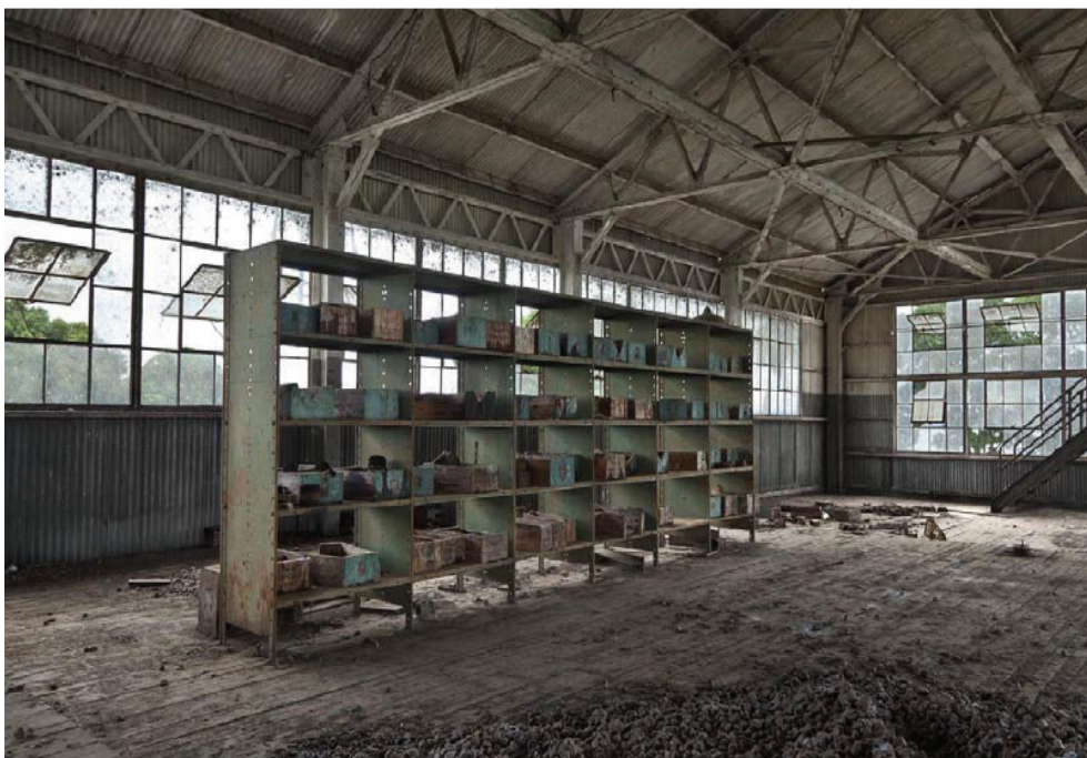
Romy Poczaruk Lost Utopia , 2011 Impressão jato de tinta sobre papel algodão, 90x60cm