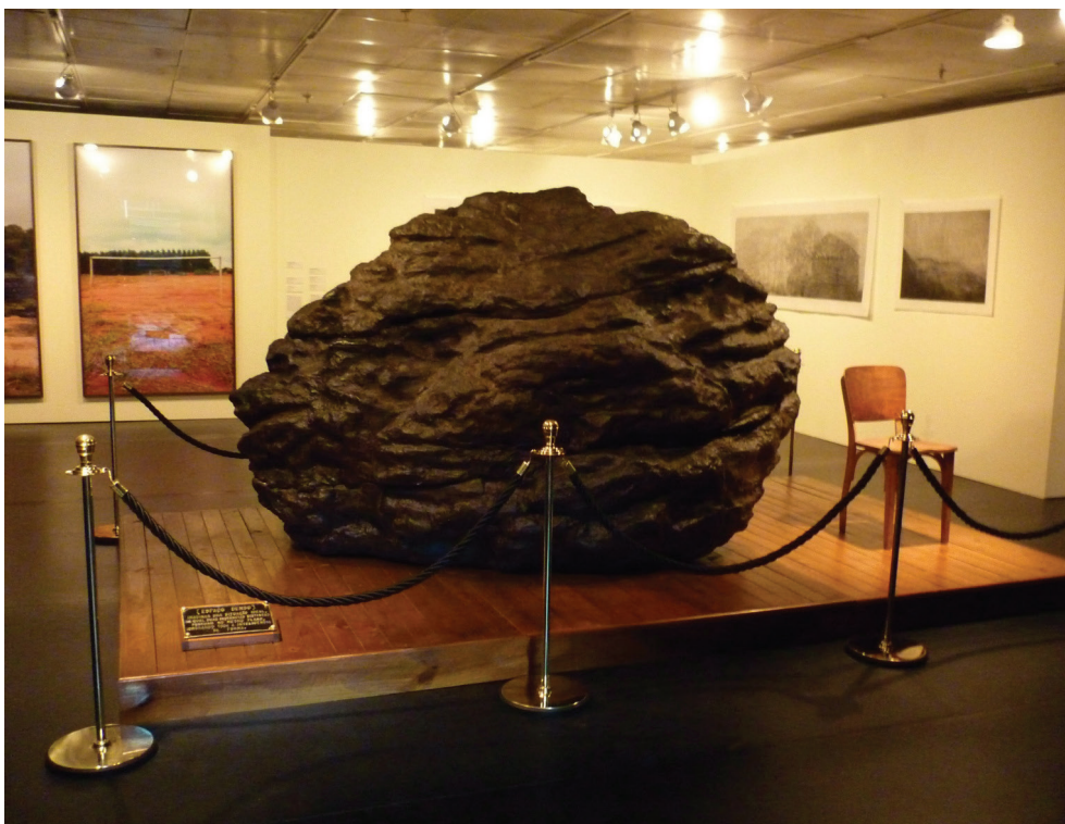
Michel Zózimo Meteorito e cadeira , 2012 Instalação - objeto de resina, cadeira, placa de bronze, tablado Fundação Vera Chaves Barcellos

campos de conhecimento. Esta ilustração, em particular, revela um grande meteorito exposto no Museu Americano de Ciências Naturais de Nova York e nela também mostra-se uma cadeira em escala pequena, que o leva a estabelecer relações com a conhecida obra conceitual de Joseph Kosuth (1965), “Uma e três cadeiras”. Ao mesmo tempo, o artista encontra a ilustração de René Magritte “ L’Anniversaire ”, de 1959, na qual se reconhece o mesmo imenso meteorito representado em uma pintura que quase extravasa o espaço da sala, ao comprimir todo o espaço da pintura.