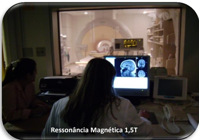
Ressonância Magnética 1,5T

radiologistas, residentes, físicos, além de pessoal administrativo. O Serviço atende a clientela proveniente de todas as áreas do HCPA, desenvolvendo relações de interdependência com os setores envolvidos.