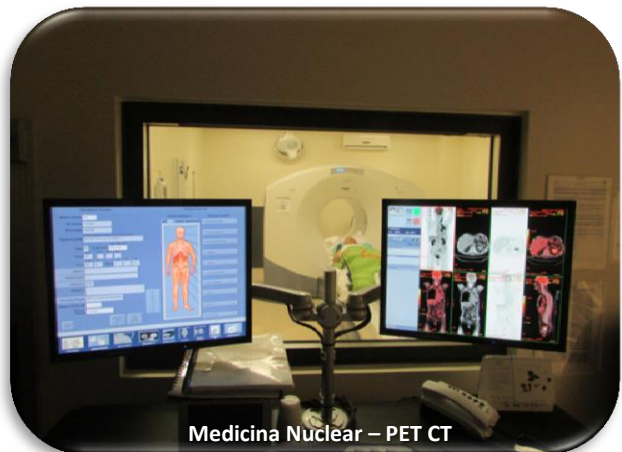
Medicina Nuclear – PET CT