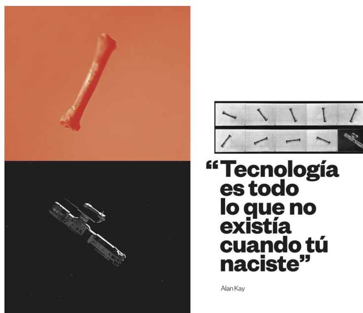
Figura 2: Combinación de imagen y texto en doble página del libro Media Evolution 18

Fuente: SCOLARI, Carlos; RAPA, Carlos. Media Evolution . Sobre el origen de las especies mediáticas, 2019b. p. 20-21.