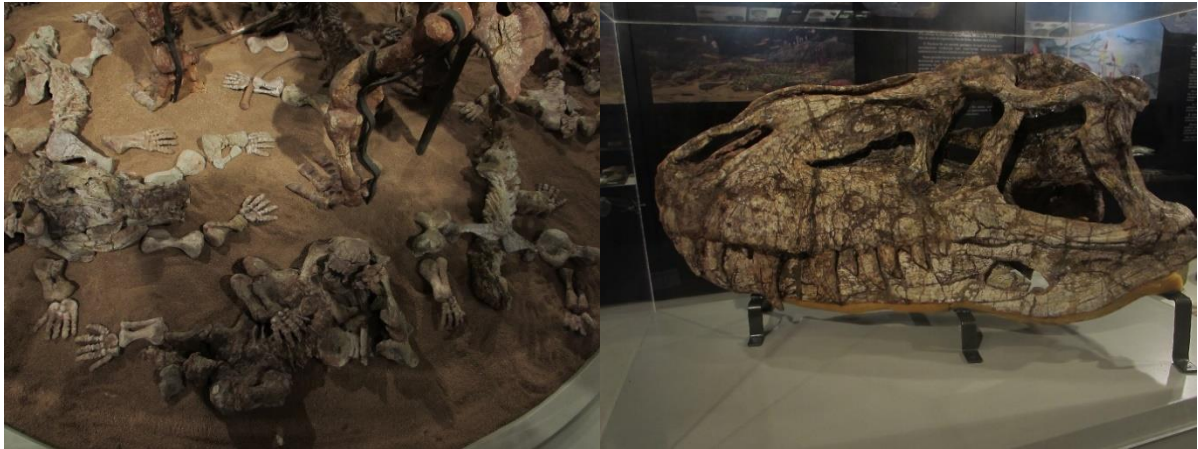
À esquerda filhotes de Dinodontosaurus , à direita crânio de Prestosuchus chiniquensis .

O patrimônio paleontológico de Candelária também contribuiu para a descrição de novas espécies, como o dinossauro Guaibasaurus candelariensis (BONAPARTE; FERIGOLO; RIBEIRO, 1999), o dicinodonte Jachaleria candelariensis (ARAÚJO; GONZAGA, 1980), os cinodontes Candelariodon barberenai (OLIVEIRA et al. , 2011), Aleodon cromptoni (MARTINELLI et al. , 2017), Bonacynodon schultzi (MARTINELLI; SOARES; SCHWANKE, 2016), Botucaraitherium belarminoi (SOARES; MARTINELLI; OLIVEIRA, 2014), Riograndia guaibensis (BONAPARTE; FERIGOLO; RIBEIRO, 2001) e Irajatherium hernandezii (MARTINELLI et al. , 2005), o procolofonoide Candelaria barbouri (PRICE, 1947 apud CISNEROS et al. , 2004), e o esfenodonte Clevosaurus hadroprodon (HSIOU et al. , 2019).