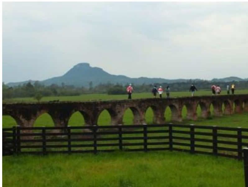
Figura 2 - Aqueduto de Candelária com o Cerro do Botucaraí ao fundo