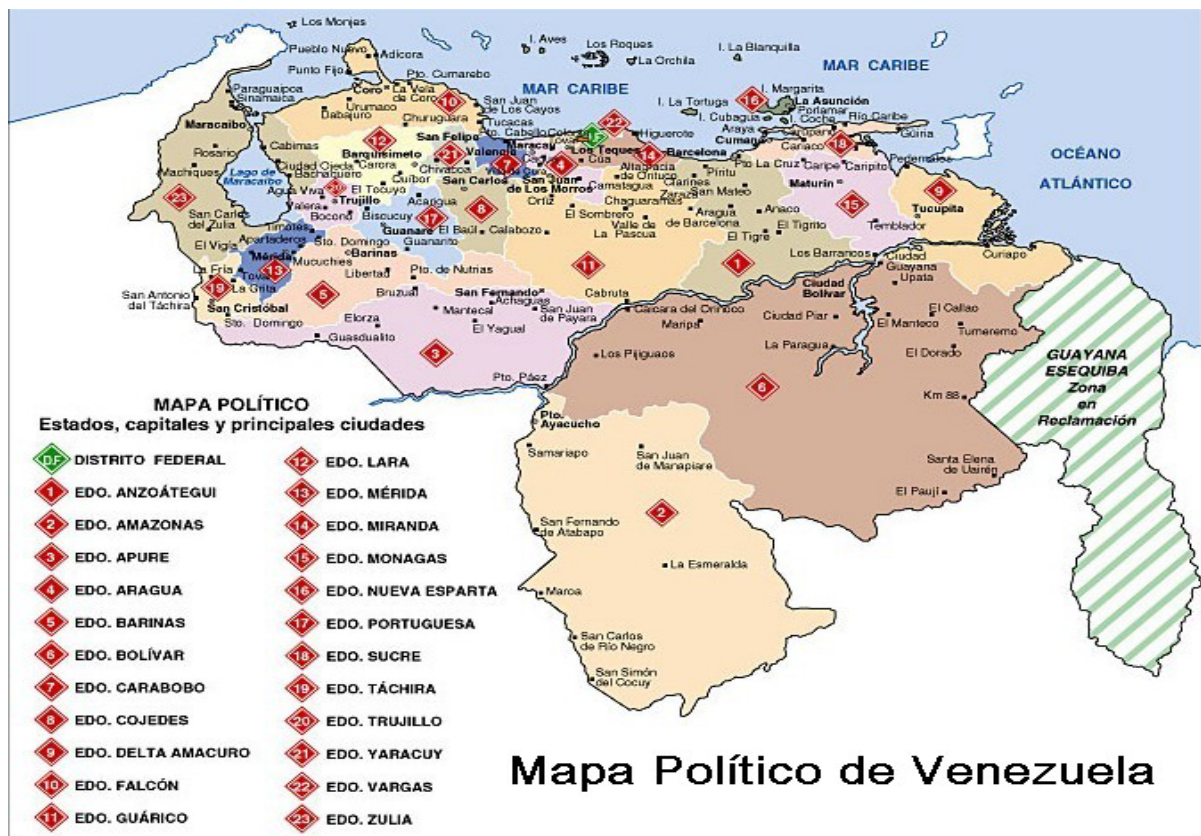
Figura 2: Mapa político da Venezuela.

O interesse da Guiana em participar do Acordo Energético de Caracas e do Petrocaribe, aliado á política de boa vizinhança adotada por Chávez, foi determinante para o apaziguamento das relações bilaterais. Na realidade, a reclamação territorial ficou em segundo plano diante das pretensões regionais. Ainda assim, em 2006, o Congresso venezuelano aprovou o projeto do presidente Chávez que modificava a bandeira do país, acrescentando uma oitava estrela, cujo significado era um tributo à contribuição da província da Guiana por sua luta pela independência no século XIX. Os mapas oficiais também registram a presença da Guiana Essequiba, denominando-a como zona en reclamación . No mapa abaixo, a zona em disputa está hachurada em verde.