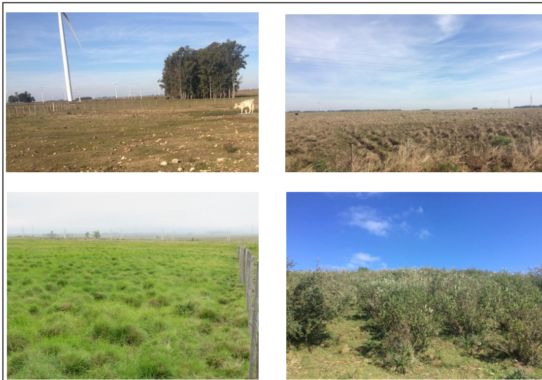
Figura 2: Aspecto da vegetação em áreas com: 1) alta pressão de pastejo (Nativo AP), 2) com baixa pressão de pastejo (Nativo BP), 3) capim-annoni-2 (Annoni) e 4) vegetação lenhosa (Lenhosa).

O levantamento das amostras da classe Annoni foi realizado em áreas com alta ocorrência da espécie invasora. Além da coleta de pontos referentes a classe, parte das amostras passaram por um diagnóstico de cobertura vegetal. Para esse levantamento foi empregada uma adaptação do método Interceptação na linha de Canfield (1941), em que se utilizou um transecto plotado aleatoriamente em áreas com alta infestação de capim-annoni-2 através de uma trena de 30 metros fixada por estacas, onde foram tomadas às medidas de início e fim do dossel vegetal da espécie invasora. Como resultado do diagnóstico de cobertura vegetal obteve-se a porcentagem do transecto coberta por Eragrotis plana Nees.