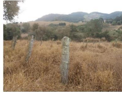
b) Vinhedo abandonado - Pedra Branca