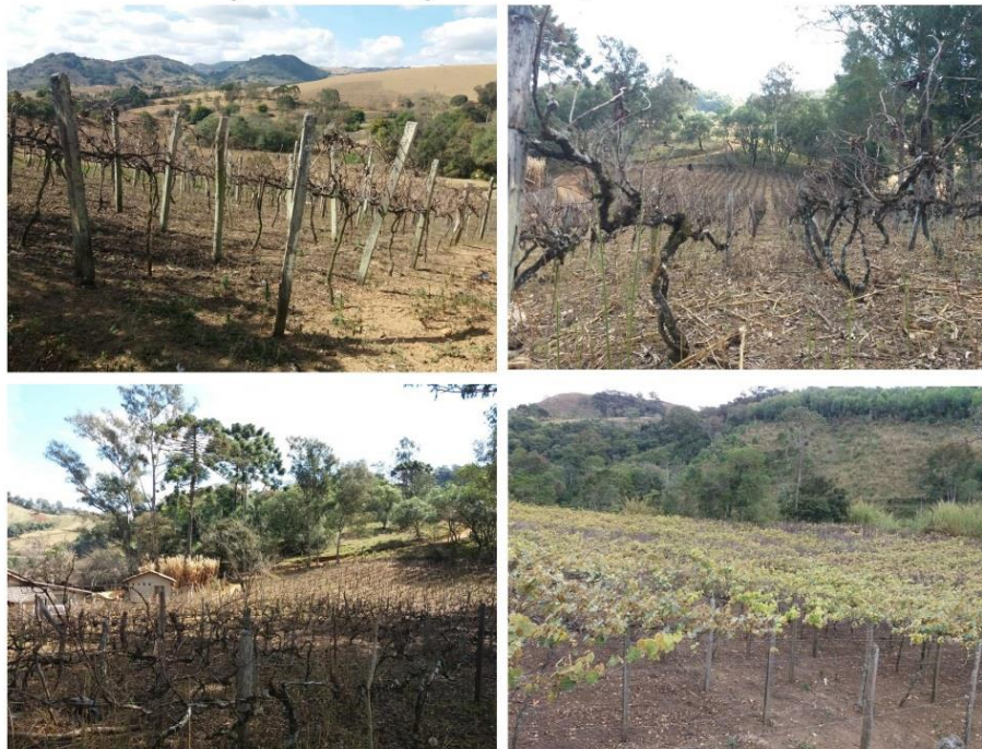
Paisagem vitícola (julho 2018) - Bocaina/Caldas-MG

Portanto estamos diante de um processo que podemos denominar de paisagens residuais da vitivinicultura nos municípios pesquisados. Foi muito notório durante a pesquisa de campo a presença de vinhedos e adegas abandonados. Em Caldas nos distritos rurais da Bocaina e Bom Retiro esse processo ficou muito explícito. Ainda são verificados pequenos vinhedos presentes na paisagem, como se observa nas figuras 1 e 2.