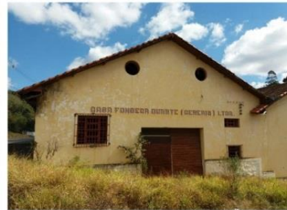
d) Antiga Vinícola Quinta de Caldas