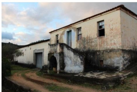
c) Adegas Savi