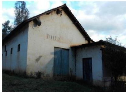
c) Antiga Adega Quinta Cachoeira