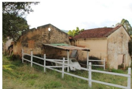
d) Adegas Santo Stivanin