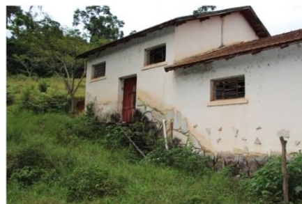
b) Adegas Campo Experimental Enologia