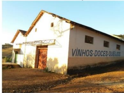
a) Antiga Adega Serrano