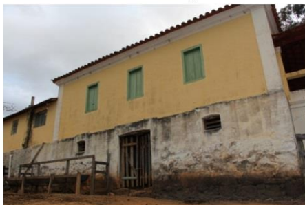
a) Adegas Ricardo Sasseron