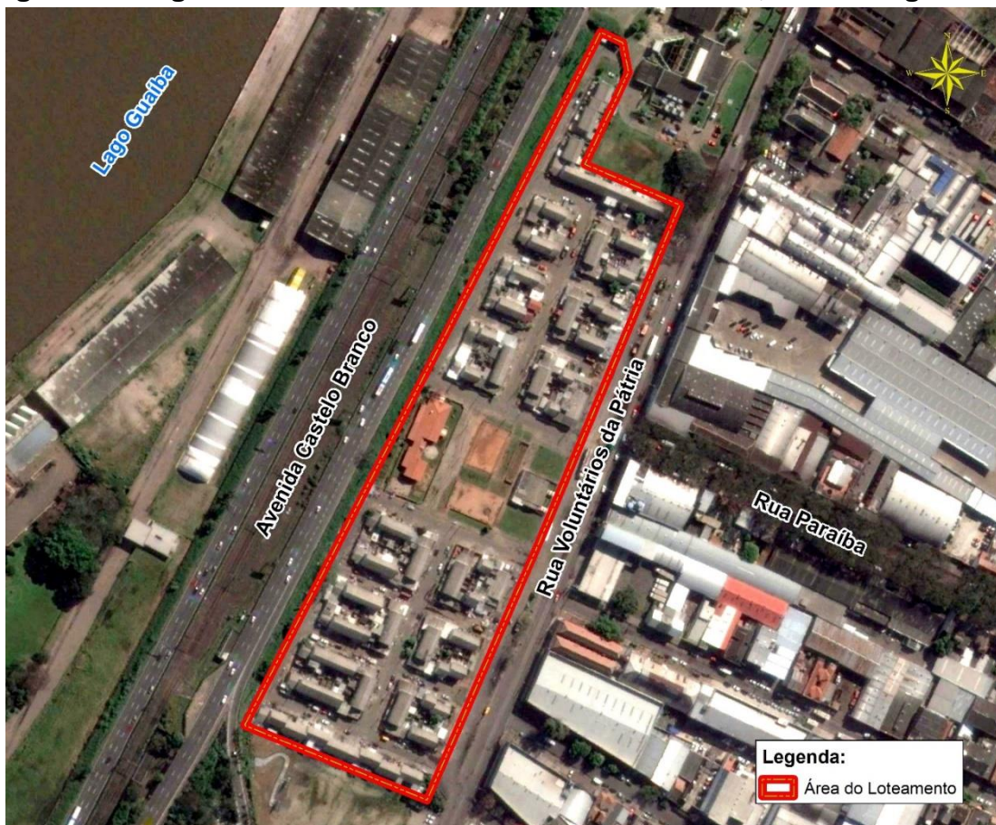
Figura 2- Imagem aérea do Loteamento Santa Terezinha, Porto Alegre/RS.

Fonte – Imagem Google Earth, 2017. Elaboração: Emilio Santos 2017.