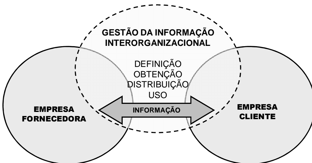
Figura 1 – Modelo conceitual da pesquisa

Esta pesquisa utiliza o modelo de GI proposto por Davenport (1998), aqui denominado GIIO. Por meio dele se investigará, em cada etapa, como as empresas de uma cadeia de suprimentos automotiva gerenciam a informação interorganizacional necessária à SCM (Figura 1).