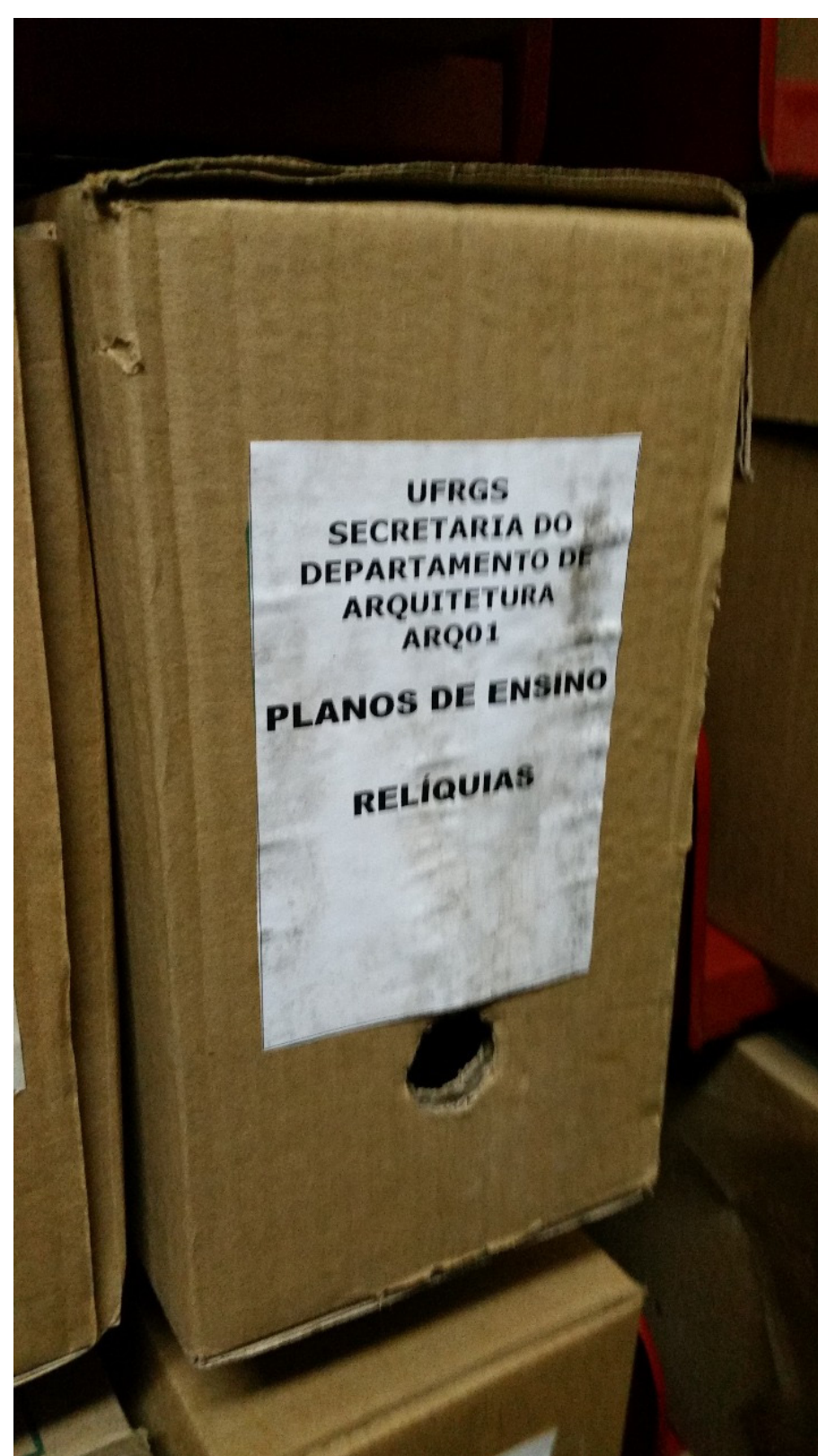
Imagem 2: caixa de documentos com planos de ensino.