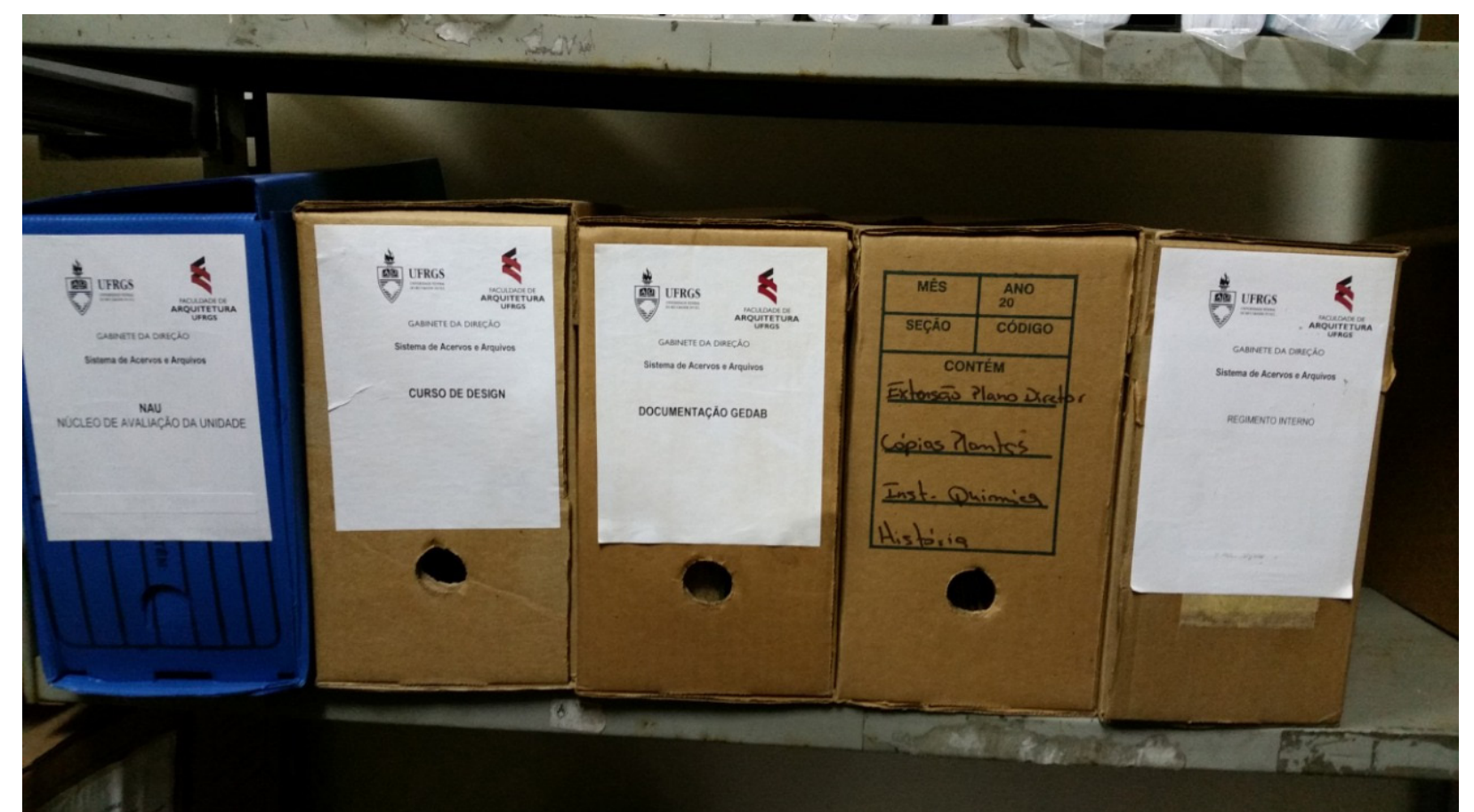
Imagem 5: caixas de documentos diversos.

O ensino de Planejamento Urbano dos arquitetos: experiência da Faculdade de Arquitetura da UFRGS