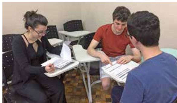
Figura 2 - Atendimento de recálculo para um beneficiário

cópia do contrato suspeito à empresa júnior.