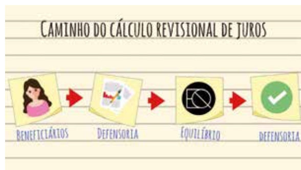
Figura 3 - Trâmite do Recálculo Revisional de Juros

A partir desse momento, os consultores da EAE cadastram os documentos recebidos e num prazo aproximado de quinze dias, entram em contato com os beneficiários para entregar um parecer final. Neste documento por meio das informações extraídas do contrato, constam os cálculos realizados e as tabelas com a conclusão feita pela equipe de Projetos da EAE, acerca da taxa cobrada pelas instituições financeiras. Se esta for considerada acima da taxa de juros média do mercado 2 (na data da contratação da modalidade de crédito correspondente), o indivíduo pode usar o laudo emitido pela EAE em um processo judicial para revisão de sua dívida, com o objetivo de ser equiparado.