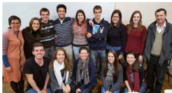
Figura 1 - Grupo de estudantes que recebeu a capacitação e de professores que ministraram o curso

e das armadilhas do consumo, bem como a relação da sociedade com o dinheiro, incluindo o abuso e a violência financeira promovidos por algumas instituições em relação a pessoas que não possuem muito conhecimento sobre finanças; no segundo encontro, intitulado "Organização Financeira", o intuito foi repassar noções de planejamento pessoal visando equilibrar as contas e o consumo; no terceiro encontro, cuja ênfase foi o "Uso do crédito e a matemática financeira", a ideia principal foi a conscientização sobre o uso do crédito, buscando compreender a melhor forma de utilizá-lo, ao mesmo tempo em que foram repassadas noções práticas de matemática financeira; no quarto e último encontro, sobre os "Direitos e Deveres do Consumidor", foi feita uma conscientização e reflexão sobre os direitos e deveres do consumidor, analisando-se o que é possível aprender com o endividamento excessivo e como sair dessa situação.