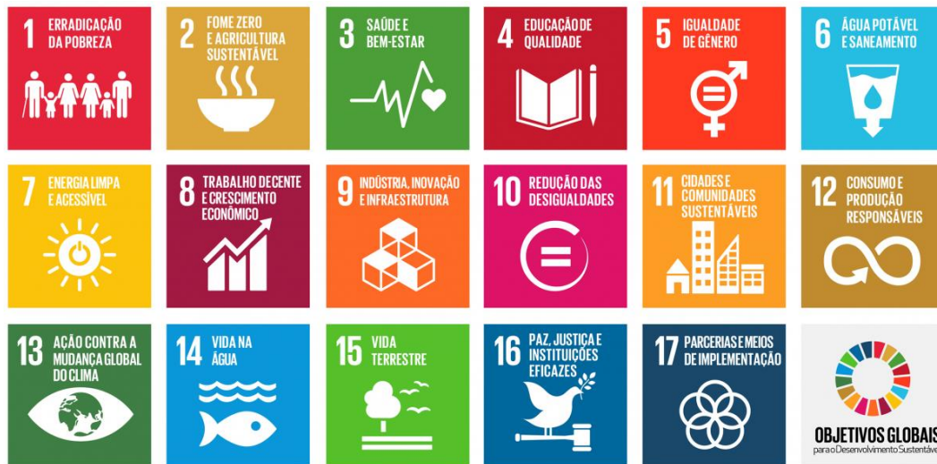
Figura 1: Os 17 Objetivos de Desenvolvimento Sustentável da Agenda 2030, da ONU.

sustentável. Anos depois, a "Conferência Rio+5" (1997) estabeleceu os "Objetivos de Desenvolvimento do Milênio (ODM)" com oito objetivos e 22 metas, com indicadores que possibilitavam acompanhar o cumprimento dessas metas. Em 2012, a "Rio+20" renovou o compromisso político com o desenvolvimento sustentável através do documento "O Futuro que Queremos". Mais recentemente, em julho de 2015, a "Terceira Conferência sobre Financiamento ao Desenvolvimento" (Addis Abeba, Etiópia) aprovou a "Agenda 2030 para o Desenvolvimento Sustentável" e 17 "Objetivos de Desenvolvimento Sustentável (ODS)", que contêm 169 metas a serem alcançados até essa data. Os 17 ODS refletem temas centrais como a Qualidade de vida das pessoas e o Futuro do planeta. No Brasil, para a implementação da Agenda 2030 foi assinado o Decreto nº 8.892 (31/10/ 2016) que cria a "Comissão Nacional para os Objetivos do Desenvolvimento Sustentável (ODS)", instrumento de governança para implementação dos ODS. Trata-se de uma instância colegiada, consultiva e paritária que reúne representantes dos governos federal, estadual e municipal e da sociedade civil e coordena as ações nacionais para o alcance das metas da Agenda 2030 (REDE SAÚDE) 13 .