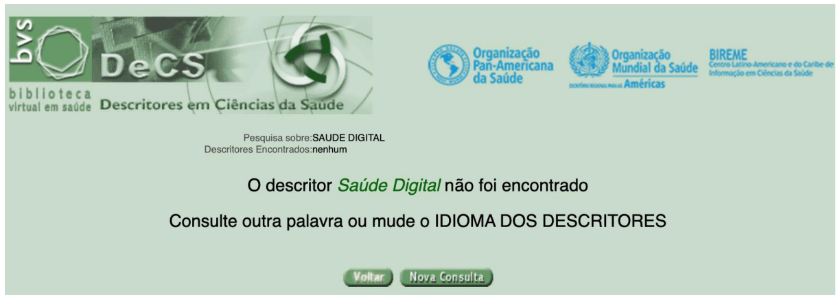
Figura 4 - Saúde Digital enquanto descritor em Ciências da Saúde