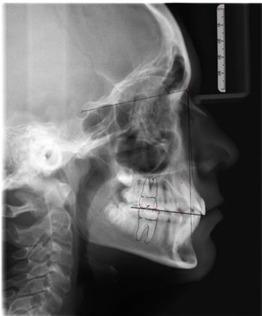
Figura 1. Traçado cefalométrico

Photos produced electronically using the Dolphin DIGITAL Imaging System.