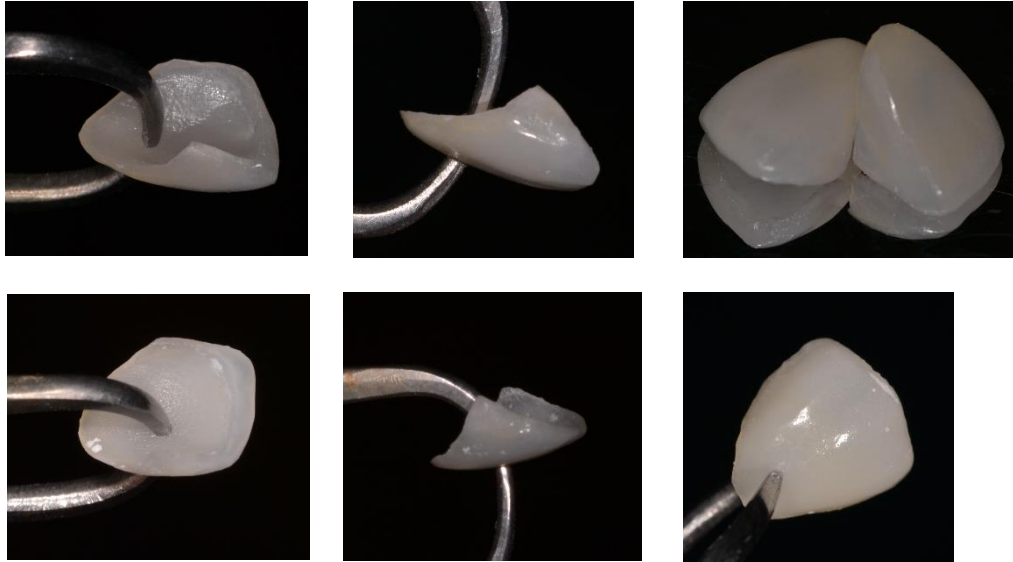
Figuras 13 – 18: Lâminas cerâmicas dos dentes 12 e 22 em maior detalhe, mínima espessura e grande naturalidade.