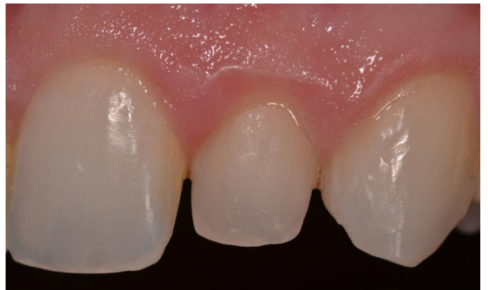
Figuras 9 e 10: Preparos minimamente invasivos finalizados após remoção das restaurações de resina composta.