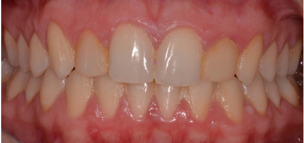
Figura 2: foto inicial intrabucal da paciente. Nota-se presença de restaurações em resina nos dentes 12 e 22 com manchamento e presença de placa bacteriana.