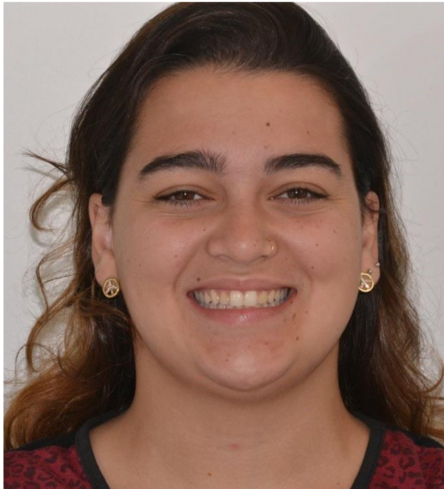
Figura 1: foto inicial de rosto com a paciente sorrindo.

Paciente do sexo feminino de 24 anos procurou atendimento do curso de especialização em Dentística da UFRGS relatando estar insatisfeita com a estética de seus incisivos laterais. Os dentes 12 e 22 apresentavam restaurações em resina composta com forma e coloração inadequada. Na entrevista dialogada a paciente relatou que já havia usado aparelho ortodôntico há cerca de 7 anos, criando um espaço do lado esquerdo que causava acúmulo de alimentos e estava insatisfeita com a forma de seus incisivos laterais que eram bem menores que o restante de seus dentes. Os dentes apresentavam-se vitais e sem sensibilidade.