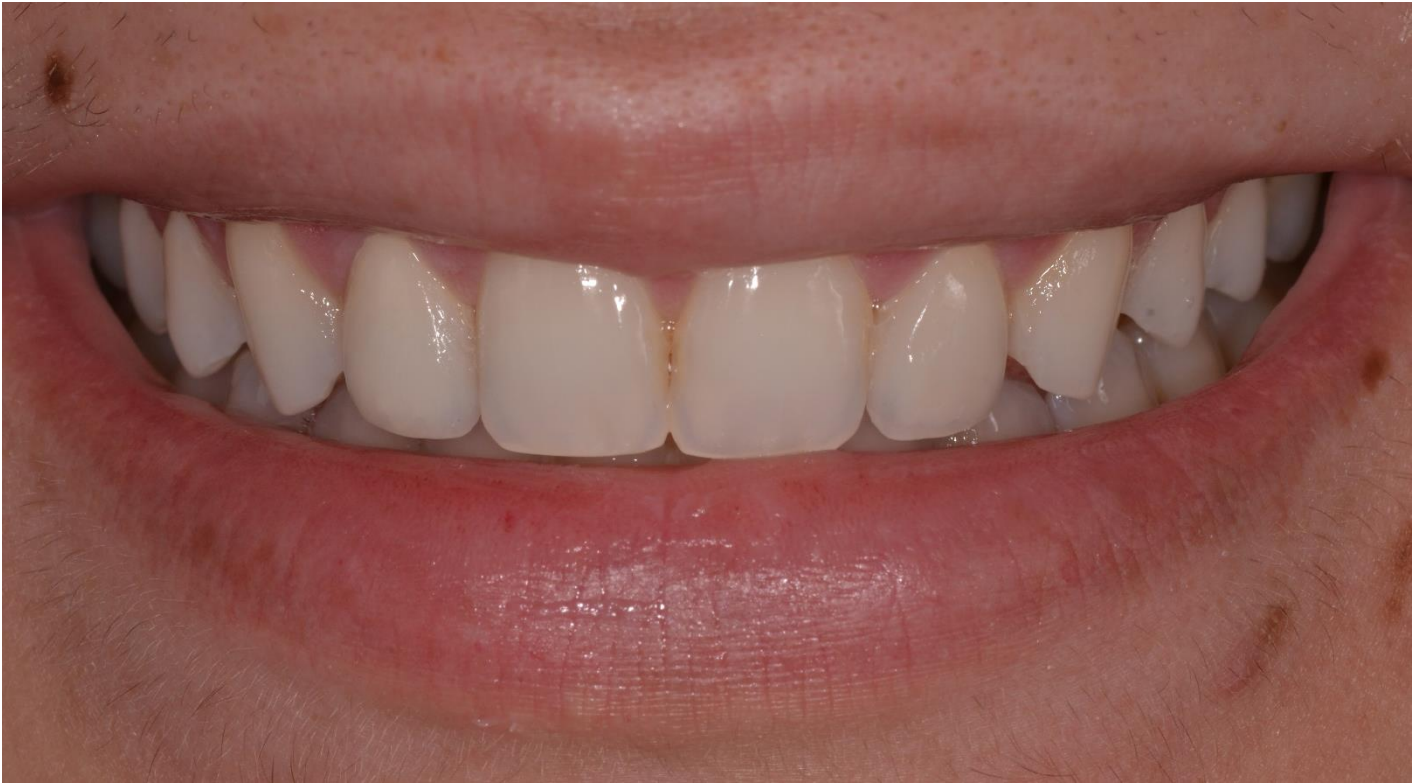
Figura 34: Foto final da paciente sorrindo após a cimentação das lâminas dos dentes 12 e 22.