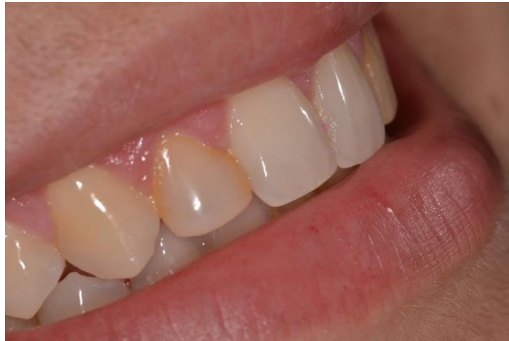
Figura 3: foto do lado direito do sorriso.