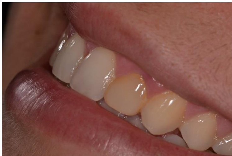
Figura 4: foto do lado esquerdo do sorriso.