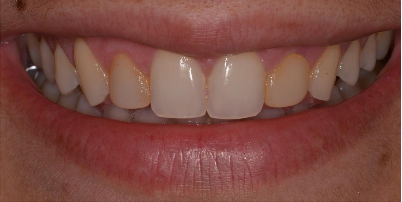
Figura 5: vista frontal do sorriso da paciente apresentando as restaurações de resina pigmentadas e com forma inadequada.

Na primeira consulta, foi realizada anamnese e exame clínico da paciente, seguido por confecção de modelos de estudo e análise fotográfica para elaboração do plano de tratamento.