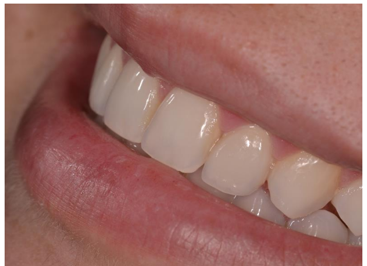
Figura 35 e 36: fotos finais da paciente sorrindo.