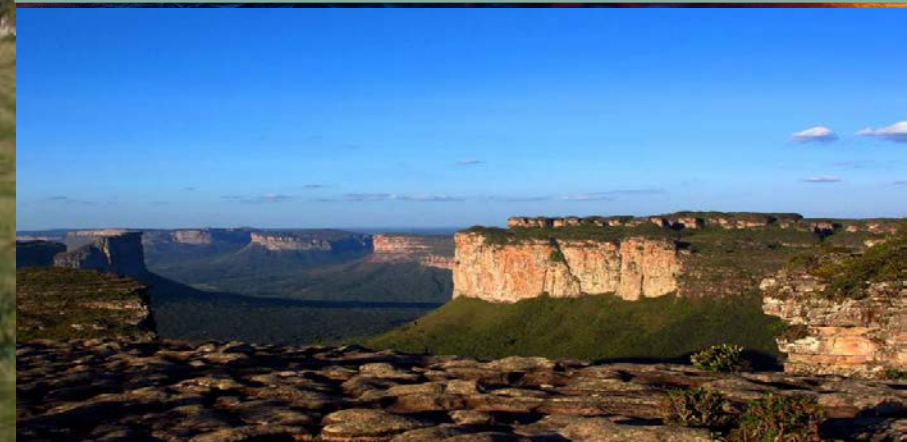
Morro do Pai Inácio, Lençóis Chapada Diamantina