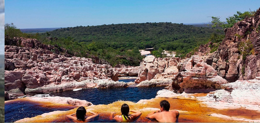
Rio Mucugezinho, Lençóis Chapada Diamantina