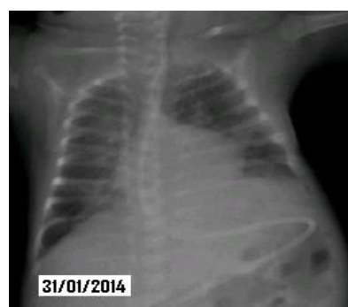
Figura 2: Radiografia torácica com redução da área atelectasiada à esquerda.

No dia seguinte, 31/01/2014, modificou-se o modo ventilatório para CPAP com máscara nasal mantendo PEEP de 8 cmH 2 O, realizada nova radiografia de tórax que mostrou redução da área atelectasiada à esquerda (Figura 2).