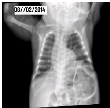
Figura 3: Radiografia torácica sem evidências de atelectasias.

permanecendo uma eventração do diafragma esquerdo devido à paralisia diafragmática (Figura 3). A criança permaneceu estável, sendo retirada da CPAP nasal, respirando em ar ambiente, sem necessidade de cirurgia de plicatura do diafragma esquerdo. Teve alta hospitalar no dia 27/02/2014, com padrão ventilatório eficaz e mamando no seio materno.