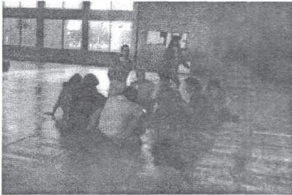
de questões importantes e polêmicas.

Queremos destacar que nos surpreendeu o desconhecimento deles/as sobre o assunto como alternativa para não dar continuidade a que novos casos de deficiência visual surjam através de seus descendentes. (Foto 2)