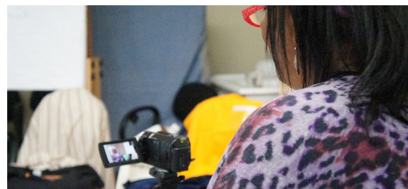
Registro das captações na UNIVENS que ocorreu entre 2014/2015.