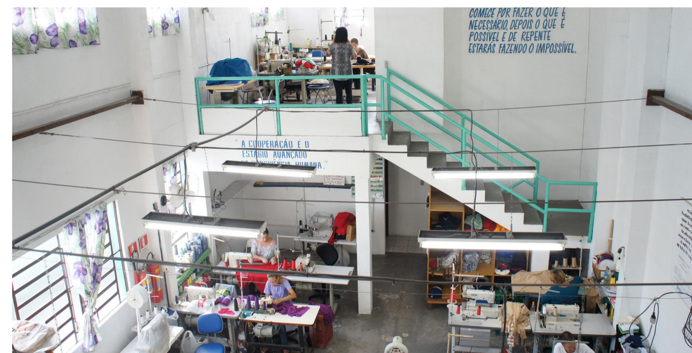
Temática do documentário: Economia Solidária e o trabalho associado na Cooperativa UNIVENS.

Outro aprendizado adquirido no estudo da obra de Coutinho é sua técnica de pré-produção. A equipe do documentarista previamente entrevistava e adquiria informações sobre os potenciais entrevistados antes da gravação do documentário, priorizando a seleção de pessoas com maior capacidade narrativa. Esta é uma das principais técnicas a serem implementadas nas futuras produções de documentário para a pesquisa da qual o bolsista faz parte.