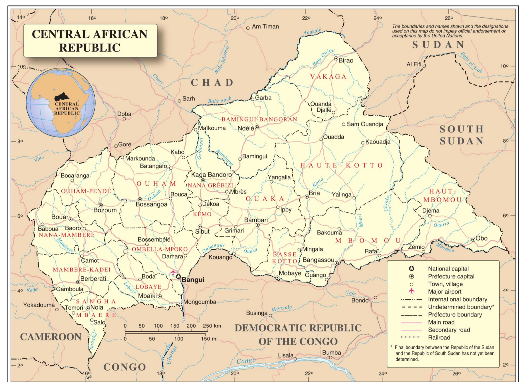
Map No. 4048 Rev. 8 UNITED NATIONS June 2016 Department of Field Support Geospatial Information Section (formerly Cartographic Section)

Resultados parciais: Apesar das eleições significarem um grande passo para o país, deve-se considerar que elas foram pouco efetivas em promoverem mudanças estruturais. Tem-se: (i) a volta dos ataques a civis, (ii) aumento das dificuldades de diálogo e mediação do governo com os grupos rebeldes, (iii) enfraquecimento do apoio popular e da base aliada do presidente Touadéra.