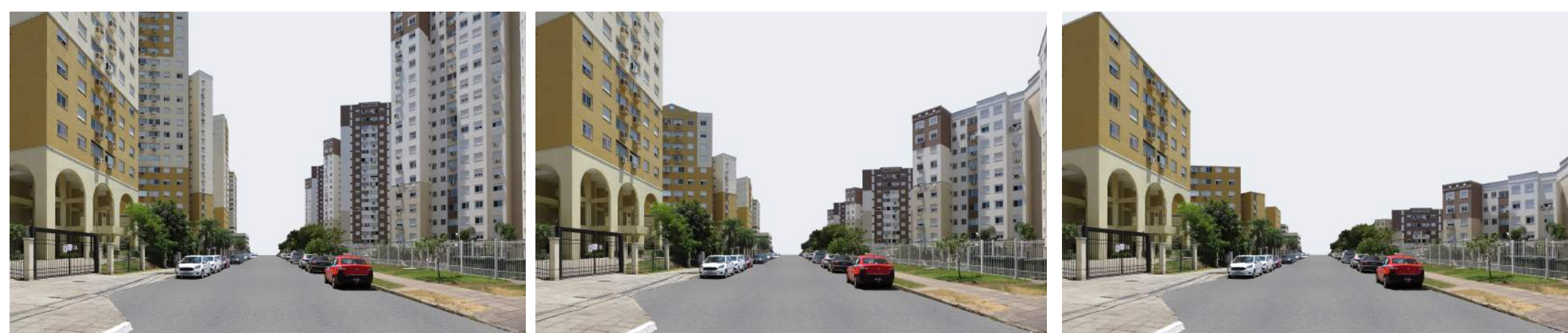
Cena A - Edifício no interior da quadra sem relação direta com a rua com 18 pavimentos Cena B - Edifício no interior da quadra sem relação direta com a rua com 10 pavimentos Cena C - Edifício no interior da quadra sem relação direta com a rua com 5 pavimentos

Os resultados indicam, por exemplo, que as duas cenas com interfaces caracterizadas por edifícios de 18 andares são as menos preferidas por qualquer um dos três grupos de respondentes e que as duas cenas com interfaces constituídas por edifícios com alturas mais baixas tendem a ser as mais preferidas por esses grupos (Tabela 1 e 2). Adicionalmente, a cena com interfaces caracterizadas por ordem e estímulo visual é a cena preferida por qualquer grupo, enquanto a cena com interfaces caracterizadas por desordem é a menos preferida por aqueles com educação universitária e a cena com interfaces com ordem e pouco estímulo visual é a menos preferida pelos não graduados (Tabela 3). Assim, esses resultados contribuem para a compreensão dos efeitos estéticos produzidos por interfaces urbanas distintas e, portanto, para um desenho urbano que qualifique as experiências estéticas dos usuários das cidades nos espaços abertos públicos.