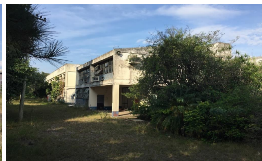
Synteko S/A: Avenida Centenário, RS-030, 1757, Centro, Gravataí - RS